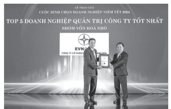
● Ban tổ chức trao giải Top 5 doanh nghiệp quản trị công ty tốt nhất năm 2024 cho PC Khánh Hòa.

Sau gần 6 tháng bình chọn, vượt qua hơn 500 DN niêm yết trên cả hai sàn, Hội đồng bình chọn đã lựa chọn được 44 DN xuất sắc ở 3 hạng mục: Báo cáo thường niên, quản trị công ty và báo cáo phát triển bền vững để chính thức vinh danh.