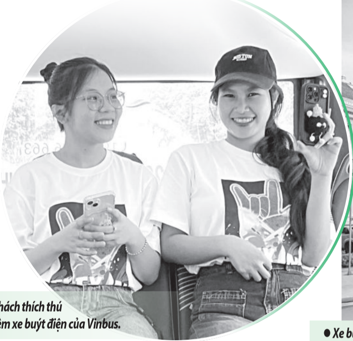
● Nhiều du khách thích thú khi trải nghiệm xe buýt điện của Vinbus.