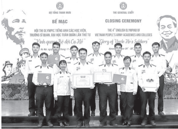
● Đội tuyển Olympic Tiếng Anh Học viện Hải quân tại Hội thi Olympic Tiếng Anh các học viện, trường sĩ quan, đại học toàn quân lần thứ 4, năm 2024.

pháp dạy học ngoại ngữ mới như: “Dạy học kết hợp trực tiếp và trực tuyến” (blended teaching), “Dạy học theo tác vụ” (task-based language teaching)... Trên cơ sở