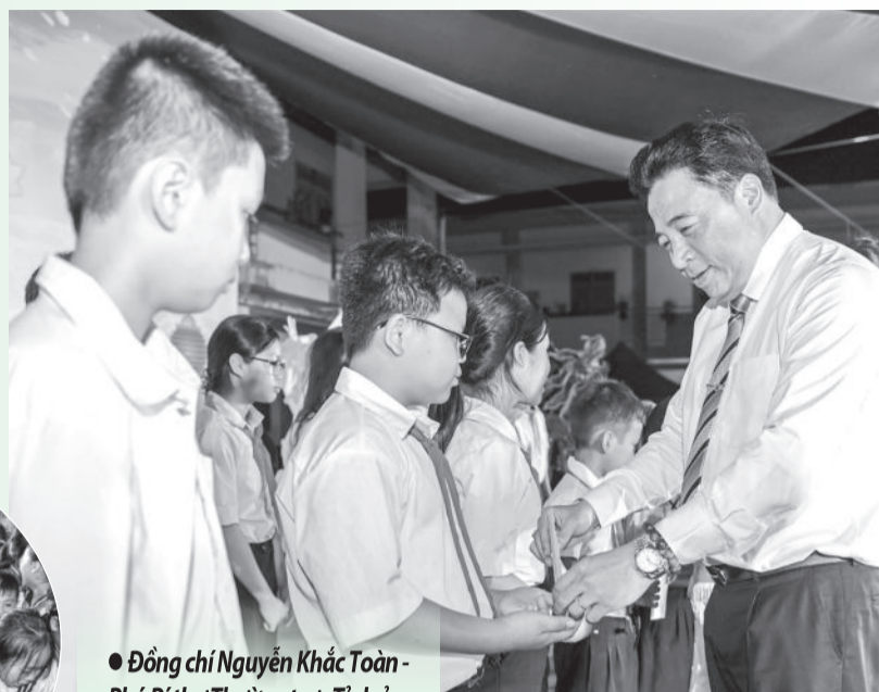
● Đồng chí Nguyễn Khắc Toàn - Phó Bí thư Thường trực Tỉnh ủy, Chủ tịch HĐND tỉnh trao học bổng cho các học sinh xã Ninh Sơn vượt khó học giỏi nhân dịp Tết Trung thu năm 2024.