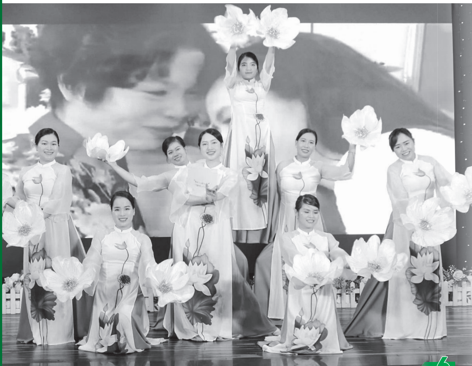
• Tiết mục văn nghệ của các cô giáo mầm non tại lễ kỷ niệm 42 năm Ngày Nhà giáo Việt Nam.