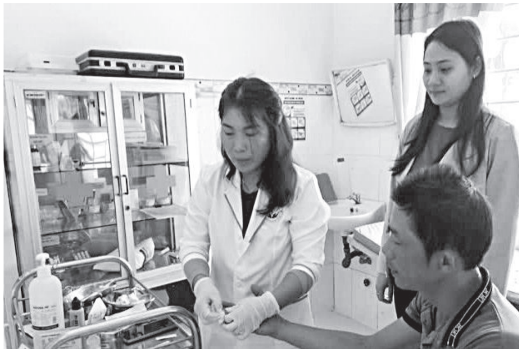
● Lấy mẫu máu xét nghiệm sốt rét cho người dân huyện Khánh Vĩnh.

Theo báo cáo của Bộ Y tế, đến năm 2023, cả nước đã có 46/63 tỉnh, thành phố loại trừ sốt rét; còn lại 17 tỉnh chưa đạt tiêu chí loại trừ, trong đó có Khánh Hòa. Tại Khánh Hòa, số ca mắc sốt rét ghi nhận tăng đột biến vào năm 2023 với 209 ca, 11 tháng năm 2024 toàn tỉnh ghi nhận 194 ca. Trên địa bàn tỉnh có 6 huyện, thị xã, thành phố có ghi nhận số ca mắc sốt rét. Trong đó, có 14 xã có sốt rét lưu hành nặng; 8 xã, phường có số ca mắc sốt rét lưu hành ở mức vừa, 10 địa phương lưu hành nhẹ; 41 xã nguy cơ sốt rét quay lại; 66 xã, phường, thị trấn không có sốt rét lưu hành. Chiếm hơn 90% số ca mắc sốt rét trên địa bàn tỉnh tập trung tại huyện Khánh Vĩnh; trong đó gần 73% số ca mắc tập trung ở người đi rừng, ngủ rẫy. Trong số ca mắc, có