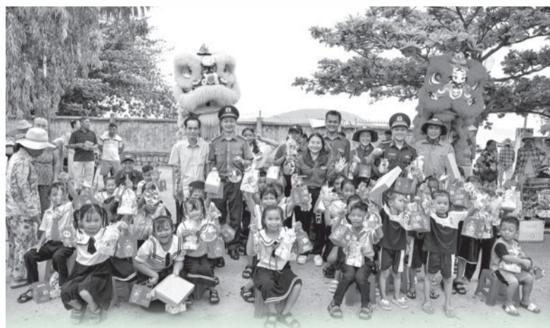
● Chương trình Trung thu được tổ chức cho các học sinh tại thôn đảo Diệp Sơn (xã Vạn Thạnh, huyện Vạn Ninh). Ảnh: V.T