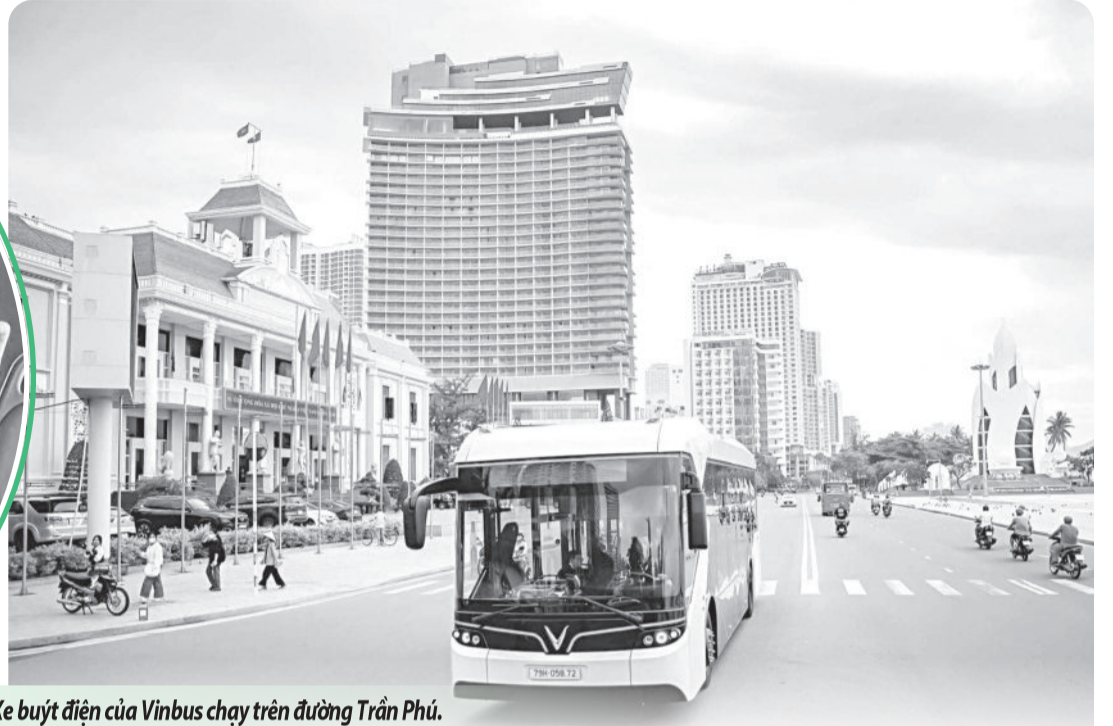
● Xe buýt điện của Vinbus chạy trên đường Trần Phú.