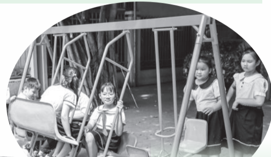
● Khu vui chơi thiếu nhi tại Trường Tiểu học Vinh Trường do các tổ chức đoàn TP. Nha Trang thực hiện.