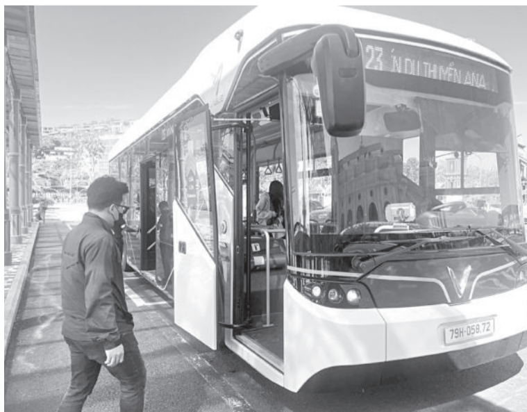
● Du khách lên xe buýt điện tại điểm đầu Vinpearl Nha Trang.