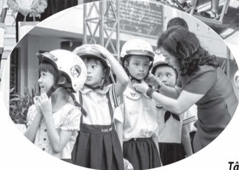
● Chương trình tuyên truyền đội mũ bảo hiểm an toàn cho học sinh Trường Tiểu học Tân Lập 1 (TP. Nha Trang).