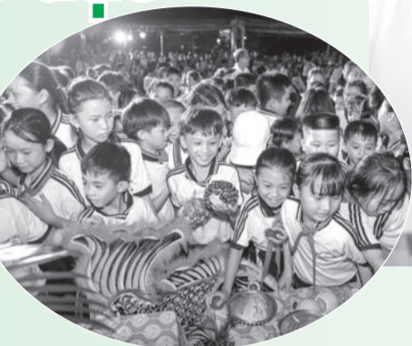
● Chương trình Trung thu được tổ chức cho các học sinh xã Ninh Sơn (thị xã Ninh Hòa).