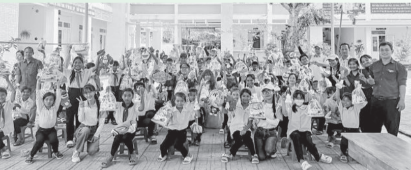
● Các tổ chức đoàn trao quà Trung thu cho học sinh xã Liên Sang (huyện Khánh Vĩnh).