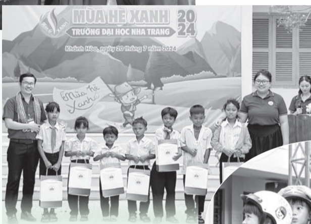
● Đoàn trường Đại học Nha Trang trao quà cho học sinh có hoàn cảnh khó khăn của xã Cam Thịnh Tây, TP. Cam Ranh.