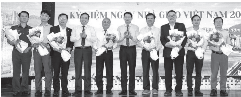
● Đồng chí Đinh Văn Thiệu và lãnh đạo Sở Lao động - Thương binh và Xã hội tặng hoa cho đại diện các cơ sở giáo dục nghề nghiệp.

Chiều 18-11, Sở Lao động - Thương binh và Xã hội tổ chức tọa đàm kỷ niệm 42 năm Ngày Nhà giáo Việt Nam (20-11-1982 - 20-11-2024). Dự lễ có đồng chí Đinh Văn Thiệu - Phó Chủ tịch UBND tỉnh; các nhà giáo, cán bộ quản lý các cơ sở giáo dục nghề nghiệp trên địa bàn tỉnh.