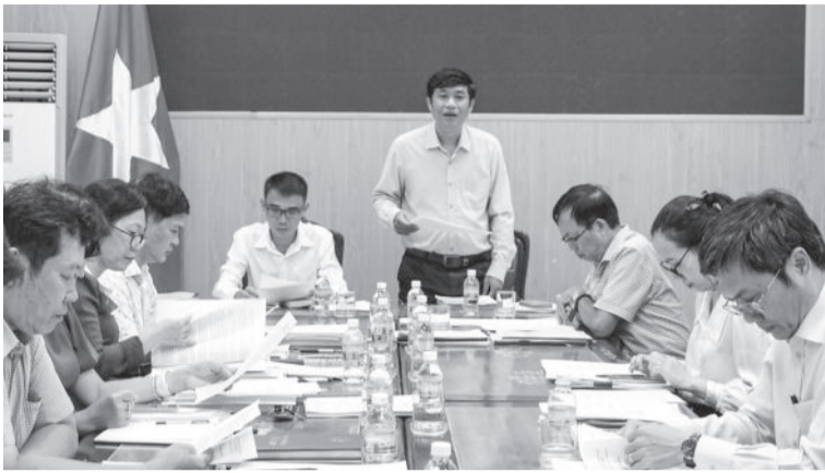
● Quang cảnh cuộc họp thẩm tra của Ban Kinh tế - Ngân sách HĐND tỉnh.

Ban cũng đã tiến hành thẩm tra và cơ bản thống nhất với các nội dung UBND tỉnh trình liên quan đến: Điều chỉnh chủ trương đầu tư Dự án Xây dựng cầu Huyện 2 và đường dẫn (tại huyện Vạn Ninh); chủ trương đầu tư Dự án Sửa chữa, nâng cấp hồ Đá Bàn; chủ trương đầu tư Dự án Xây dựng hạ tầng kỹ thuật Khu tái định cư Vĩnh Trung - Vĩnh Thái giai đoạn 2 (ở TP. Nha Trang). Ban đề nghị UBND tỉnh