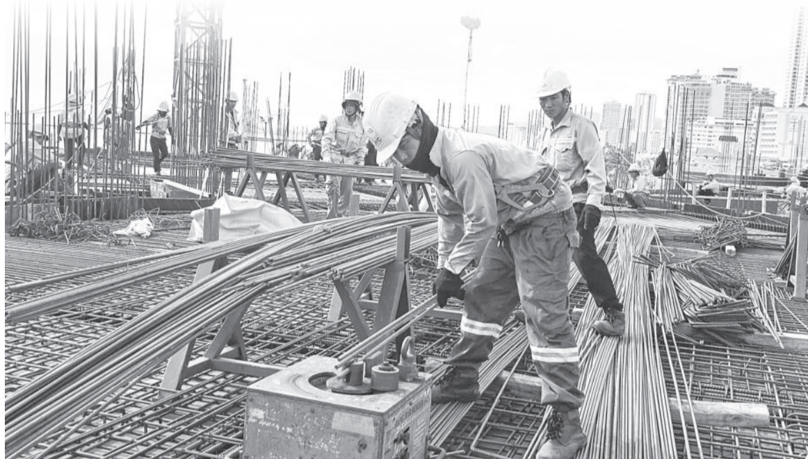
● Thi công trên công trường trụ sở Tỉnh ủy, Đoàn Đại biểu Quốc hội, HĐND, UBND tỉnh.

Ban Quản lý Dự án phát triển tỉnh được giao làm chủ đầu tư 2 dự án trọng điểm để chào mừng Đại hội Đảng bộ tỉnh lần thứ XIX, nhiệm kỳ 2025 - 2030, gồm: Trụ sở làm việc Tỉnh ủy, Đoàn Đại biểu Quốc hội, HĐND, UBND tỉnh và Cung văn hóa thiếu nhi tỉnh. 2 dự án này được các nhà thầu nỗ lực thi công, đang vượt tiến độ đề ra.