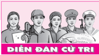
DIỄN ĐÀN CỬ TRI