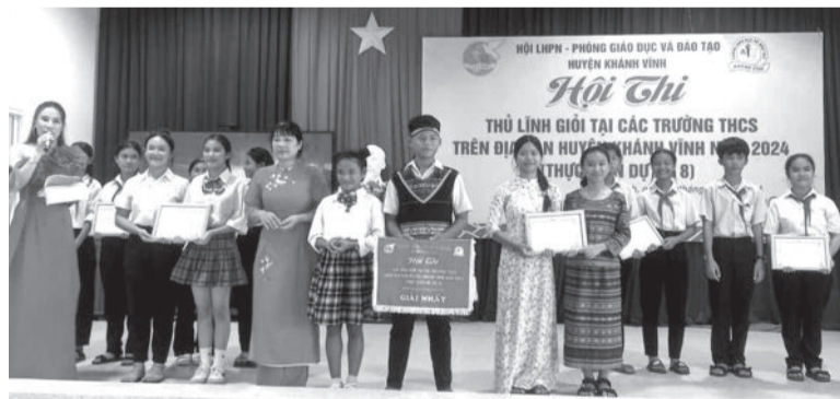
● Ban tổ chức trao giải nhất cho đội Trường THCS Cao Văn Bé.

Ngày 30-10, Hội Liên Hiệp Phụ nữ và Phòng Giáo dục và Đào tạo huyện Khánh Vĩnh phối hợp tổ chức Hội thi thủ lĩnh giỏi tại các trường khối THCS trên địa bàn huyện năm 2024.