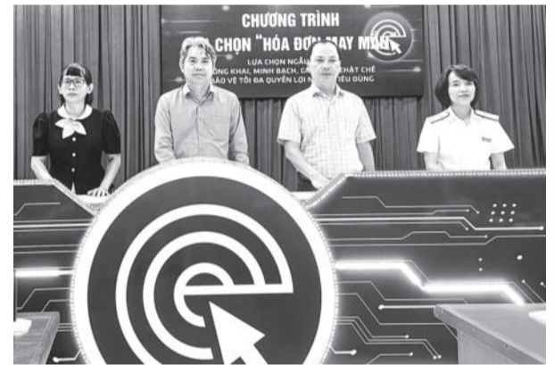
● Các thành viên hội đồng bấm nút lựa chọn hóa đơn may mắn quý III.