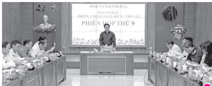
● Quang cảnh phiên họp.

BAN CHỈ ĐẠO PHÒNG, CHỐNG THAM NHŨNG, TIÊU CỰC TỈNH: Họp phiên thứ 9