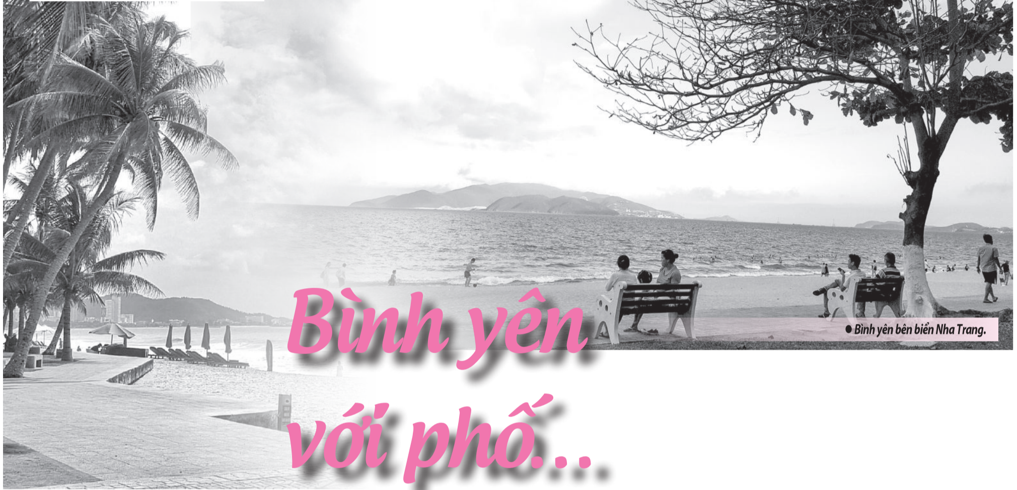
● Bình yên bên biển Nha Trang.