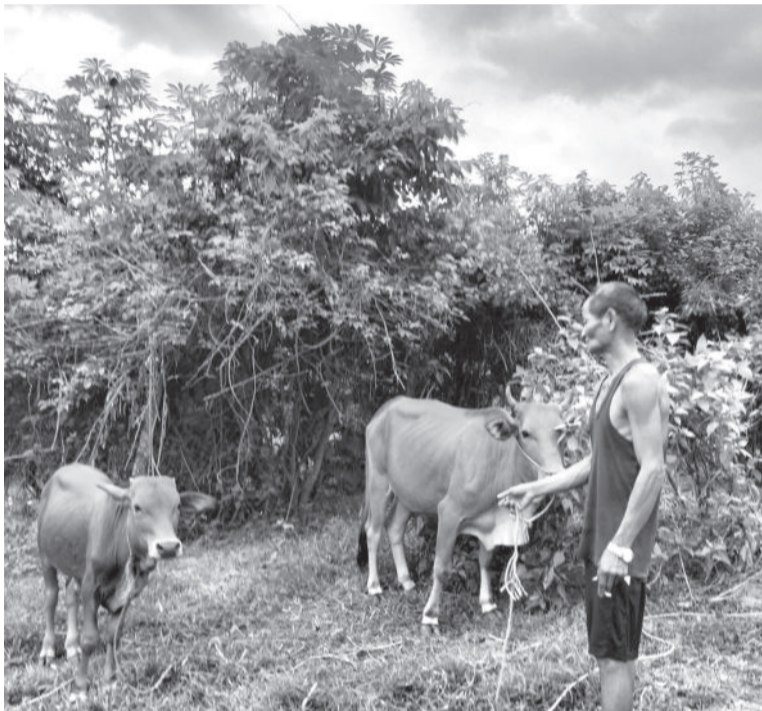
● Ông Cao Văn Lý chăm sóc bò.

Bên cạnh sự hỗ trợ của Nhà nước, những năm qua, tại huyện Khánh Vĩnh, các nhóm được phân công giúp đỡ các xã vùng đồng bào dân tộc thiểu số (ĐBDTTS) và miền núi của tỉnh đã thay đổi phương pháp tiếp cận, hỗ trợ bằng cách trao sinh kế, xây dựng nhà ở cho hộ nghèo. Nhờ đó, nhiều gia đình đã biết cách làm ăn, vươn lên thoát nghèo bền vững.