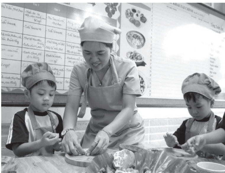
● Cô và cháu Trường Mầm non Tân Lập 1 tham gia hoạt động học theo phương pháp giáo dục Reggio Emilia.

Những năm gần đây, nhiều trường mầm non trên địa bàn TP. Nha Trang đã tiếp cận, vận dụng các phương pháp giáo dục tiên tiến, hiện đại trong tổ chức hoạt động giáo dục. Qua đó, kích thích sự tò mò, sáng tạo và phát huy tốt tính chủ động, tích cực của trẻ.