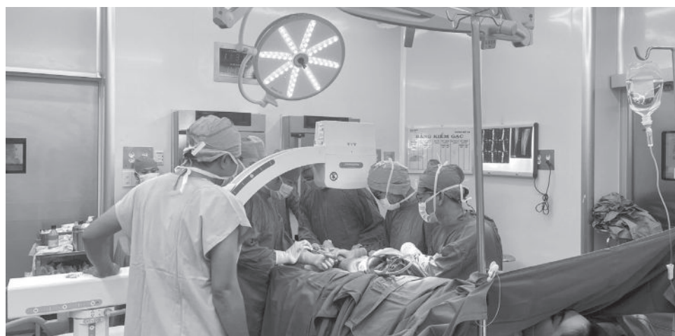
● Thực hiện phẫu thuật dị tật chấn thương chỉnh hình trong đợt tiếp nhận kỹ thuật từ tuyến trên tại Bệnh viện Đa khoa tỉnh.