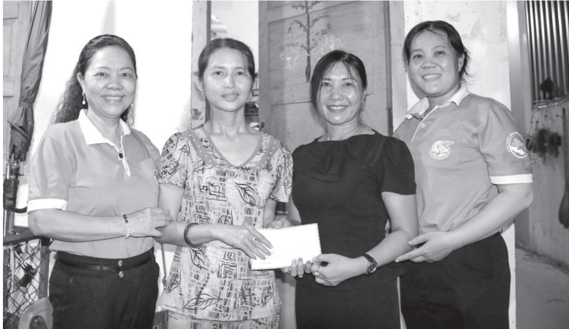
● Mô hình “Cặp lá yêu thương” được Hội Liên hiệp Phụ nữ phường Vinh Hòa thực hiện theo hình thức phụ nữ giúp phụ nữ, phụ nữ giúp trẻ em.

Thông qua mô hình “Cặp lá yêu thương”, các cấp hội phụ nữ trên địa bàn TP. Nha Trang đã và đang giúp đỡ nhiều phụ nữ, trẻ em có hoàn cảnh khó khăn. Đây là mô hình có ý nghĩa nhân văn, tạo sức lan tỏa sâu rộng trong cán bộ, hội viên.