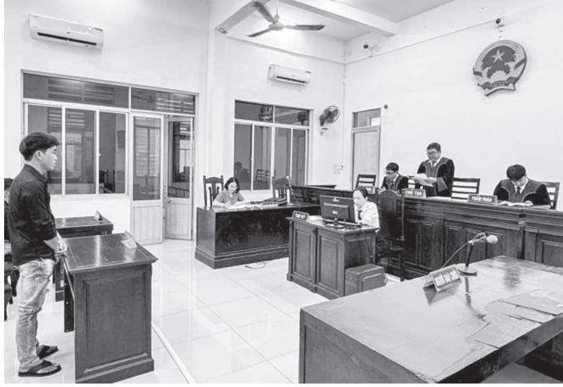
● Quang cảnh phiên tòa phúc thẩm.

2 bị cáo đánh nhau, đôi bên cùng thương tích và đã bị xét xử, nhưng viện kiểm sát kháng nghị, cho rằng việc áp dụng tình tiết giảm nhẹ chưa phù hợp, hình phạt chưa tương xứng. Tháng 9 vừa qua, Tòa án nhân dân tỉnh đã tuyên hủy bản án sơ thẩm.