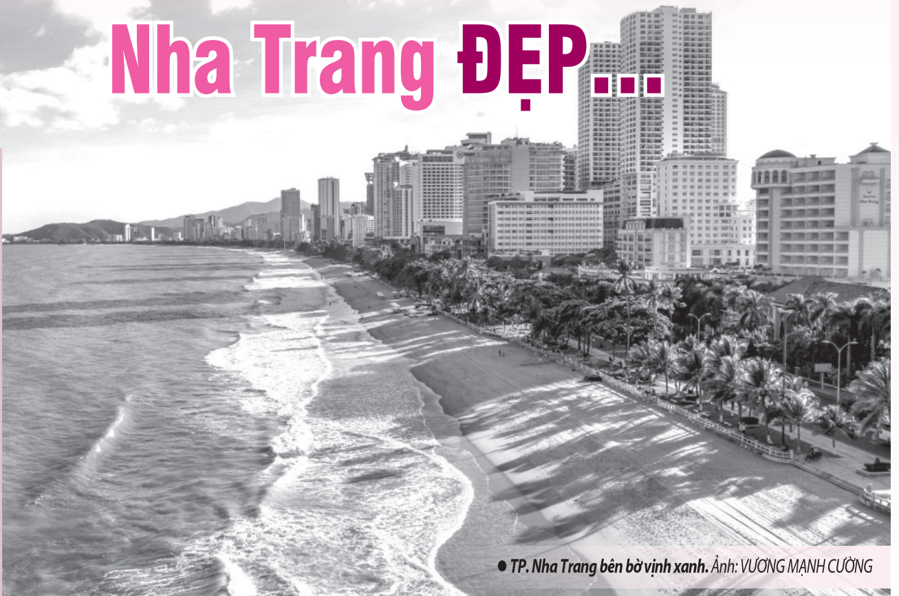
● TP. Nha Trang bên bờ vịnh xanh.

"Nha Trang cười/Nha Trang đẹp/... Tôi lìm dìm cặp mắt/Không thấy nơi nào không đẹp/Không giàu". Đó là mấy câu trong bài thơ nổi tiếng "Tình sông núi" của nhà thơ Trần Mai Ninh viết khi Cách mạng tháng Tám vừa thành công, cả nước bắt đầu bước vào cuộc kháng chiến 9 năm chống thực dân Pháp xâm lược. Cũng như nhà thơ Trần Mai Ninh, từ xưa đến nay, đến Nha Trang không ai không bị cuốn hút bởi vẻ đẹp của thành phố biển. Đặc biệt, với các nhà văn, nhà thơ, Nha Trang không chỉ là điểm đến, điểm dừng chân thường ngoạn, mà còn là nơi khơi dậy nguồn cảm hứng để sáng tác.