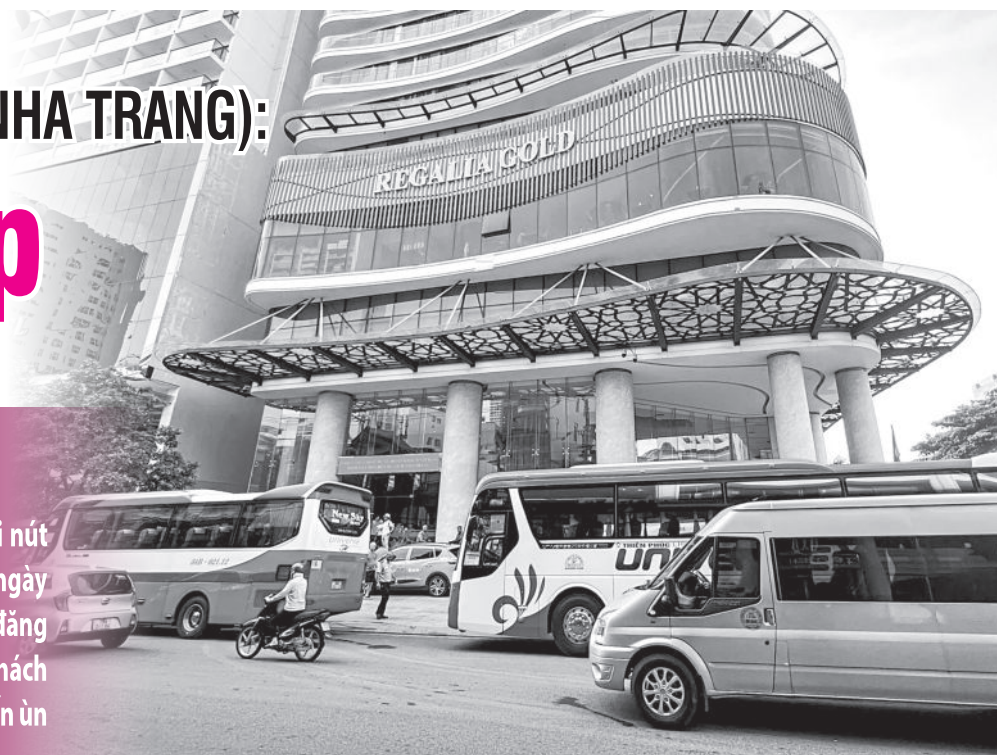
● Khu vực nút giao Tô Hiến Thành - Nguyễn Thị Minh Khai.

Sau khi Báo Khánh Hòa có các tin, bài phản ánh tình trạng “Ùn tắc giao thông tại nút giao Tô Hiến Thành - Nguyễn Thị Minh Khai (Nha Trang): Xử lý chưa triệt để” (đăng ngày 24-10) và “Hỗn loạn giao thông tại ngã ba Tô Hiến Thành - Nguyễn Thị Minh Khai” (đăng ngày 25-10), Công ty Cổ phần Đầu tư thương mại và dịch vụ Nhật Tiến (chủ đầu tư Khách sạn Regalia Gold) đã có văn bản gửi Báo Khánh Hòa nói rõ hơn về nguyên nhân dẫn đến ùn tắc giao thông ở khu vực này và giải pháp khắc phục trong thời gian tới.