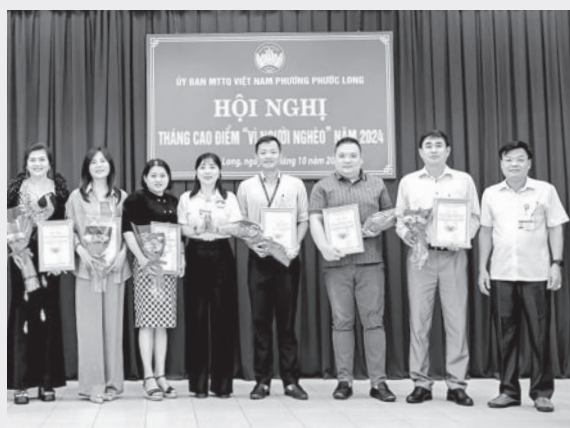
● Đại diện Mặt trận phường Phước Long tri ân tập thể, cá nhân đã có nhiều đóng góp, hỗ trợ người nghèo.

phường hỗ trợ cho 15 trường hợp mắc bệnh hiểm nghèo, mỗi trường hợp 2 triệu đồng và 1 phần quà; đồng thời tri ân 12 tập thể và cá nhân đã có nhiều đóng góp, hỗ trợ cho các hộ nghèo trên địa bàn phường năm 2024. (K.Hà)