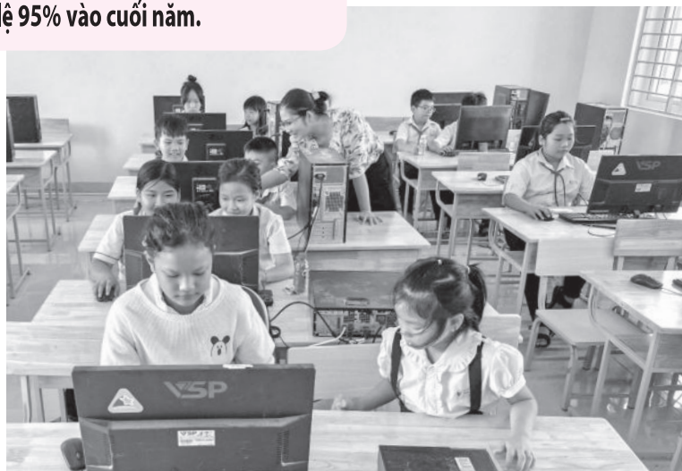
● Phòng Tin học của Trường Tiểu học Diên Xuân.

Công trình Trường Tiểu học Diên Xuân do Ban Quản lý Dự án các công trình xây dựng huyện làm chủ đầu tư đã hoàn thành đúng tiến độ và kịp thời đưa vào phục vụ năm học 2024 - 2025. Ban đầu, công trình có tổng nguồn vốn đầu tư 28 tỷ đồng, trong đó vốn ngân sách tỉnh 8 tỷ đồng, ngân sách huyện 20 tỷ đồng. Đến nay, công trình đã giải ngân xong với tổng vốn đầu tư thực tế gần 23 tỷ đồng (vốn ngân sách tỉnh 8 tỷ đồng và ngân sách huyện gần 15 tỷ đồng). Đơn vị thi công đang hoàn tất các công trình phụ trợ,