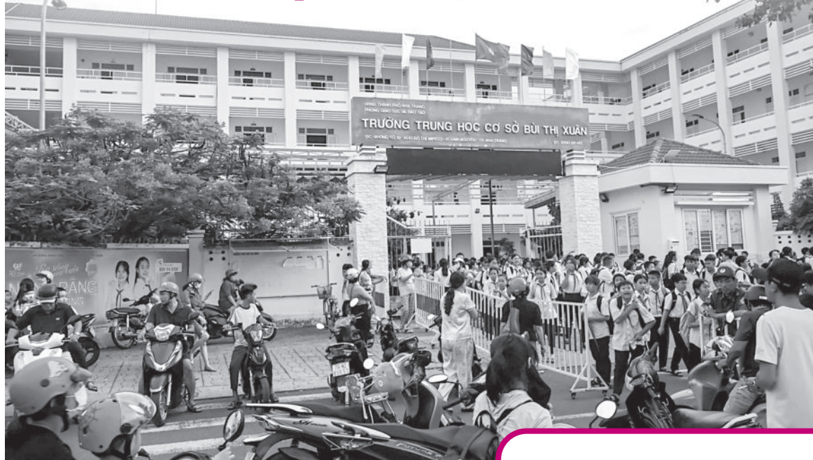
● Phụ huynh đón con sau giờ tan học tại Trường THCS Bùi Thị Xuân.

Phòng GD-ĐT đã quán triệt tất cả các trường không được thu các khoản trái quy định và nhắc nhở Trường THCS Bùi Thị Xuân về các khoản thu dịch vụ nói trên. Thực hiện chỉ đạo của Phòng GD-ĐT TP. Nha Trang, nhà trường đã trả lại các khoản thu trên cho phụ huynh (hoàn thành trong 2 ngày 23 và 24-9), đồng thời báo cáo Phòng GD-ĐT thành phố.