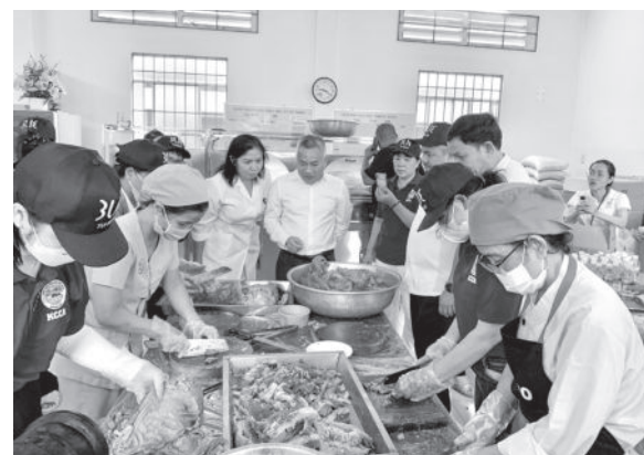
● Lãnh đạo Bệnh viện Đa khoa tỉnh cùng đại diện Hiệp hội Văn hóa ẩm thực Khánh Hòa kiểm tra việc nấu phở.