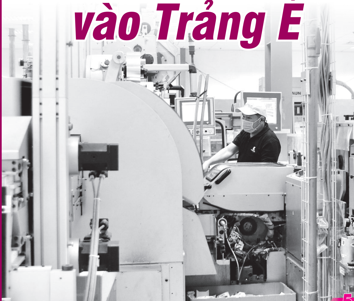
● Hoạt động sản xuất của doanh nghiệp thuộc Tổng Công ty Khánh Việt tại Cụm Công nghiệp Trảng É 1.