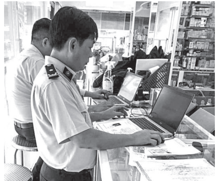
● Lực lượng quản lý thị trường kiểm tra thực tế tại địa điểm kinh doanh.