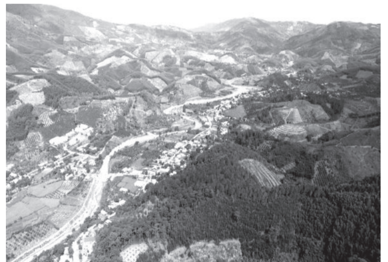
● Một góc khu vực đồi núi huyện Khánh Sơn.

Theo báo cáo nghiên cứu khả thi đã được phê duyệt, công trình là loại đường cấp III miền núi, có bề rộng 9m, gồm 2 làn xe, không có dải phân