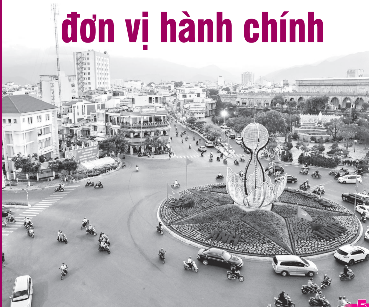
● Một góc TP. Nha Trang.