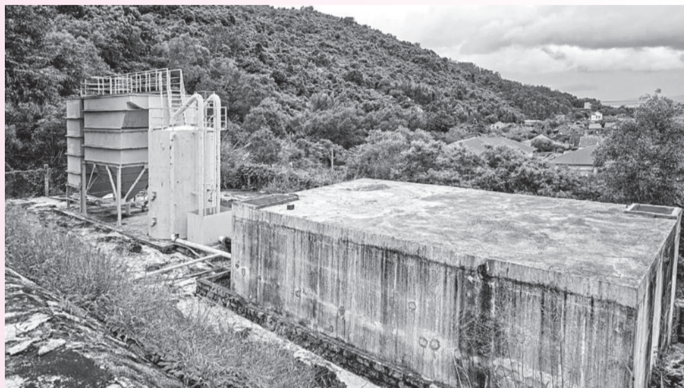
● Một phần công trình hệ thống nước sinh hoạt xã Đại Lãnh đã được triển khai.

Năm 2021, UBND tỉnh đã chấp nhận chủ trương đầu tư Dự án Hệ thống cấp nước sạch cho người dân xã Đại Lãnh, nhưng từ đó đến nay công trình này vẫn chưa được triển khai; trong khi hàng nghìn hộ dân ở địa phương không có nước sạch để dùng.