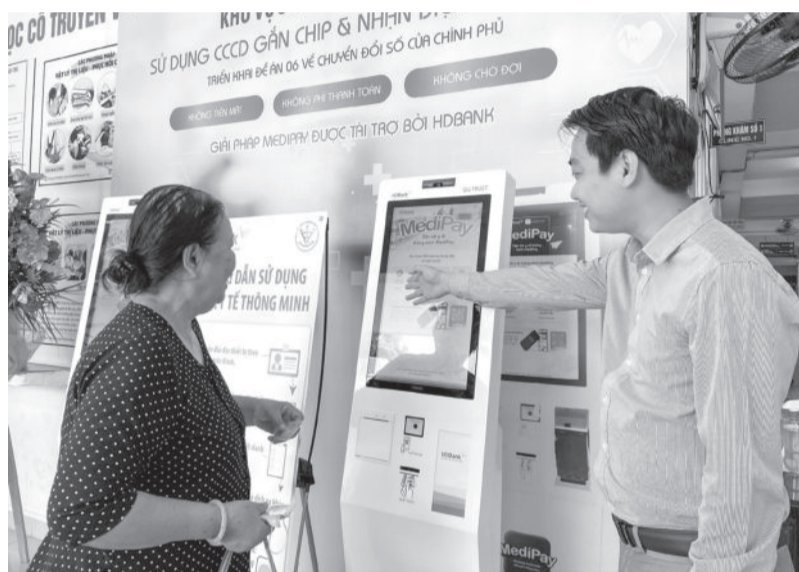
● Người bệnh được hướng dẫn sử dụng các tiện ích từ Kiosk y tế thông minh tại Bệnh viện Y học cổ truyền - Phục hồi chức năng tỉnh.

Năm 2022, Bộ Y tế ban hành Quyết định số 2955 phê duyệt kế hoạch thúc đẩy phát triển và sử dụng các nền tảng số y tế thực hiện chương trình chuyển đổi số quốc gia đến năm 2025, định hướng đến năm 2030. Thực hiện Quyết định số 2955, hầu hết các cơ sở y tế công lập trên địa bàn tỉnh đã triển khai nhiều hoạt động, nội dung, chương trình chuyển đổi số nhằm nâng cao chất lượng khám, chữa bệnh, chăm sóc sức khỏe cho người dân.