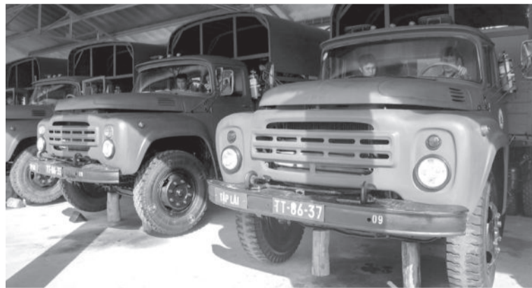
● Một giờ thực hành của các học viên đào tạo lái xe quân sự.

Thời gian qua, Trường Trung cấp Kỹ thuật Miền Trung đã triển khai đồng bộ nhiều giải pháp nhằm nâng cao chất lượng đào tạo cho các đối tượng, đặc biệt là đào tạo lái xe quân sự, bảo đảm đầy đủ, kịp thời cho quân đội và cung cấp nguồn nhân lực có chất lượng cho đất nước.