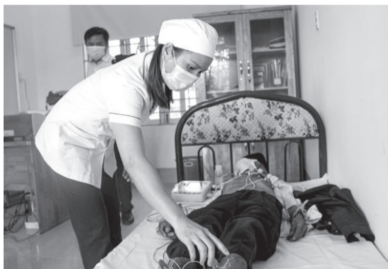
● Chăm sóc sức khỏe cho đồng bào dân tộc thiểu số huyện Khánh Sơn.

bộ 3 chương trình mục tiêu quốc gia: Giảm nghèo bền vững, phát triển kinh tế - xã hội vùng ĐBDTTS và miền núi, xây dựng nông thôn mới và đề án tổng thể giảm nghèo bền vững, địa phương còn tập trung tối đa các nguồn lực để hỗ trợ người dân thoát nghèo bền vững. Những năm qua, huyện đã phát huy thế mạnh về