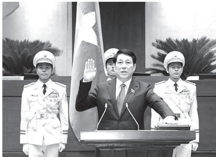
● Chủ tịch nước CHXHCN Việt Nam Lương Cường tuyên thệ trước Quốc hội và đồng bào cử tri cả nước.