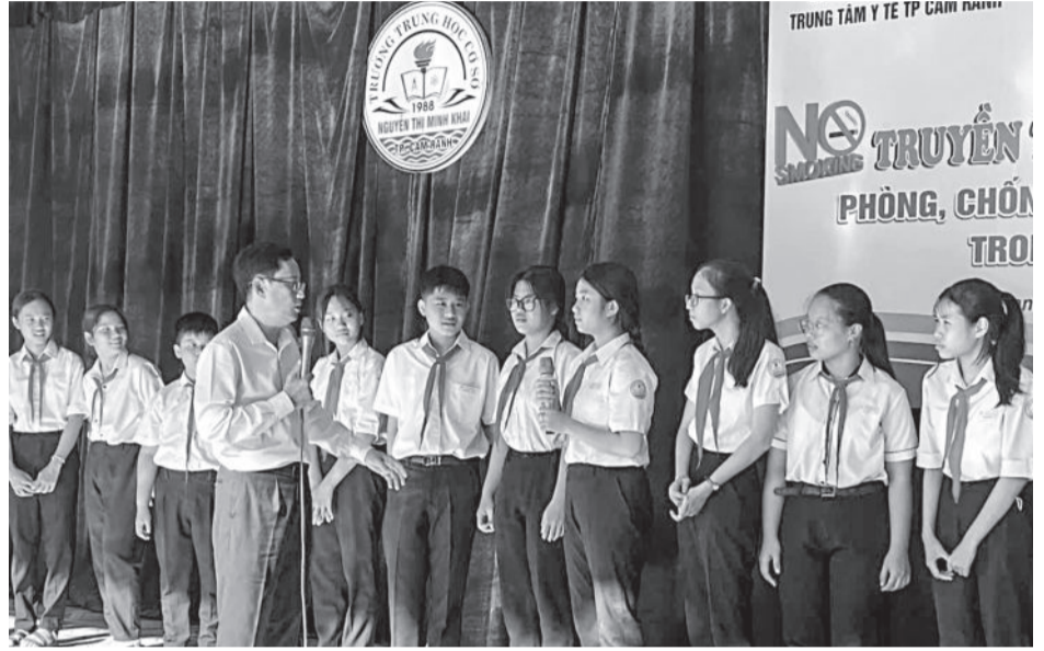
● Truyền thông phòng, chống tác hại của thuốc lá cho học sinh Trường THCS Nguyễn Thị Minh Khai.

tỉnh, các tiêu chí xây dựng trường học không khói thuốc lá gồm: Có niêm yết quy định cấm hút thuốc lá tại nơi có nhiều người qua lại; có treo biển báo cấm hút thuốc lá trong phòng học, phòng làm việc, phòng ăn, hành lang, cầu thang, các khu vực công cộng khác trong trường; có kế hoạch triển khai thực hiện Luật PCTHCTL; không có hiện tượng mua bán, quảng cáo sản phẩm thuốc lá trong khuôn viên nhà trường; không có các vật dụng liên quan đến việc hút thuốc như gạt tàn, bật lửa trong phòng học, phòng làm việc...; không có hiện tượng hút thuốc và đầu mẩu thuốc lá trong các lớp học, phòng họp, phòng làm việc và toàn bộ khuôn viên nhà trường. Đồng thời, đưa nội dung không hút thuốc vào tiêu chí bình xét thi đua của cán bộ, giáo viên, học sinh;