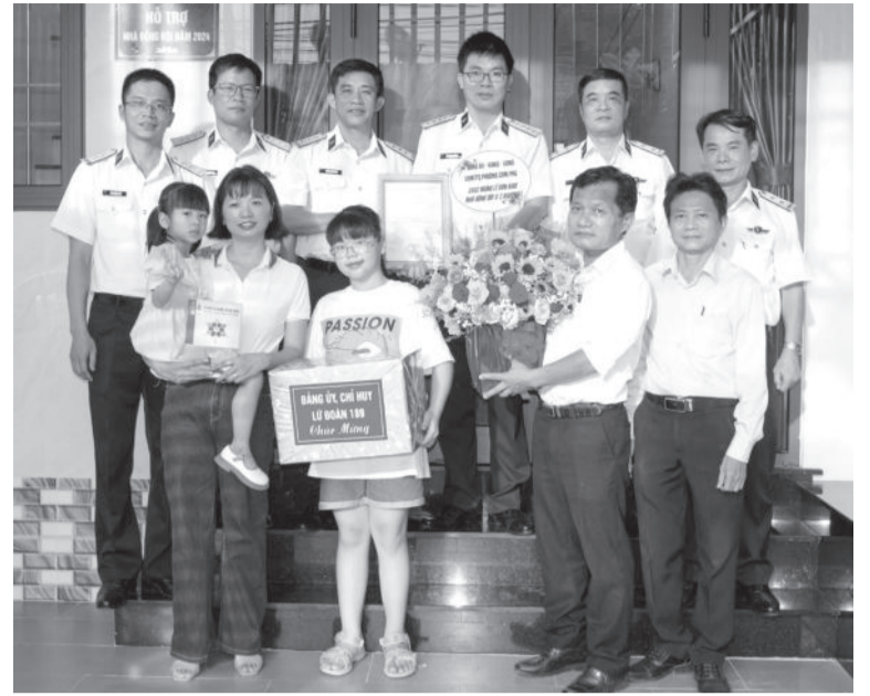
● Lữ đoàn 189 Hải quân tổ chức bàn giao "Nhà đồng đội" cho quân nhân có hoàn cảnh khó khăn.

Theo chỉ huy lữ đoàn, ngoài các nhiệm vụ trọng tâm, đơn vị luôn xác định công tác hậu phương quân đội, hỗ trợ người dân, đảm bảo an sinh xã hội là nhiệm vụ chính trị quan trọng. Cấp ủy, chỉ huy lữ đoàn đã quán triệt, chỉ đạo các cơ quan, đơn vị hưởng ứng, triển khai hiệu quả các nội dung công tác dân vận. Thời gian qua, đơn vị đã triển khai có hiệu quả công tác hỗ trợ người dân có hoàn cảnh khó khăn trên địa bàn tỉnh. Cụ thể như: Tặng 20 suất quà trị giá 10 triệu đồng cho hộ