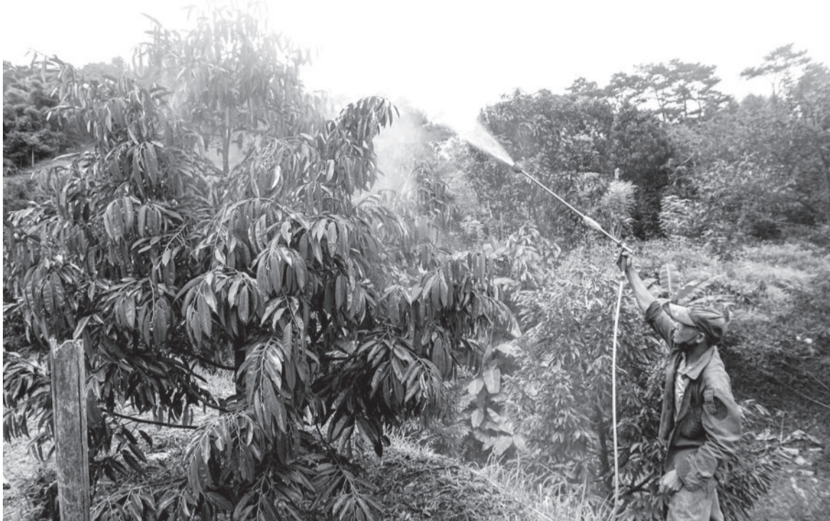
● Đồng bào dân tộc thiểu số ở huyện Khánh Sơn vươn lên thoát nghèo bền vững nhờ trồng cây ăn quả.