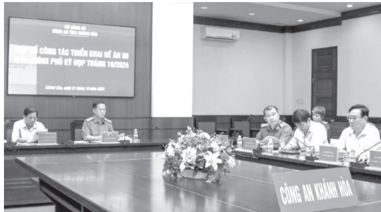
● Các đại biểu tham dự hội nghị tại điểm cầu Khánh Hòa.