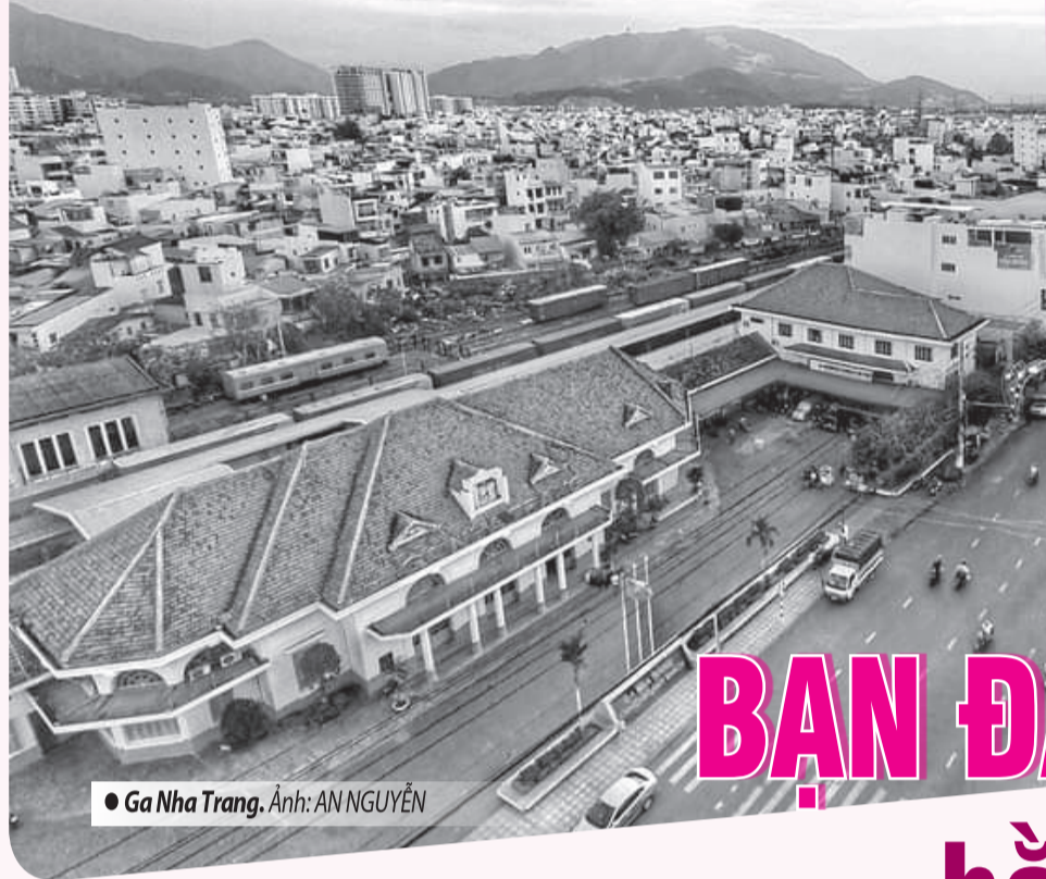
● Ga Nha Trang.