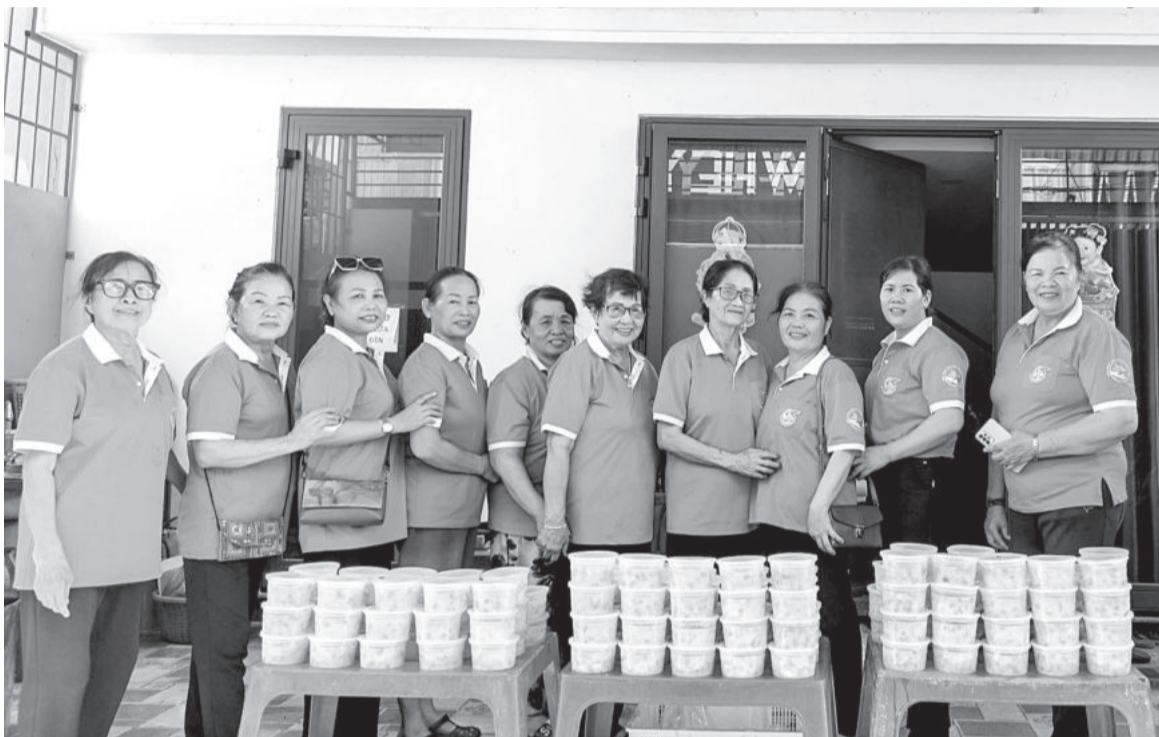
● Các thành viên Câu lạc bộ Phụ nữ tôn giáo làm thiện nguyện ở phường Phước Hải chuẩn bị những suất ăn tặng người có hoàn cảnh khó khăn.

Thời gian qua, các câu lạc bộ (CLB), mô hình phụ nữ tôn giáo ở TP. Nha Trang đã thực hiện nhiều chương trình, hoạt động ý nghĩa để giúp đỡ người có hoàn cảnh khó khăn, yếu thế trong cộng đồng. Qua đó, phát huy truyền thống “sống tốt đời đẹp đạo”, góp phần chung tay phát triển kinh tế - xã hội ở địa phương.