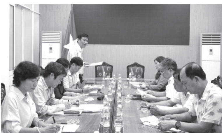
● Quang cảnh buổi làm việc của đoàn giám sát với Ban Quản lý Dự án đầu tư xây dựng các công trình nông nghiệp và phát triển nông thôn tỉnh.

Theo báo cáo, BQL Dự án đầu tư xây dựng các công trình nông nghiệp và phát triển nông thôn tỉnh được giao tổng kế hoạch vốn đầu tư công thực hiện năm 2024 hơn 80,5 tỷ đồng; đến cuối tháng 9 đã giải ngân được 19,4%. Tổng kế hoạch vốn kéo dài năm 2023 sang năm 2024 hơn 134,6 tỷ đồng; đến nay đã giải ngân được 18,18%. Nhiều dự án do BQL làm chủ đầu tư như: Hệ thống kênh đập dâng Chì Trừ (thị xã Ninh Hòa); đầu tư cơ sở hạ tầng chống