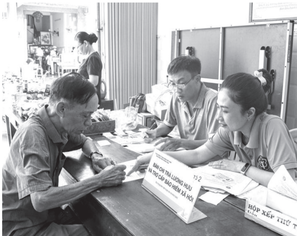
● Từ tháng 10-2024, Bảo hiểm xã hội tỉnh trực tiếp chuyển tiền chi trả lương hưu, trợ cấp bảo hiểm xã hội cho người hưởng qua tài khoản cá nhân.

Xác định công tác phục vụ người hưởng là một trong những nhiệm vụ trọng tâm, ngành Bảo hiểm xã hội (BHXH) luôn quan tâm cải cách thủ tục hành chính, giảm khâu trung gian để chi trả kịp thời cho người hưởng. Với tinh thần để người hưởng nhận được tiền ngay từ đầu tháng, từ ngày 3-10-2024, BHXH tỉnh sẽ thực hiện trực tiếp chuyển tiền chi trả lương hưu, trợ cấp BHXH hàng tháng qua tài khoản cá nhân cho người hưởng.