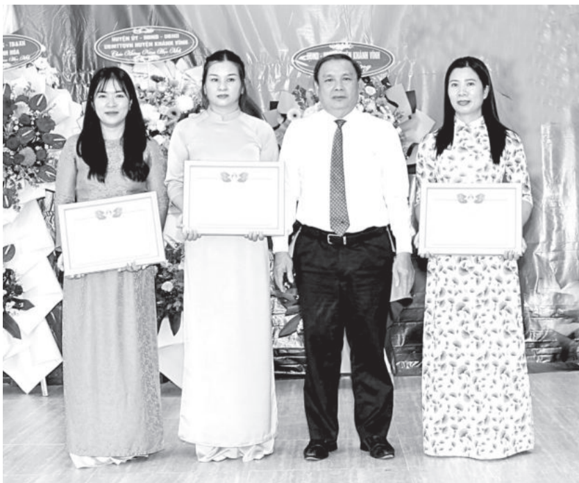
● Lãnh đạo Sở Lao động - Thương binh và Xã hội trao giấy khen cho tập thể, cá nhân xuất sắc.