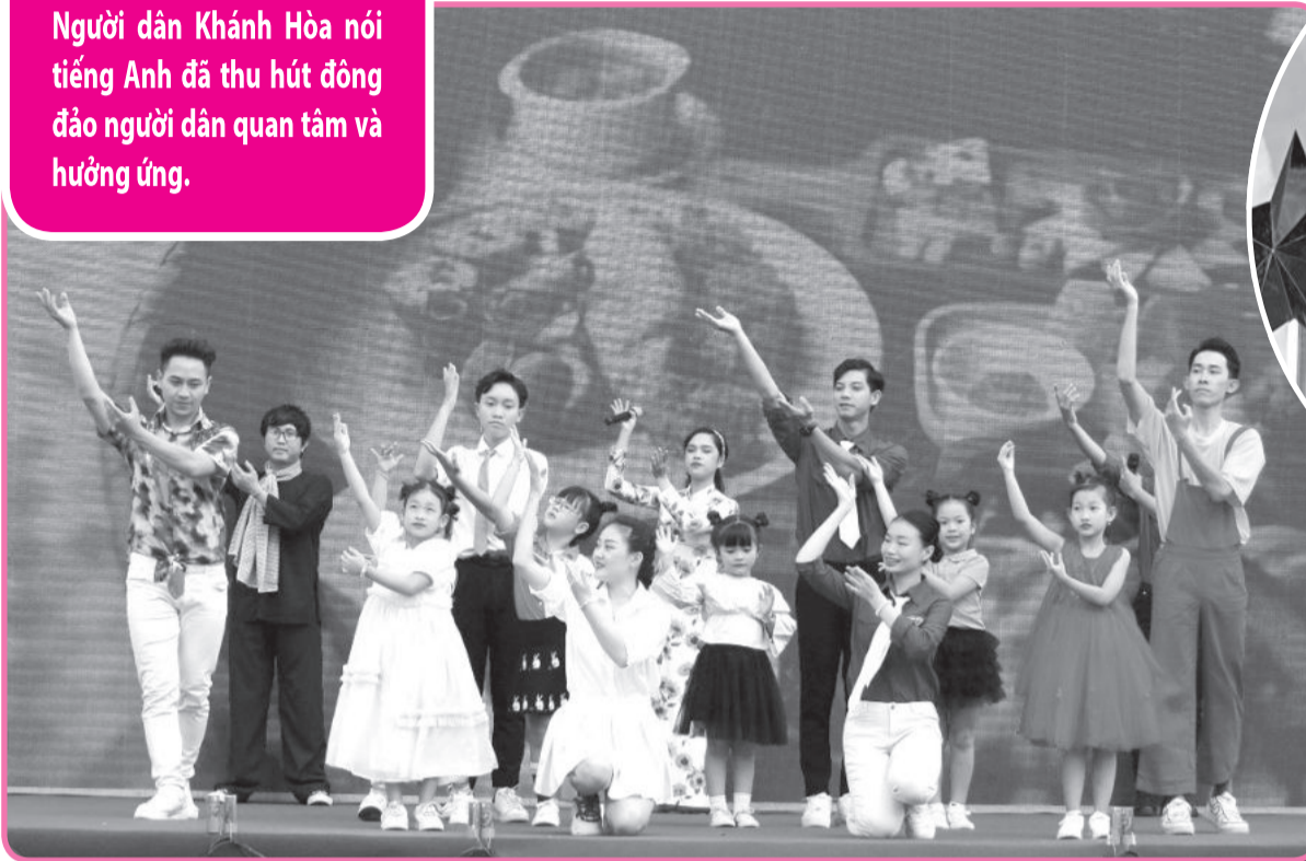
● Biểu diễn hát múa tại lễ khởi động Chương trình Người dân Khánh Hòa nói tiếng Anh.

Thông qua các nền tảng mạng xã hội, Chương trình Người dân Khánh Hòa nói tiếng Anh đã thu hút đông đảo người dân quan tâm và hưởng ứng.