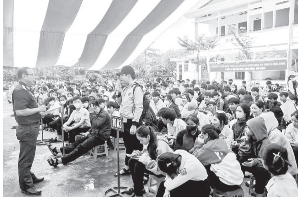
● Học sinh tham gia giao lưu, trả lời câu hỏi của Ban tổ chức.

tình nguyện tham gia thực hiện nghĩa vụ quân sự. Vì thế, em rất lưu tâm đến những nội dung của Luật Nghĩa vụ quân sự, các quy định liên quan được các cán bộ Ban Chỉ huy Quân sự (CHQS) huyện truyền đạt hôm nay”.