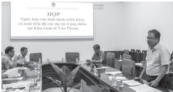
● Đồng chí Trần Hòa Nam phát biểu tại cuộc họp.

Chiều 30-9, đồng chí Trần Hòa Nam - Phó Chủ tịch UBND tỉnh chủ trì cuộc họp nghe các sở, ban, ngành báo cáo tiến độ các dự án trọng điểm tại Khu Kinh tế (KKT) Vân Phong.