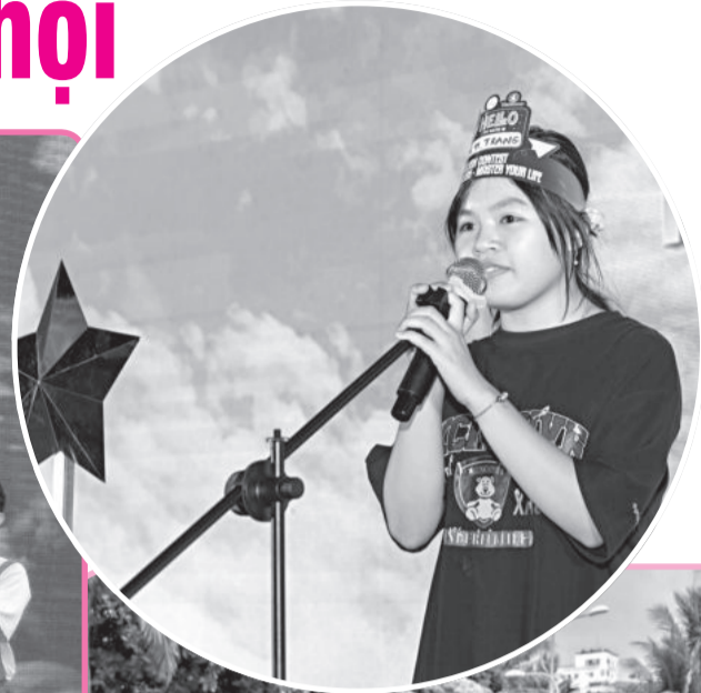
● Thí sinh tham gia cuộc thi Master English - Master your life tại thị xã Ninh Hòa.

lý Chương trình Người dân Khánh Hòa nói tiếng Anh, việc truyền thông qua mạng xã hội đã góp phần lan tỏa chương trình đến đông đảo người dân. Từ đó, đã có 80.000 người dân thuộc các nhóm đối tượng, gồm: Cán bộ, công chức, viên chức của các sở, ban, ngành, đoàn viên, thanh niên, tiểu thương, học sinh, sinh viên, công an, bộ đội... tham gia các sự kiện và cuộc thi nói tiếng Anh, hát tiếng Anh Sing to Shine, hùng biện tiếng Anh, thi kể chuyện tiếng Anh, thi rung chuông vàng, đấu trường 100, Master English - Master your life và các gameshow tiếng Anh cộng đồng. Hiện nay, Chương trình Người dân Khánh Hòa nói tiếng Anh đã được mở rộng tại 6/8 huyện, thị xã, thành phố của tỉnh là: Nha Trang, Cam Lâm, Diên Khánh, Vạn Ninh, Ninh Hòa, Cam Ranh. Do đó, các hoạt động, sự kiện của chương trình sẽ tiếp tục được đẩy mạnh, đồng thời đăng tải trên các trang mạng xã hội để tạo sức lan tỏa, truyền cảm hứng và niềm yêu thích tiếng Anh đến đông đảo người dân hơn nữa.