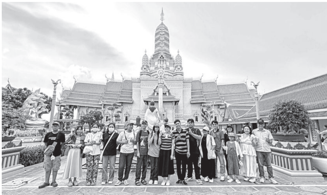
● Các nhà vô địch cuộc thi chung kết năm Master English - Master your life tham gia chuyến du lịch tại Thái Lan.