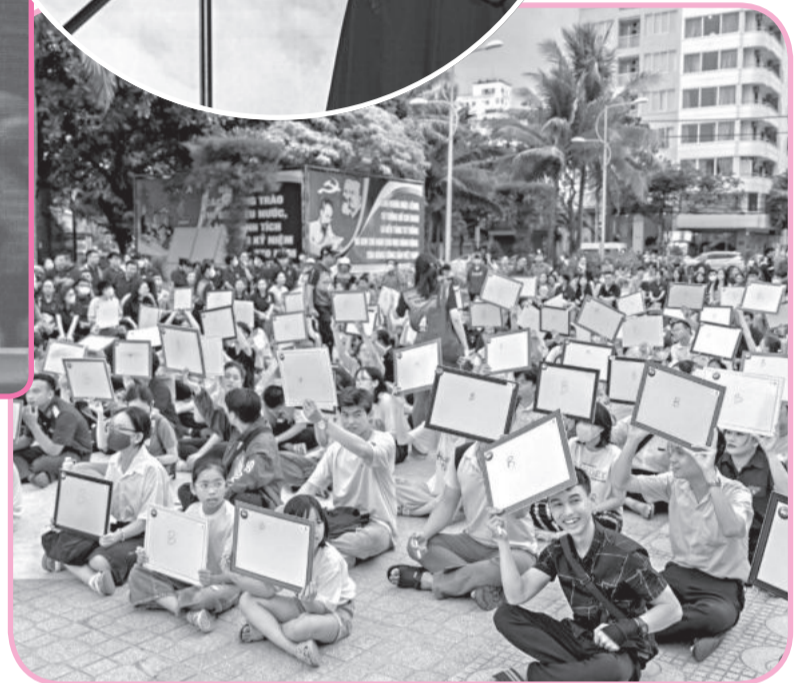
● Cuộc thi Rung chuông vàng tiếng Anh dành cho người dân TP. Nha Trang.