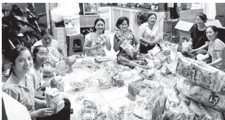
● Các hội viên phụ nữ tôn giáo ở phường Vĩnh Thọ chuẩn bị quà Trung thu cho các em thiếu nhi.