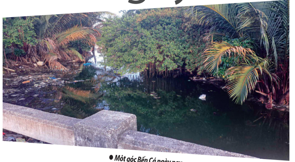
● Một góc Bến Cá ngày nay.

Vào khoảng những năm 50 trở về trước, những người làm nghề lưới đăng ở thôn Phường Cùi xưa (thuộc phường Phương Sài, TP. Nha Trang) còn đi biển bằng thuyền buồm chèo tay. Thời đó, những người đi biển chưa biết tới mỏ neo sắt, chỉ có mỏ neo gỗ. Người ta đeo neo bằng gỗ rồi cột thêm một cục đá. Neo gỗ cũng có chân mỏ để cắm xuống cát. Gỗ ngâm nước mặn vậy mà chắc lắm. Gió bão có khi làm đứt dây mà vẫn không nhổ được neo lên. Một ghe lưới đăng đi biển phải dùng cỡ hơn 30 cái mỏ neo gỗ để vừa giữ ghe vừa giữ lưới, không chỉ dùng một cái mỏ neo sắt như ghe dò bây giờ. Vậy mới có những người chuyên đi núi chặt những loại cây gỗ cứng về đeo neo bán cho các ghe lưới đăng đặt họ làm.