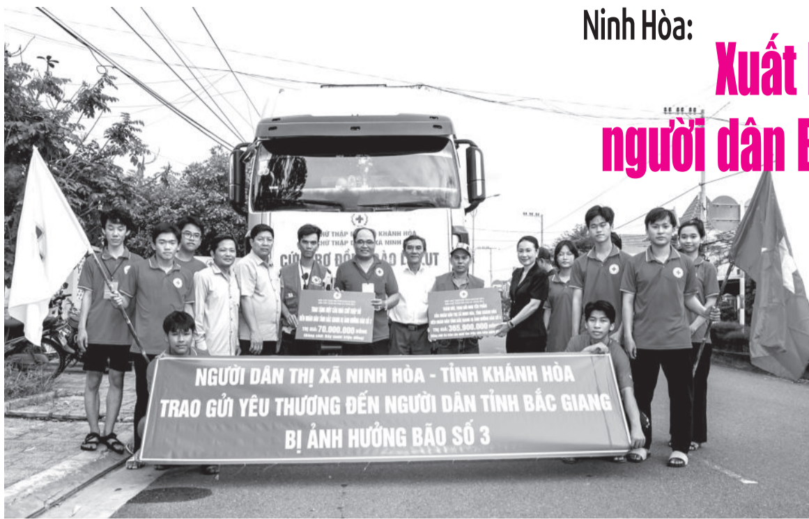
● Lãnh đạo thị xã Ninh Hòa động viên đoàn cứu trợ trước khi lên đường.

Sau gần 10 ngày kêu gọi, vận động, chiếu muộn 20-9, chuyến xe cứu trợ, mang theo tình cảm, sẻ chia của người dân thị xã Ninh Hòa đã chính thức xuất phát nhằm động viên, tiếp sức cho người dân ở tỉnh Bắc Giang sớm vượt qua khó khăn, khắc phục thiệt hại do cơn bão số 3 gây ra.