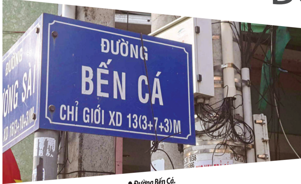
● Đường Bến Cá.