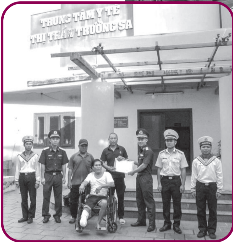
● Trung tâm Y tế thị trấn Trường Sa hỗ trợ cấp cứu thành công ngư dân bị đứt gân lia vùng cổ chân phải, bàn giao cho tàu đưa vào đất liền.