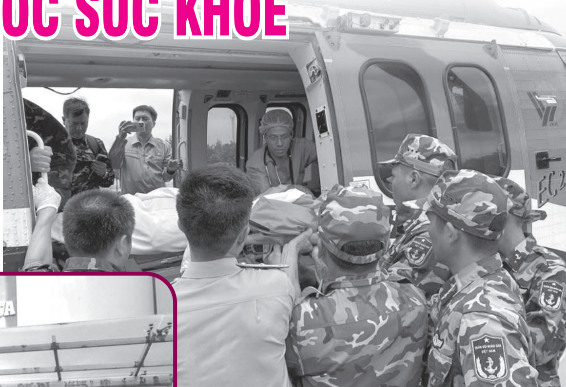
● Vận chuyển ngư dân từ đảo Trường Sa lên máy bay chuyên về Bệnh viện Quân y 175 cấp cứu.

Giữa trùng khơi sóng, những bệnh xá, trung tâm y tế (TTYT) trên các đảo thuộc quần đảo Trường Sa đóng vai trò quan trọng trong chăm sóc sức khỏe cho quân và dân ở đảo, cũng như ngư dân. Sự hiện diện của những bác sĩ quân y nơi đảo xa trở thành một điểm tựa vững chắc về sức khỏe cho ngư dân khi vươn khơi bám biển khai thác hải sản.