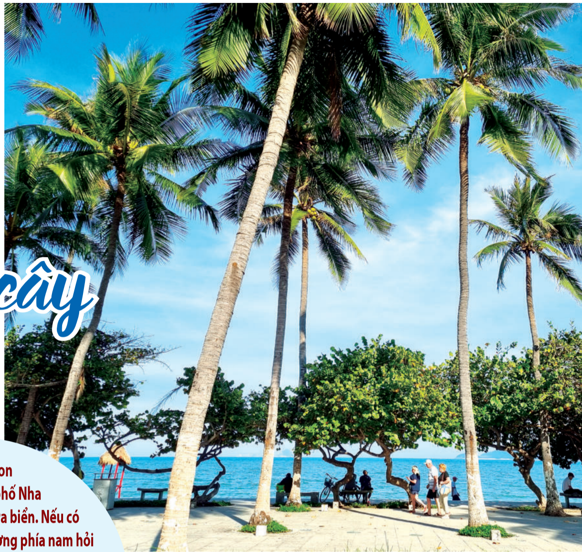
● Những cây dừa và cây tra bên bờ biển.

Xếp hàng bên trong hàng dương là những hàng dừa. Không ai nhớ dừa đã được trồng hồi nào, khi tôi mới lớn những hàng dừa còn thấp với những cành lá xòe ra vừa đủ nhìn như những cây dù với bóng mát nhỏ che nắng chiếu cho vài người ngồi tâm sự. Những hàng dừa ấy cũng tự nhiên như sóng như gió, không nhiều người để ý nên khi nhìn lại thì những hàng dừa trên bờ biển Nha Trang đã rất cao. Rễ dừa ăn rất sâu trong cát nên thân dừa hứng được gió, không ngã mà chỉ lượn mình theo sức gió. Nếu để ý khách sẽ thấy những cây dừa đứng gần nhau có thân thẳng mạnh mẽ và kiên cường, nhưng những cây dừa đứng một mình thì thân uốn lượn rất mềm mại. Bây