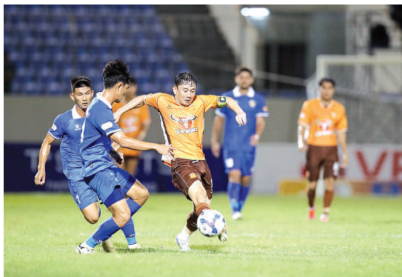
Trận đấu giữa Hoàng Anh Gia Lai gặp Quảng Nam ở vòng 1.

Công nghệ VAR được áp dụng nhiều hơn, tăng số lượng cầu thủ Việt kiều ở các đội bóng là những điểm mới đáng chú ý ở Giải bóng đá vô địch quốc gia LPBank V.League 1 - 2024 - 2025. Từ những thay đổi này, ngay ở vòng đấu đầu tiên, các đội bóng V.League 1 đã mang đến cho người xem những diễn biến đầy bất ngờ, hứa hẹn một mùa giải hấp dẫn.