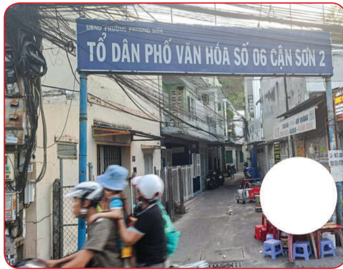
● Xóm Quéo nay là một tổ dân phố của khu phố Cận Sơn.

Nghề lưới đăng chỉ làm được ở những chân đảo có nhiều ghềnh, dựa vô chân đảo để đăng lưới đón cá vô. Hồi đó thường lấy tên các đảo làm tên sở đắc. Đầm đăng là vùng biển quanh chân đảo. Muốn đăng lưới ở sở đắc (đảo) nào phải đầu thầu. Thầu được đầm đảo nào sẽ được toàn quyền đăng lưới ở đầm đó trong 3 năm. Hết 3 năm thầu lại. Chủ một sở đắc