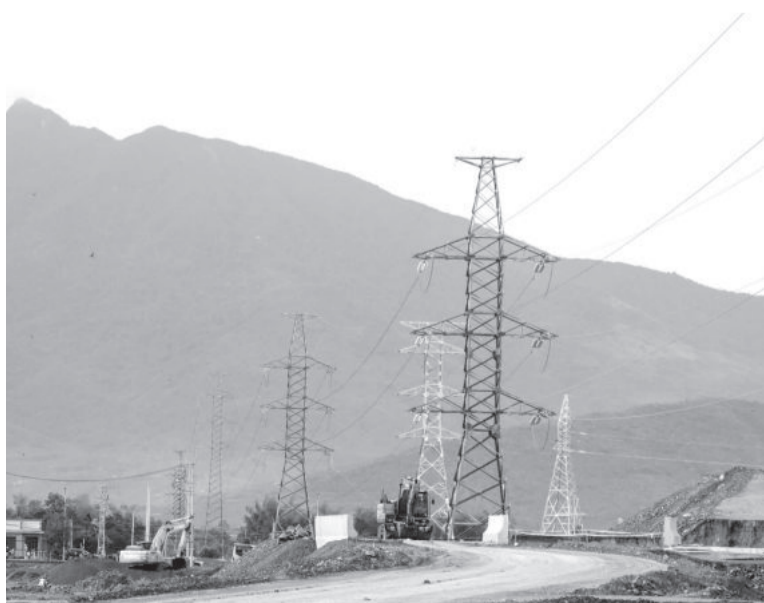
● Hạ tầng kỹ thuật tại công trình đường bộ cao tốc Vân Phong - Nha Trang chưa được di dời.

Dự án Đường bộ cao tốc Khánh Hòa - Buôn Ma Thuột đoạn qua địa bàn tỉnh dài 31,5km, tổng mức đầu tư khoảng 5.632 tỷ đồng. Dự án được khởi công vào tháng 6-2023, dự kiến hoàn thành vào tháng 12-2026. Hiện chủ đầu tư và các nhà thầu đang phấn đấu để đưa công trình về đích trước 6 tháng so với kế hoạch.