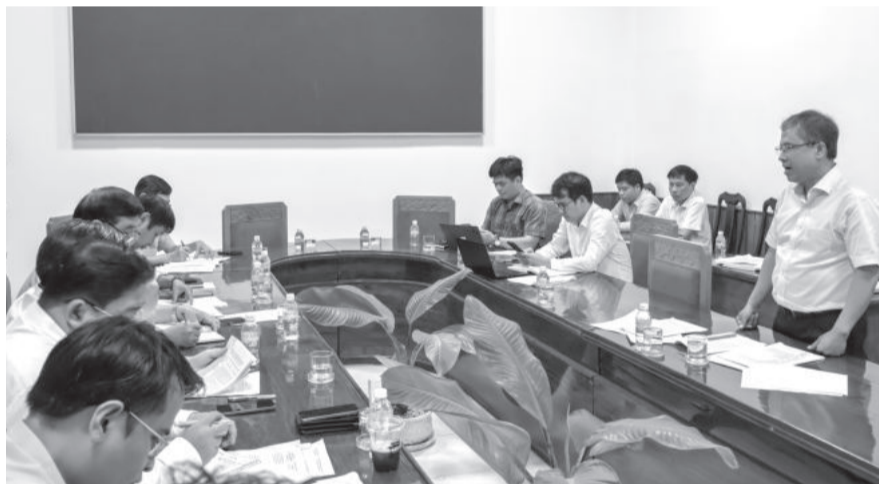
● Quang cảnh cuộc họp.