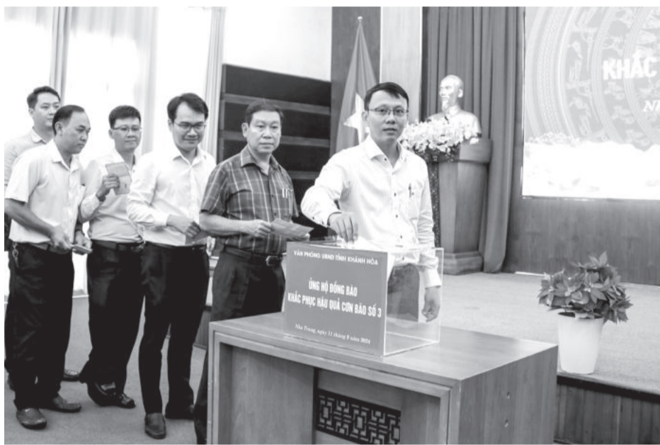
● Cán bộ, công chức, viên chức và người lao động của Văn phòng UBND tỉnh ủng hộ đồng bào khắc phục hậu quả cơn bão số 3.

Chiều 11-9, Văn phòng UBND tỉnh tổ chức phát động, ủng hộ đồng bào các tỉnh, thành miền Bắc khắc phục hậu quả cơn bão số 3. Tham dự lễ phát động có các đồng chí: Nguyễn Tấn Tuân - Phó Bí thư Tỉnh ủy, Chủ tịch UBND tỉnh; Trần Hòa Nam - Phó Chủ tịch UBND tỉnh; cán bộ, công chức, viên chức và người lao động của Văn phòng UBND tỉnh.