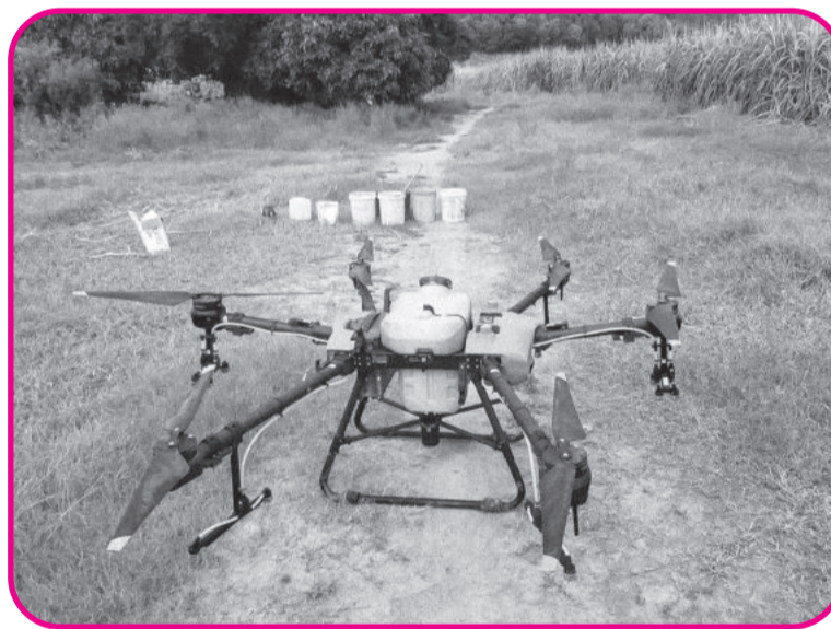
● Một chiếc drone chăm sóc mía.