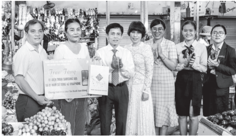
● Trao thưởng cho tiểu thương chợ Xóm Mới.

Ngày 11-9, tại các chợ: Xóm Mới, Vĩnh Hải, Phương Sơn và chợ Đầm (TP. Nha Trang), Ngân hàng Nhà nước Chi nhánh Khánh Hòa phối hợp với ban quản lý các chợ, VNPT Khánh Hòa trao giải thưởng cho các tiểu thương có số giao dịch lớn trong tuần lễ đầu tiên thí điểm