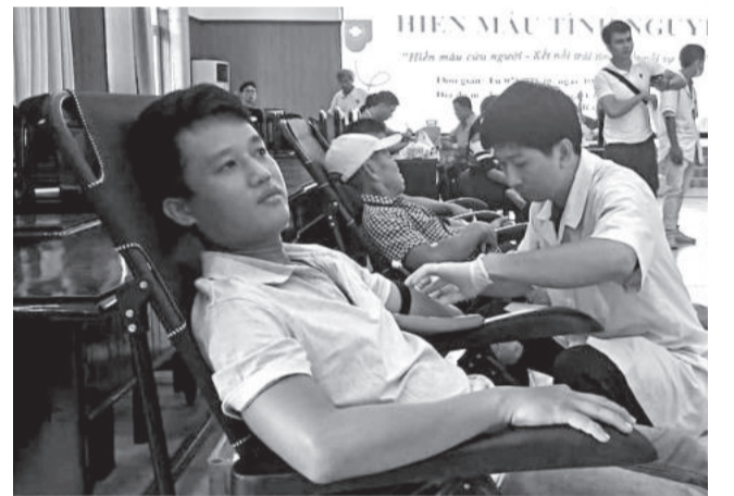
● Tình nguyện viên tham gia hiến máu tình nguyện.

Ban Chỉ đạo vận động hiến máu tình nguyện tỉnh vừa phối hợp với Hội Chữ thập đỏ TP. Cam Ranh và Trung tâm Huyết học - Truyền máu tỉnh tổ chức ngày hội hiến máu tình nguyện với chủ đề “Hiến máu cứu người - Kết nối trái tim - Kết nối sự sống”. Ngày hội thu hút hơn 170 cán bộ, công nhân, viên chức, hội viên các đoàn thể của TP. Cam Ranh tham gia, thu về hơn 150 đơn vị máu hiến. (C.Đan)