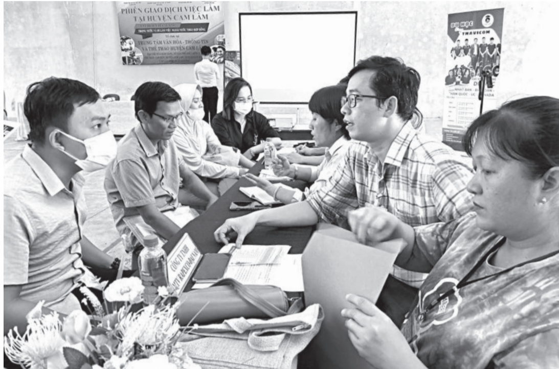
● Kết nối việc làm cho lao động huyện Cam Lâm thông qua phiên giao dịch việc làm trực tiếp.

Những năm qua, các cấp, ngành, địa phương trong tỉnh đã nỗ lực triển khai đồng bộ các giải pháp tạo việc làm tăng thêm và kéo giảm tỷ lệ lao động thất nghiệp trong độ tuổi ở khu vực thành thị. Nhờ đó, đến nay toàn tỉnh đã gặt hái được những kết quả thiết thực, có khả năng đạt và vượt chỉ tiêu Nghị quyết Đại hội Đảng bộ tỉnh lần thứ XVIII, nhiệm kỳ 2020 - 2025 đề ra.