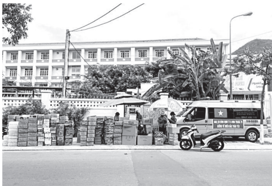
● Điểm tập kết hàng hóa hỗ trợ người dân gặp khó khăn tại các vùng bão, lũ miền Bắc của gia đình chị Thu Huyền.