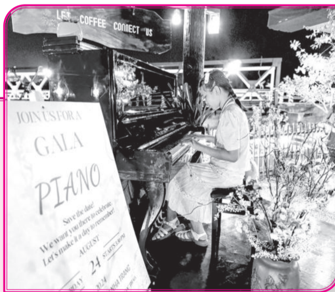
● Học sinh tự kỷ tham gia gala piano tổ chức tại Nha Trang tháng 8-2024.

Hiện nay, có 179 người khuyết tật đủ điều kiện được chăm sóc, nuôi dưỡng tại cơ sở trợ giúp xã hội của tỉnh, bằng gần 1% so với tổng số người khuyết tật và tổng số người khuyết tật từ 16 tuổi trở lên trên toàn tỉnh. Không chỉ cha mẹ có con học tại trung tâm, cả phụ huynh có con khuyết tật học hòa nhập tại trường phổ thông cũng mong mỏi có những cơ sở tiếp nhận, giúp con họ