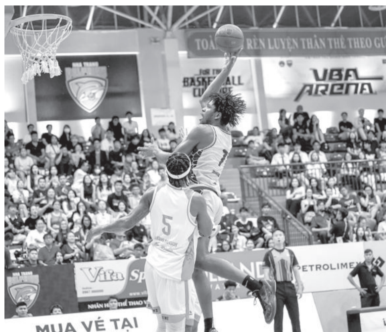
● Cầu thủ đội bóng Nha Trang Dolphins (cầm bóng) trong trận đấu gặp Đà Nẵng Dragons ngày 6-9.