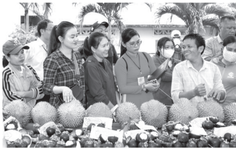
● Sầu riêng mang về doanh thu cho nông dân hơn 1.200 tỷ đồng.

Theo báo cáo của Sở Nông nghiệp và Phát triển nông thôn, từ đầu năm đến nay, diện tích, năng suất cây trồng trên địa bàn tỉnh tương đối ổn định. Cụ thể, nông dân gieo trồng hơn 54.000ha cây hàng năm. Trong đó, có tổng cộng gần 38.000ha lúa vụ đông xuân và hè thu. Hiện nông dân thu hoạch được hơn 4.000ha lúa hè thu, năng suất ước đạt 58 tạ/ha.