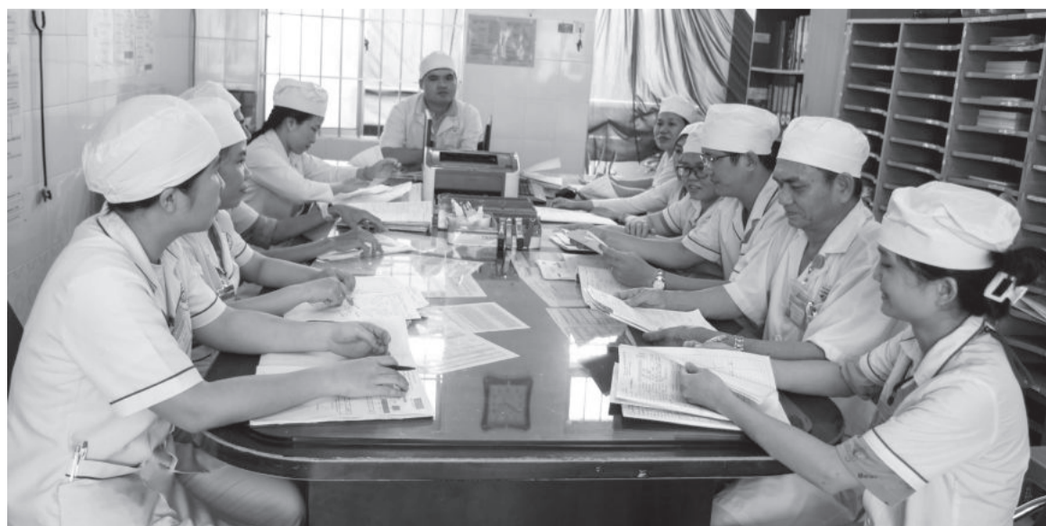
● Buổi giao ban tại Khoa Nội, Bệnh viện Đa khoa khu vực Ninh Hòa.

Cùng với các chính sách đã có, các bệnh viện, trung tâm y tế cũng cần chủ động hơn trong việc liên hệ với các trường đại học y được để có kế hoạch tuyển dụng tân bác sĩ được đào tạo chính quy. Song song đó, phối hợp với các bệnh viện tuyến tỉnh, trung ương lên kế hoạch đào tạo dài hạn, ngắn hạn, tiếp nhận và phát triển các kỹ thuật cao, chuyên sâu. Đồng thời, vận dụng các chính sách chung và riêng tại cơ sở để “giữ chân” các bác sĩ đã nghỉ hưu có trình độ chuyên môn cao, giàu kinh nghiệm ở lại làm việc, giúp phát triển những kỹ thuật và đào tạo, chuyển giao kỹ thuật cho lớp bác sĩ kế cận... Có như thế, mới không xảy ra tình trạng thiếu hụt nguồn bác sĩ; còn có thể đào tạo nguồn bác sĩ có chuyên môn sâu, đáp ứng nhu cầu khám, chữa bệnh ngày càng cao của người dân trong tỉnh nói riêng và khu vực lân cận nói chung.