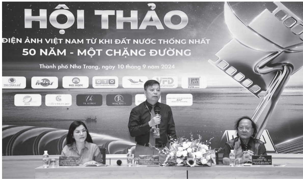
● Lãnh đạo Cục Điện ảnh (Bộ Văn hóa - Thể thao và Du lịch) và Hội Điện ảnh Việt Nam chủ trì hội thảo.

Trong khuôn khổ của Giải thưởng Cánh diều năm 2024, sáng 10-9, tại TP. Nha Trang, Hội Điện ảnh Việt Nam tổ chức hội thảo “Điện ảnh Việt Nam từ khi đất nước thống nhất: 50 năm - một chặng đường”. Hội thảo nhằm tìm ra những giải pháp cho điện ảnh Việt Nam có bước phát triển đột phá gắn với nhiệm vụ phát triển kinh tế, văn hóa, xã hội trong kỷ nguyên công nghiệp hóa.