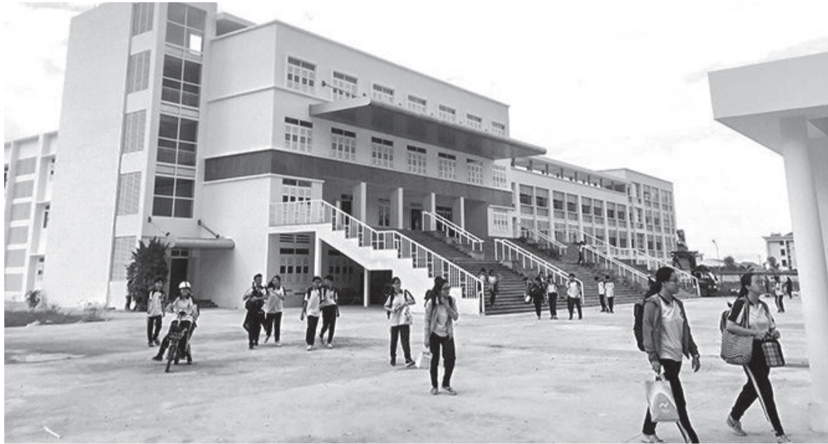
● Học sinh Trường THPT Chuyên Lê Quý Đôn.

Đơn vị thi công giai đoạn 2 Trường THPT Chuyên Lê Quý Đôn (TP. Nha Trang) vừa chính thức khởi công các công trình gồm: Nhà đa năng, thư viện, nhà chờ xe buýt cho học sinh (HS)... Dự kiến, các công trình sẽ hoàn thành và đưa vào sử dụng từ năm học 2025 - 2026.