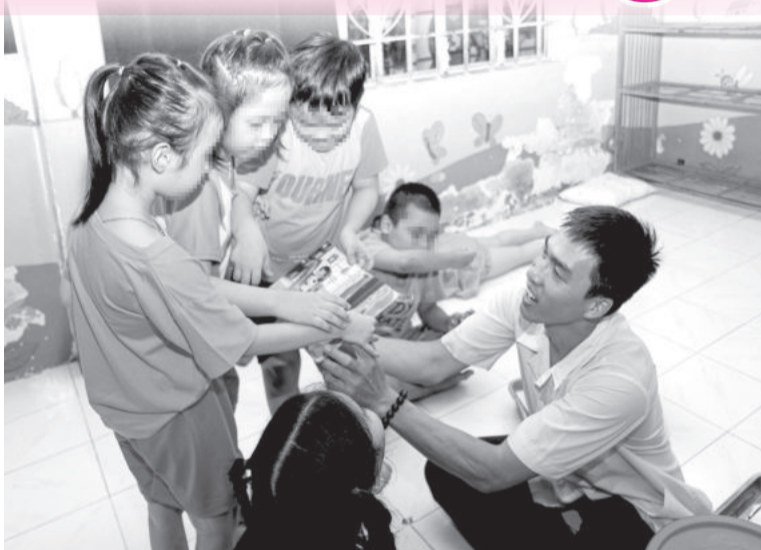
● Một giờ dạy tại Trung tâm Phục hồi chức năng - Giáo dục trẻ em khuyết tật tỉnh.

Rối loạn phổ tự kỷ đã lấy đi của con bà khả năng khái quát hóa để học hỏi các quy tắc xã hội: Con không giao tiếp mắt; khó diễn đạt thành câu; khó hiểu các khái niệm, luật chơi, các quy tắc xã hội tối thiểu; hành động máy móc; thiếu khả năng tự vệ... Bà đã trải qua những tháng ngày hoang mang tột độ với câu hỏi: "Mai sau mình không còn, con sẽ ra sao?". Những lúc đó, bà chỉ ước con được làm người bình thường, ước có các cơ sở can thiệp, hỗ trợ kỹ năng cho trẻ