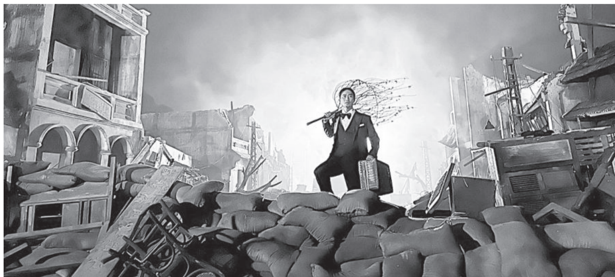
● Một cảnh trong phim Đào, phở và piano của đạo diễn Phi Tiến Sơn - bộ phim về đề tài chiến tranh, cách mạng được đánh giá cao trong thời gian gần đây.