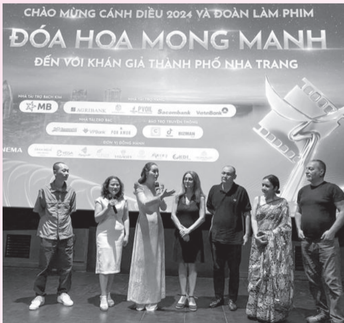
● Các thành viên đoàn làm phim Đóa hoa mong manh giao lưu với khán giả tại TP. Nha Trang.