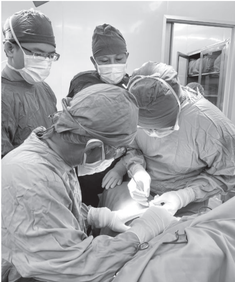
● Ê-kíp bác sĩ Bệnh viện Đa khoa tỉnh kết hợp với chuyên gia TP. Hồ Chí Minh thực hiện ca phẫu thuật điều trị dị tật bẩm sinh.