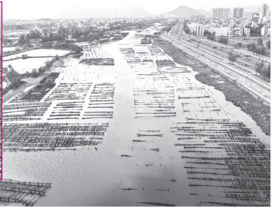
● Sông Quán Trường đầy lồng bè, cọc gỗ ở giữa lòng sông.

trường. Từ năm 2022 đến nay, Phòng Tài nguyên và Môi trường đã kiểm tra, xử phạt vi phạm hành chính 4 cơ sở với tổng số tiền 16,2 triệu đồng về hành vi xả nước thải vượt quy chuẩn kỹ thuật ra môi trường.