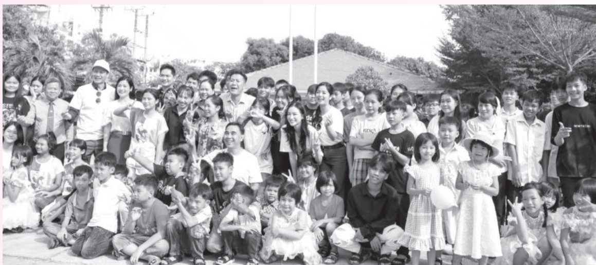
● Đoàn chụp hình cùng các em nhỏ ở Làng Trẻ em SOS Nha Trang.