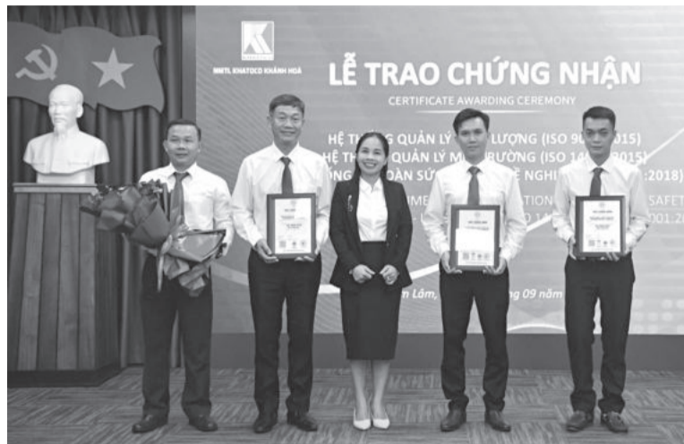
● Đại diện Nhà máy Thuốc lá Khatoco Khánh Hòa nhận các chứng nhận.

Mới đây, Nhà máy Thuốc lá Khatoco Khánh Hòa đã nhận các chứng nhận hệ thống quản lý theo tiêu chuẩn ISO gồm: Hệ thống quản lý chất lượng ISO 9001:2015; hệ thống quản lý môi trường ISO 14001:2015; hệ thống quản lý an toàn và sức khỏe nghề nghiệp ISO 45001:2018. Ngoài ra, 33 thành viên Ban ISO của Nhà máy Thuốc lá Khatoco Khánh Hòa hoàn thành chương trình đào tạo chuyên gia đánh giá nội bộ 3 hệ thống quản lý này cũng đã được trao các chứng chỉ chuyên gia đánh giá nội bộ.