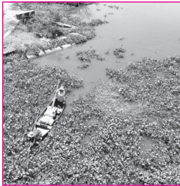
● Bèo, cây cối mọc đầy cản trở dòng chảy ở sông Tắc.

Sau loạt bài “Trả lại sự trong lành cho một dòng sông” đăng trên Báo Khánh Hòa từ ngày 20 đến 23-8, UBND TP. Nha Trang đã chỉ đạo các phòng, ban chuyên môn và địa phương tăng cường xử phạt vi phạm hành chính lĩnh vực môi trường, khẩn trương tháo dỡ bè phao nuôi trồng thủy sản trên sông Tắc, sông Quán Trường, định kỳ vào mùa khô hàng năm tổ chức thu gom rác, nạo vét khơi thông dòng chảy của sông.