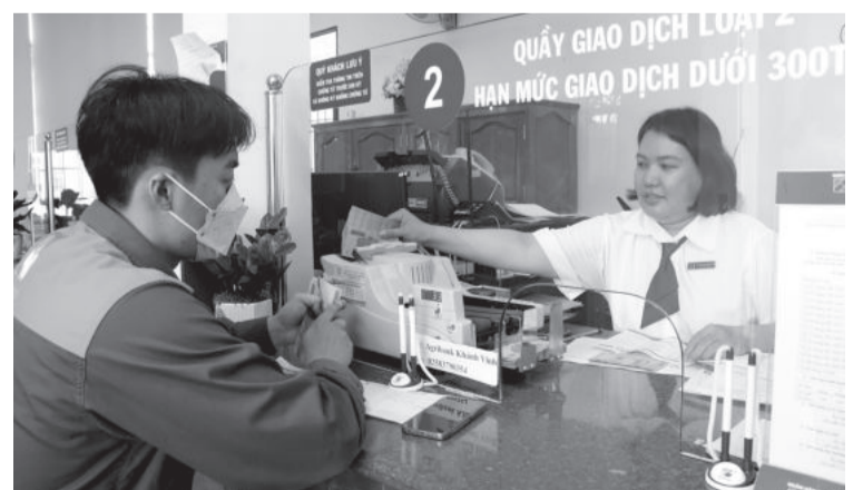
● Khách hàng giao dịch tại Ngân hàng Agribank Chi nhánh huyện Khánh Vĩnh.