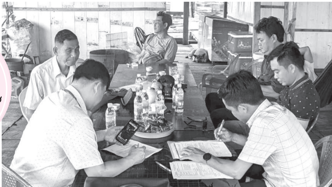
● Lực lượng chức năng liên ngành của TP. Nha Trang kiểm tra trên các lồng bè ở khu vực biển đảo Bích Đầm.

Bên cạnh những nỗ lực mang lại kết quả tích cực, Kế hoạch tổng thể phục hồi vịnh Nha Trang đến năm 2030 vẫn còn những khó khăn, vướng mắc đối với các đơn vị chủ trì thực hiện nhiệm vụ khi đang thiếu nhân lực, tài lực, phương tiện và quyền hạn. Các nhà khoa học tâm huyết với công tác phục hồi vịnh Nha Trang cho rằng, tỉnh cần có cơ chế phối hợp liên ngành rõ ràng hơn về quyền và trách nhiệm, huy động nguồn lực từ sự tham gia của người dân và doanh nghiệp, những người đang thụ hưởng và sử dụng các giá trị của vịnh Nha Trang.