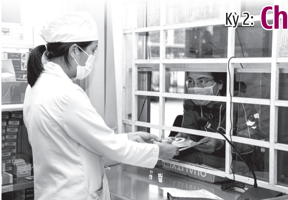
● Bệnh nhân nhận thuốc tại Cơ sở 2 thuộc Trung tâm Y tế thị xã Ninh Hòa.

(Xem tiếp Báo Khánh Hòa thứ Tư, ngày 11-9)