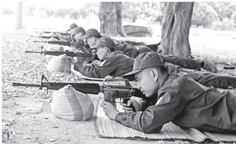
● Ban Chỉ huy Quân sự TP. Cam Ranh tổ chức huấn luyện cho lực lượng dân quân.