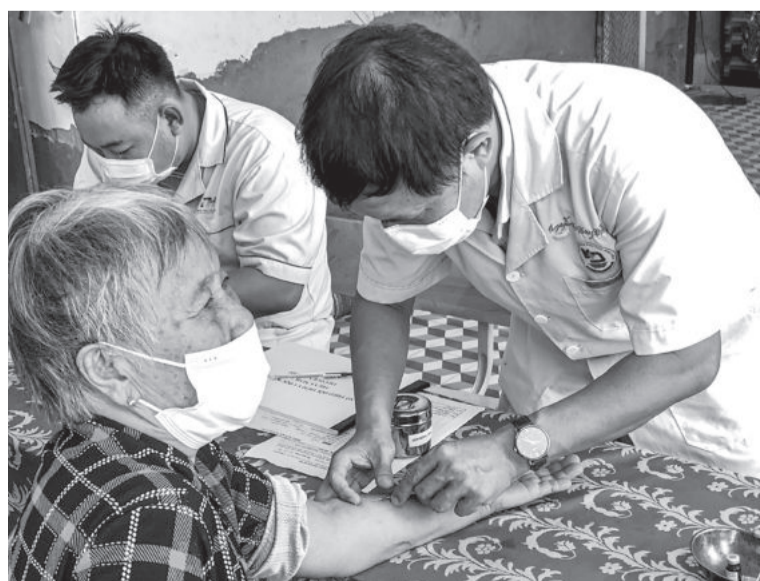
● Đội ngũ y, bác sĩ Bệnh viện Lao và Bệnh phổi tỉnh tầm soát lao tại cộng đồng.

Một bác sĩ trẻ đã nghỉ việc tại bệnh viện công ở tỉnh cho biết, với mức lương mới, 1 bác sĩ mới ra trường nhận khoảng 5 triệu đồng/tháng. Nếu có thêm khoản phụ mổ, hỗ trợ của bệnh viện, mức thu nhập cao nhất của bác sĩ mới ra trường hoặc đi làm được 2 năm khoảng từ 6 triệu đến 8 triệu đồng/tháng. "Làm tại các cơ sở y tế công lập áp lực công việc cao, thu nhập thấp, ngược lại khi làm ở các cơ sở y tế tư nhân thu nhập cao gấp 4 đến 8 lần tùy trình độ và thâm niên. Để nuôi sống được bản thân và hỗ trợ gia đình, các bác sĩ trẻ như chúng tôi đành phải bỏ việc, chuyển sang cơ sở y tế tư nhân", bác sĩ này chia sẻ.