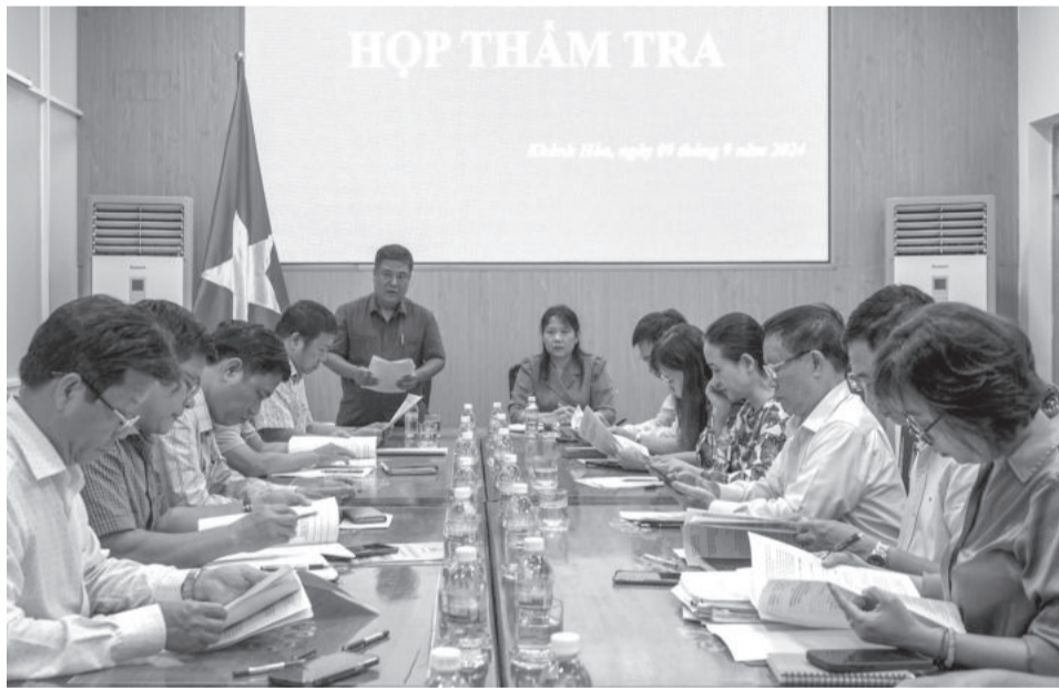
● Quang cảnh tại cuộc họp thẩm tra của Ban Văn hóa - Xã hội HĐND tỉnh.

Chiều 9-9, Ban Văn hóa - Xã hội HĐND tỉnh tiến hành thẩm tra nội dung UBND tỉnh sẽ trình tại Kỳ họp thứ 15, HĐND tỉnh khóa VII về Nghị quyết quy định chính sách hỗ trợ học phí đối với trẻ em mầm non, học sinh phổ thông, học viên giáo dục thường xuyên đang học tại các cơ sở giáo dục công lập trong năm học 2024 - 2025 trên địa bàn tỉnh.