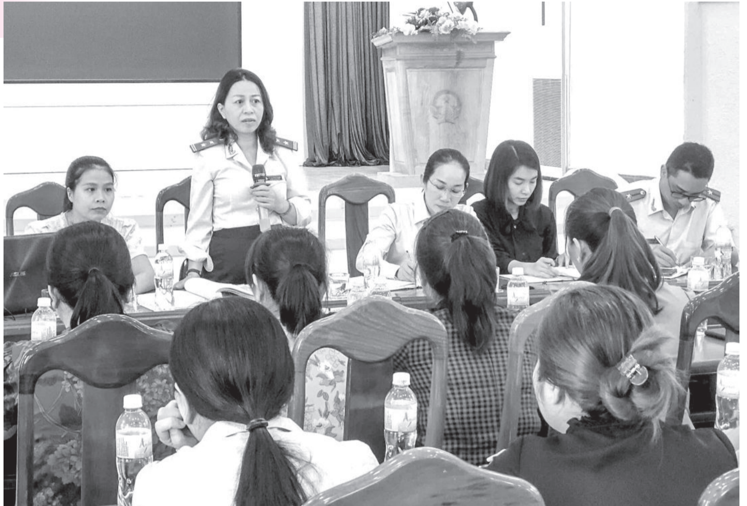
● Đoàn Thanh tra Sở Lao động - Thương binh và Xã hội thực hiện thanh tra về công tác trẻ em tại huyện Diên Khánh.