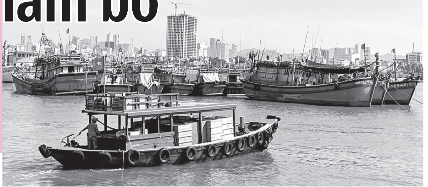
● Nhiều tàu cá đang neo đậu tại cảng Hòn Rớ.

Thời gian qua, chi phí chuyển biển tăng, trong khi sản lượng khai thác, giá bán đều giảm khiến cho hiệu quả chuyển biển thấp, nhiều chủ tàu cá rơi vào cảnh lố. Trước những khó khăn này, nhiều chủ tàu cá cho tàu nằm bờ để tránh thua lỗ.