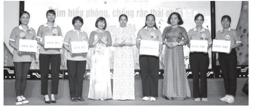
● Trao giải tập thể cho các đội đạt giải.

Chiều 9-9, Hội Liên hiệp Phụ nữ TP. Nha Trang tổ chức Hội thi Tìm hiểu về phòng, chống rác thải nhựa. Tham gia hội thi có 140 thí sinh đến từ hội phụ nữ 27 xã, phường và Hội Phụ nữ Công an thành phố.