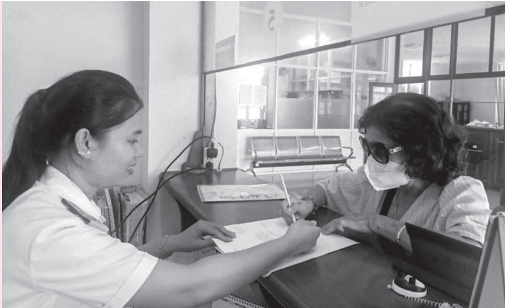
● Cán bộ Chi cục Thuế khu vực Nam Khánh Hòa tra cứu thủ tục thuế cho người dân. (Ảnh minh họa)

Trước tình hình nợ thuế trên địa bàn quản lý vẫn còn cao, Chi cục Thuế khu vực Nam Khánh Hòa đã triển khai nhiều giải pháp đồng bộ nhằm tích cực thu hồi nợ thuế vào ngân sách nhà nước. Đơn vị phấn đấu đến cuối năm 2024, thu hồi nợ thuế trên địa bàn phụ trách đạt và vượt chỉ tiêu giao, giảm nợ thuế xuống dưới 8% so với tổng thu theo chỉ đạo.