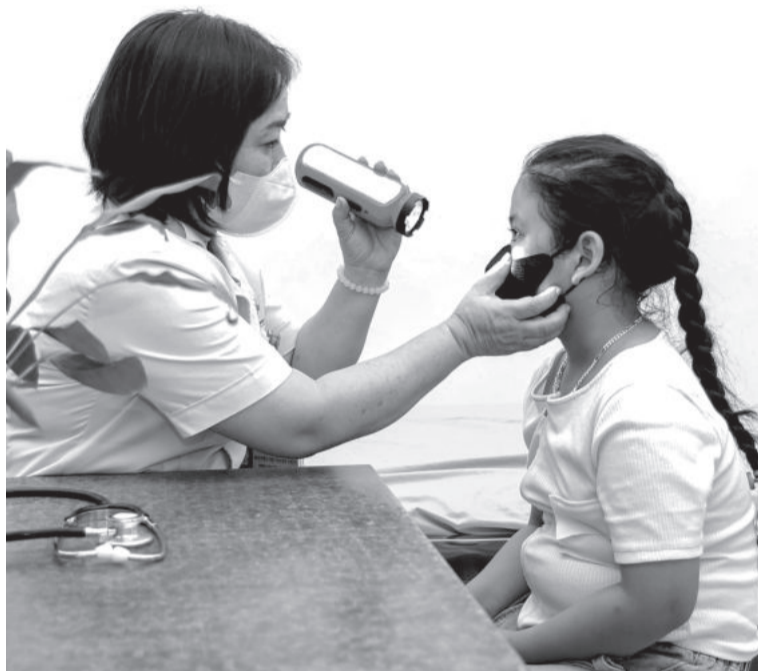
● Khám bệnh cho bệnh nhi tại Cơ sở 2 Trung tâm Y tế thị xã Ninh Hòa.

Để nâng cao chất lượng, đáp ứng nhu cầu khám, chữa bệnh của người dân, một trong những yếu tố quyết định là đội ngũ bác sĩ. Những năm gần đây, một số cơ sở y tế công lập, đặc biệt là tuyến huyện đang thiếu bác sĩ. Trong khi nhu cầu khám, chữa bệnh của người dân ngày càng cao mà biên chế lại phải tinh giản theo lộ trình, cùng với chính sách lương, phụ cấp chưa thật sự thu hút... đã gây khó cho các cơ sở y tế công lập thu hút bác sĩ về làm việc.