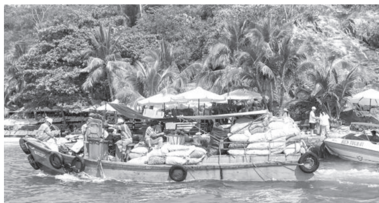
● Công nhân thu gom rác thải trên vịnh Nha Trang.

Làng chài Bích Đầm (phường Vĩnh Nguyên) là đảo xa nhất của TP. Nha Trang, mất 60 phút