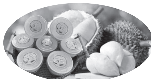
● Kem sấu riêng Thành Hưng.