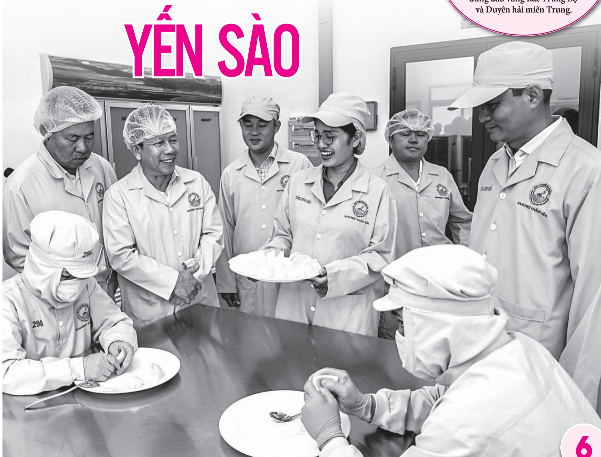
● Đoàn công tác tỉnh Đắk Lắk tham quan khu vực sơ chế tổ yến của Công ty Cổ phần Nước giải khát Yến sào Khánh Hòa.

Công nghiệp Khánh Hòa tiếp tục đứng đầu vùng Bắc Trung Bộ và Duyên hải miền Trung.