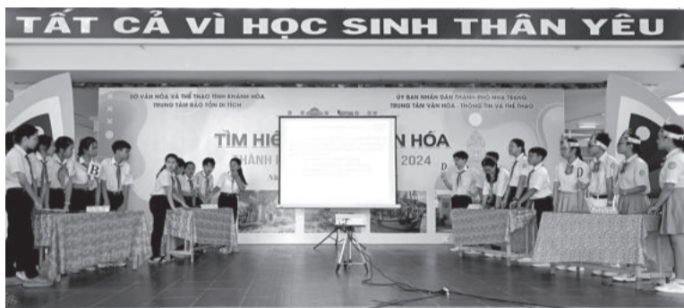
● 4 đội tham gia phần thi tìm hiểu di sản thế giới tại Việt Nam, di tích - danh thắng quốc gia tại Khánh Hòa, Luật Di sản văn hóa, di tích cấp tỉnh - danh thắng tại địa phương.

Hội thi năm nay thu hút gần 80 thí sinh, trong đó có 20 thí sinh thi chính thức và gần 60 thí sinh trợ diễn đến từ 4 trường THCS gồm: Trần Hưng Đạo, Võ Thị Sáu, Bùi Thị Xuân và Lê Thanh Liêm. Mỗi đội lần lượt thi 4 phần: Chào hỏi; tìm hiểu di sản thế giới tại Việt Nam, di tích - danh thắng quốc gia tại Khánh Hòa, Luật Di sản văn hóa, di tích cấp tỉnh - danh thắng tại địa phương; nhận biết di tích - danh thắng qua hình ảnh; tài năng.