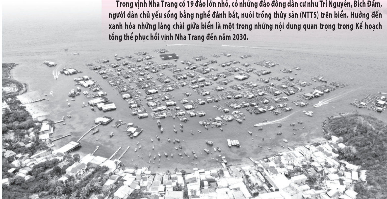
● Lồng bè nuôi trồng thủy sản khu vực đảo Trí Nguyên.