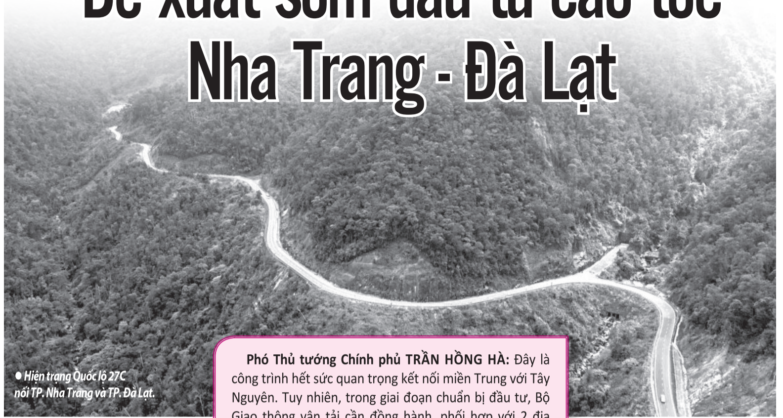
● Hiện trạng Quốc lộ 27C nối TP. Nha Trang và TP. Đà Lạt.

Phó Thủ tướng Chính phủ TRẦN HỒNG HÀ: Đây là công trình hết sức quan trọng kết nối miền Trung với Tây Nguyên. Tuy nhiên, trong giai đoạn chuẩn bị đầu tư, Bộ Giao thông vận tải cần đồng hành, phối hợp với 2 địa phương và Tập đoàn Sơn Hải nghiên cứu để xây dựng các giải pháp về kỹ thuật tối ưu nhất, tính toán kỹ lưỡng hơn nữa để giải quyết được các đoạn có chênh lệch địa hình cao, xác định các hướng tuyến và khoảng cách tuyến có tính chính xác cao hơn, hoàn thiện các thủ tục hồ sơ trình cấp có thẩm quyền phê duyệt chủ trương đầu tư.