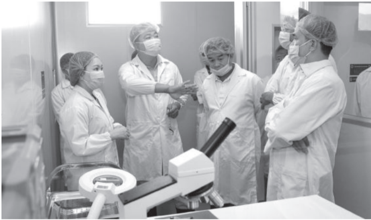
● Đoàn công tác tỉnh Đắk Lắk thăm khu vực kiểm định chất lượng tổ yến của Công ty TNHH Thương mại Hải Yến Nha Trang.

Khánh Hòa cho biết, việc Trung Quốc chấp nhận nhập khẩu yến sào Việt Nam đã mở ra cơ hội rất lớn cho yến sào Khánh Hòa và Đắk Lắk. Sản lượng yến sào Việt Nam xuất khẩu sang Trung Quốc chỉ chiếm thị phần rất nhỏ, trong khi nhu cầu của thị trường còn rất lớn. So với Indonesia, Malaysia thì yến sào Việt Nam đi sau rất nhiều trong xuất khẩu vào thị trường Trung