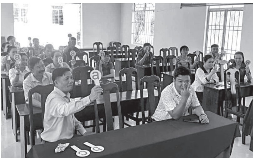
● Một buổi sinh hoạt của Câu lạc bộ tiếng Anh xã Cam An Bắc trong chương trình “Người dân Cam Lâm nói tiếng Anh”.

UBND huyện Cam Lâm vừa ban hành kế hoạch tổ chức tuyên truyền cải cách hành chính (CCHC) trong hoạt động của Chương trình Người dân Cam Lâm nói tiếng Anh.