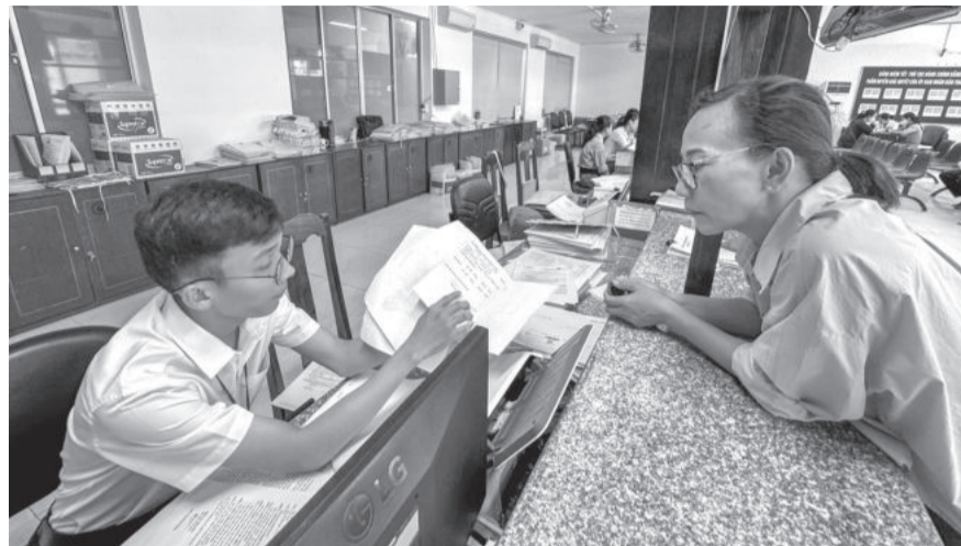
● Hướng dẫn thủ tục đăng ký kinh doanh tại bộ phận một cửa UBND TP. Nha Trang.

UBND TP. Nha Trang vừa ban hành kế hoạch triển khai thí điểm hướng dẫn người dân nộp hồ sơ trực tuyến trong lĩnh vực thành lập và hoạt động doanh nghiệp (hộ kinh doanh) tại UBND cấp xã, thực hiện từ ngày 16-9 đến hết năm 2024, từ thứ Hai đến sáng thứ Bảy hàng tuần.