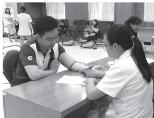
● Tình nguyện viên kiểm tra sức khỏe trước khi hiến máu.

● Ngày 7-9, tại TP. Nha Trang, Đoàn Thanh niên Ngân hàng