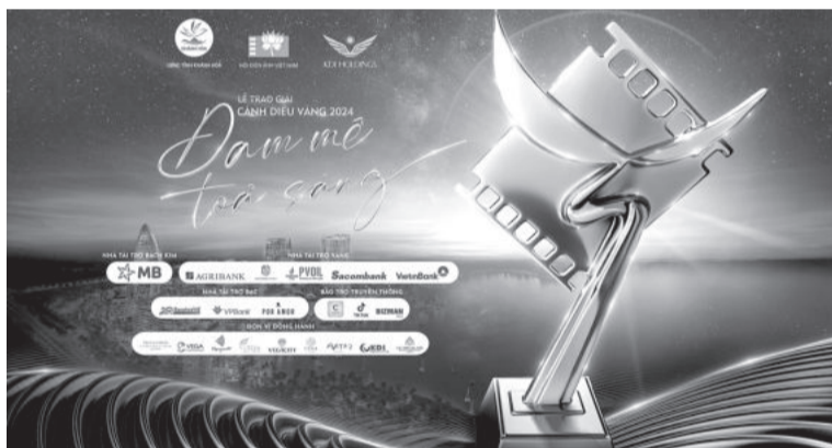
● Giải thưởng Cánh diều 2024 với nhiều điểm mới đang được chờ đợi.

Đây cũng là năm đầu tiên Ban tổ chức Giải thưởng Cánh diều