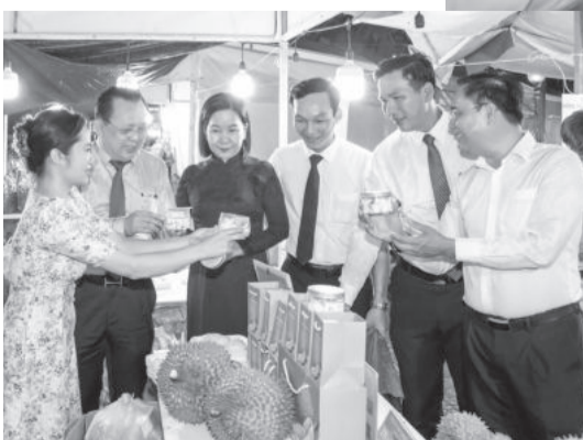
● Lãnh đạo tỉnh tìm hiểu sản phẩm sấu riêng chế biến Thành Hưng.

Công ty TNHH Nông nghiệp Thành Hưng còn là doanh nghiệp tiên phong trong việc áp dụng công nghệ sấy thăng hoa, đây là công nghệ được đánh giá hiện đại, tiên tiến nhất hiện nay, giúp cho những múi sấu riêng chín mọng giữ nguyên được giá trị dinh dưỡng, màu vàng tươi tự nhiên cùng hương vị thơm ngon, béo ngậy đặc trưng. Sấu riêng sấy thăng hoa Thành Hưng đã chinh phục thị trường nhờ ứng dụng công nghệ sấy