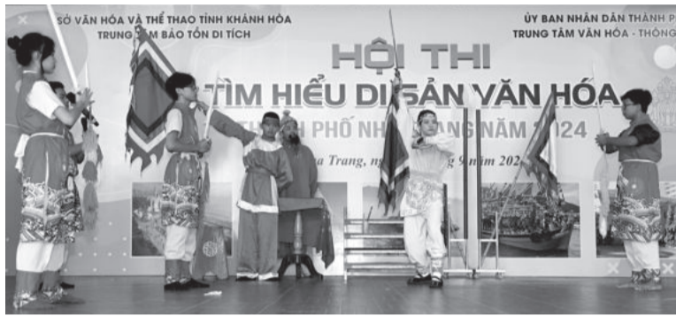
● Các thí sinh Trường THCS Võ Thị Sáu thể hiện phần thi tài năng.

Sáng 7-9, tại Trường THCS Võ Thị Sáu (TP. Nha Trang), Trung tâm Bảo tồn di tích tỉnh phối hợp với các cơ quan, đơn vị liên quan tổ chức Hội thi Tìm hiểu di sản văn hóa TP. Nha Trang năm 2024. Chỉ diễn ra trong hơn 150 phút, nhưng hội thi đã góp phần vun đắp thêm hiểu biết, trách nhiệm của mỗi học sinh đối với việc giữ gìn, phát huy giá trị di tích, di sản văn hóa của quê hương, đất nước.