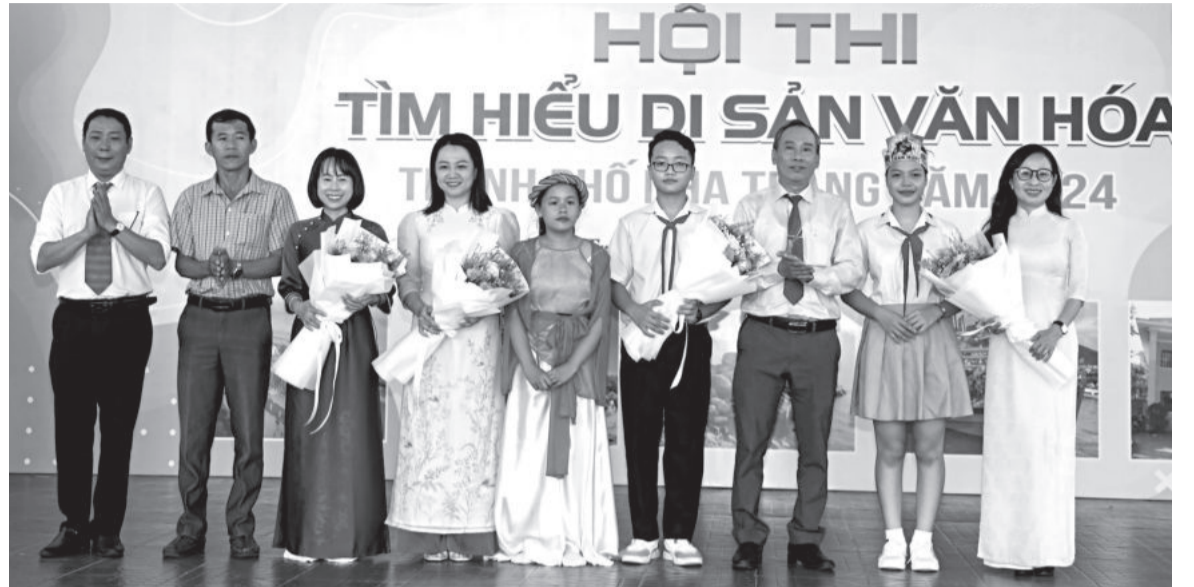
● Đại diện Ban tổ chức tặng hoa chúc mừng các đội thi.