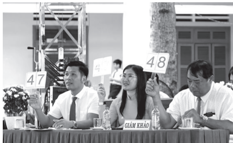
● Các thành viên Ban giám khảo cho điểm phần thi của mỗi đội.