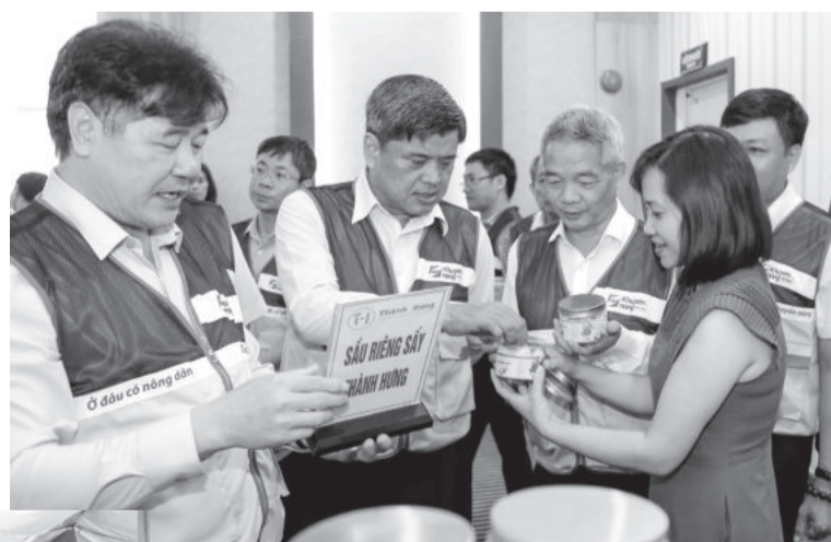
● Thứ trưởng Bộ Nông nghiệp và Phát triển nông thôn tìm hiểu sản phẩm sấu riêng sấy khô của Công ty TNHH Nông nghiệp Thành Hưng.