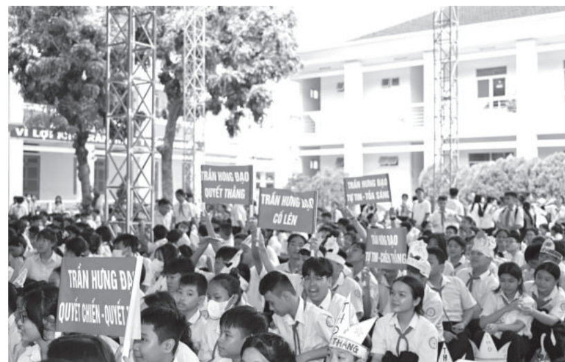
● Hàng trăm học sinh theo dõi và cổ vũ nhiệt tình cho các thí sinh tham gia hội thi.

Kết thúc hội thi, đội thi Trường THCS Võ Thị Sáu đã xuất sắc giành giải nhất; giải nhì thuộc về đội Trường THCS Bùi Thị Xuân; 2 giải ba thuộc về Trường THCS Trần Hưng Đạo và Trường THCS Lê Thanh Liêm.