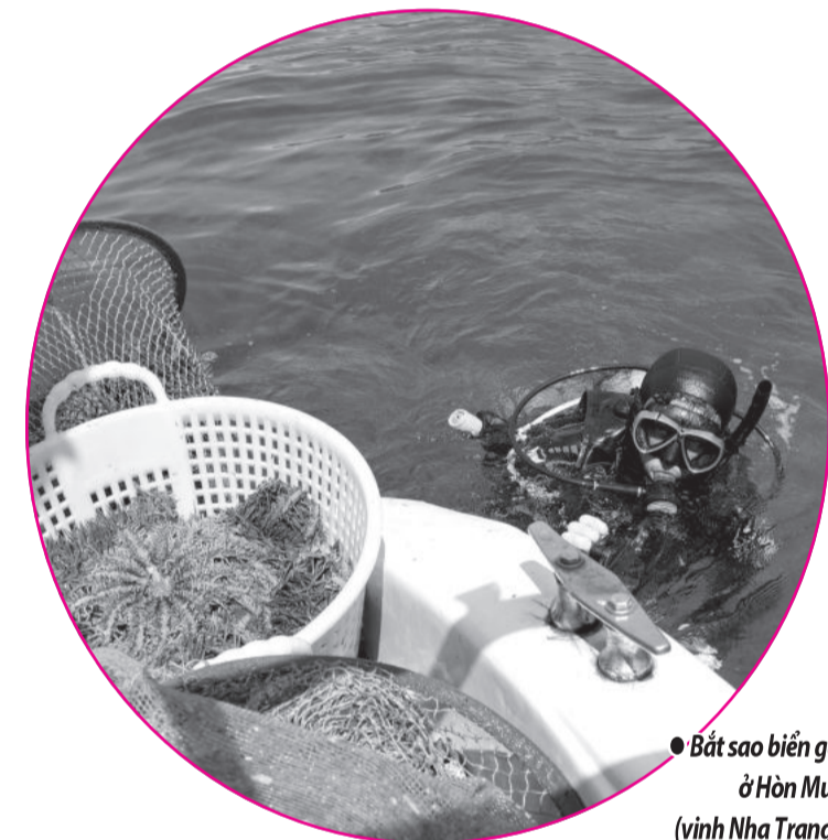
● Bắt sao biển gai ở Hòn Mun (vịnh Nha Trang).

Tại Bến tàu du lịch Nha Trang, chúng tôi cũng thấy những biện pháp BVMT đang