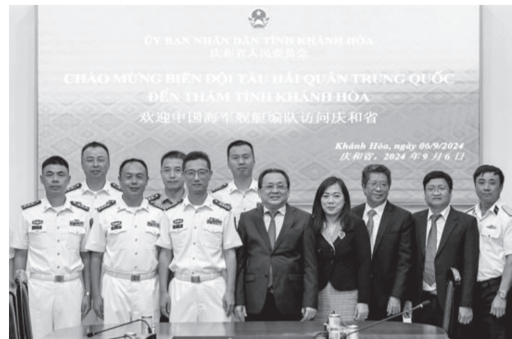
● Lãnh đạo tỉnh cùng đại diện các cơ quan chức năng chụp hình lưu niệm với đoàn công tác.