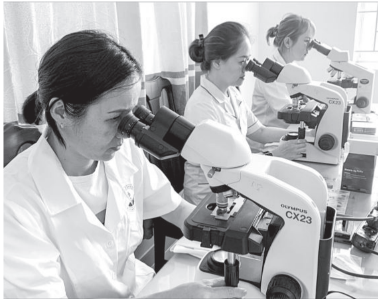
● Cán bộ y tế huyện Khánh Vĩnh soi mẫu máu tìm ký sinh trùng sốt rét.

Từ giữa năm 2023, số ca mắc bệnh sốt rét trên địa bàn tỉnh bắt đầu tăng cao, tập trung chủ yếu tại huyện Khánh Vĩnh. Trong đó, đa số các trường hợp mắc sốt rét đều liên quan đến đi rừng, rẫy, chưa tuân thủ nghiêm công tác phòng, chống.