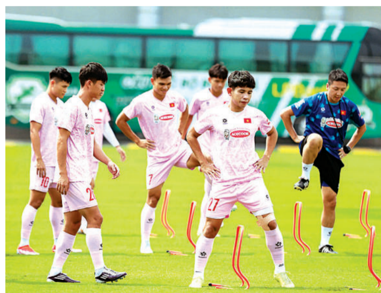
● Đội tuyển Việt Nam tập luyện chuẩn bị cho trận đấu gặp Thái Lan.

Với lực lượng mang đến giải giao hữu này, HLV Ishii Masatada không chỉ tạo cơ hội cho các cầu thủ trẻ ra sân, thử nghiệm đội hình, mà còn là dịp để chiến lược gia người Nhật thăm dò đối thủ. Với đội tuyển Việt Nam, ông Kim Sang-sik hiện không có quá nhiều sự lựa chọn sau khi kế nhiệm chiếc “ghế nóng” đội tuyển. Qua trận đấu với đội tuyển Nga, tuyển Việt Nam vẫn chưa cho thấy tín hiệu khả quan khi các vấn đề về phong