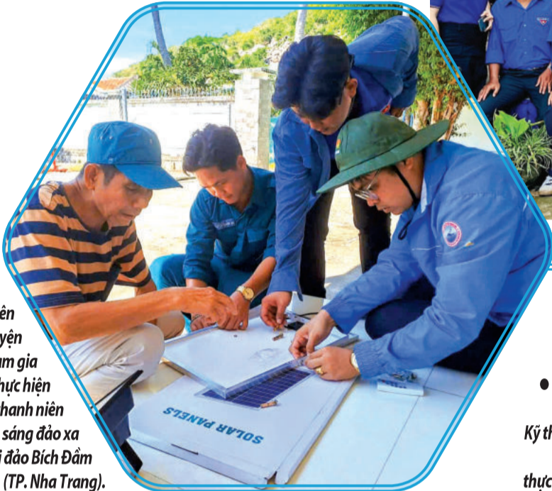
● Đoàn trường Cao đẳng Kỹ thuật Công nghệ Nha Trang thực hiện công trình Tháp sáng đường quê tại xã Sơn Tân, huyện Cam Lâm.