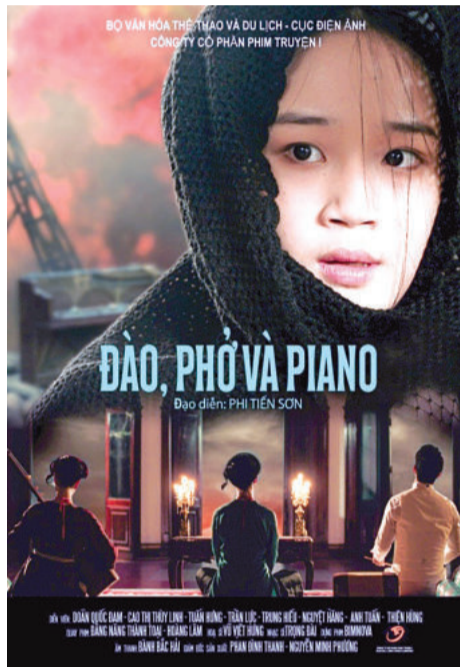
● Hình ảnh giới thiệu về phim "Đào, phở và piano" và phim "Mai" cùng tham dự giải thưởng Cánh diều 2024 ở hạng mục phim truyện điện ảnh.

G ải thưởng Cánh diều 2024 quy tụ hơn 160 tác phẩm ở các hạng mục phim truyện điện ảnh, phim truyền hình, phim ngắn, phim tài liệu, phim khoa học, công trình lý luận phê bình. Trong đó, hạng mục nhận được nhiều sự quan tâm nhất vẫn là phim truyện điện ảnh. Giải thưởng năm nay có 18 tác phẩm phim điện ảnh gửi về dự thi, gồm: Đào, phở và piano; Mai; Gặp lại chị bầu; Hồng Hà nữ sĩ; Quý cầu; Bà già đi bụi; Vầng trăng thơ ấu; Móng vuốt; FANTI; Án mạng lâu 4; Đóa hoa mong manh; Sáng đèn; LIVE - Phát trực tiếp; Sao xanh nơi biển sóng; Cái giá của hạnh phúc; Mùa hè đẹp nhất; Cu li không bao giờ khóc; Hai Muối . Từ danh sách trên, khán giả và các nhà chuyên môn có thể nhận thấy sự cạnh tranh gay gắt giữa các tác phẩm, bởi ở đó, có những phim đã tạo được tiếng vang trong thời gian qua, với doanh thu phòng vé cao như: Mai (520 tỷ đồng); Quý cầu (108 tỷ đồng); Gặp lại chị bầu (105 tỷ đồng)... Đó còn là sự tranh đua giữa "phim Nhà nước" (dùng để chỉ những bộ phim do các công ty phim Nhà nước sản xuất) như: Đào, phở và piano; Hồng Hà nữ sĩ; Vầng trăng thơ ấu; Sao xanh nơi biển sóng... với một bên là những phim do tư nhân sản xuất như: Mai, Hai Muối, Gặp lại chị