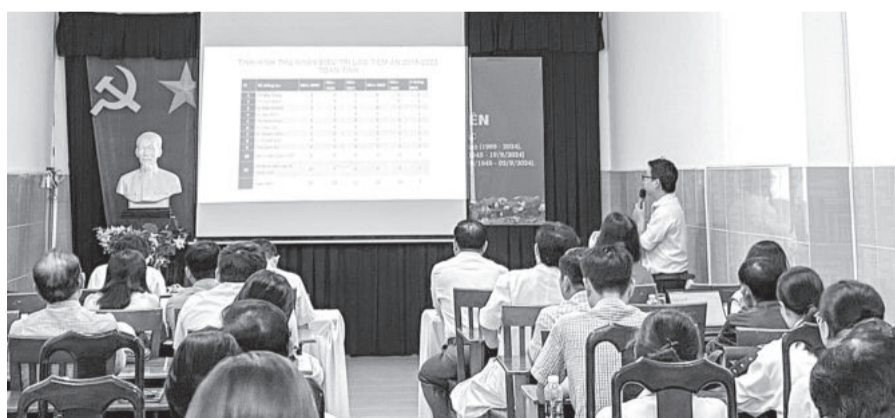
● Quang cảnh buổi sinh hoạt khoa học.

Các đại biểu được cập nhật tình hình lao trẻ em tại Việt Nam, tỉnh Khánh Hòa; các bước sàng lọc và phát hiện lao ở trẻ em tại các cơ sở y tế; những lưu ý trong chẩn đoán lao trẻ em; tình hình khám phát hiện lao trẻ em tại các đơn vị do Dự án USAID - SET tài trợ; những khó khăn, vướng mắc khi triển khai hoạt động này; các quyết định mới của Bộ Y tế về lao trẻ em... Các đại biểu cũng