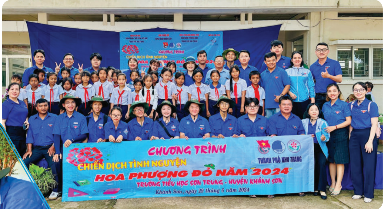
● Thành đoàn Nha Trang cùng Đoàn khối trường học tổ chức chương trình tình nguyện Hoa phượng đỏ tại huyện Khánh Sơn.

Trong 3 tháng hè (từ tháng 6 đến tháng 8), Chiến dịch Thanh niên tình nguyện hè của lực lượng thanh niên toàn tỉnh đã diễn ra sôi nổi, thiết thực. Về với vùng sâu, vùng xa, vùng khó khăn, tuổi trẻ các đơn vị, địa phương đã để lại ấn tượng tốt đẹp bằng những công trình, phần việc đảm bảo an sinh xã hội, góp phần phát triển kinh tế - xã hội.