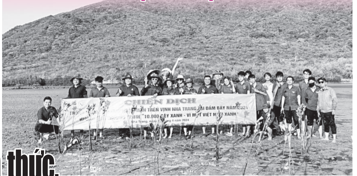
● Các bạn trẻ trồng rừng ngập mặn ven vịnh Nha Trang.