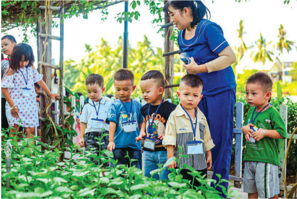
● Vườn rau xanh ở Khu du lịch Champa Island Nha Trang.