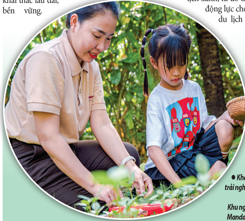
● Khách du lịch nhí trải nghiệm làm vườn với nhân viên Khu nghỉ dưỡng Ana Mandara Cam Ranh.