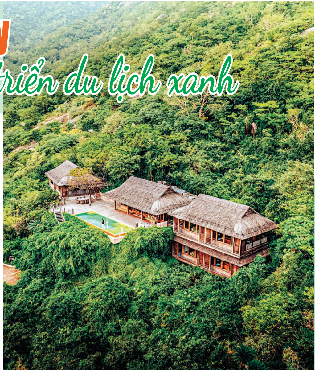
● Không gian xanh yên bình ở Six Senses Ninh Vân Bay.