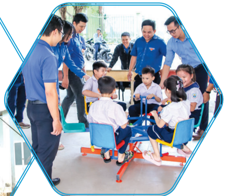
● Đoàn Khối thanh niên công nhân viên chức - lực lượng vũ trang TP. Nha Trang thực hiện khu vui chơi thiếu nhi tại Trường Tiểu học Vĩnh Trường.