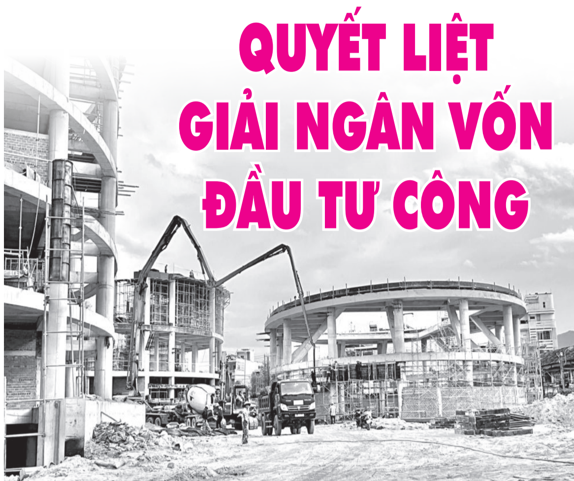
● Thi công công trình Cung Văn hóa thiếu nhi tỉnh.

Từ nay đến năm 2030, UBND tỉnh sẽ ưu tiên bố trí phù hợp các nguồn lực từ ngân sách nhà nước để dẫn dắt và thúc đẩy thu hút các nguồn lực ngoài nhà nước cho đầu tư phát triển hệ thống kết cấu hạ tầng trên địa bàn, trong đó có các dự án đầu tư theo hình thức đối tác công tư. Chính phủ cũng nghiên cứu giao cho tỉnh Khánh Hòa thẩm quyền triển khai một số dự án hạ tầng giao thông và hạ tầng khác bảo đảm chất lượng, tiến độ theo quy định. Chính vì vậy, nguồn vốn đầu tư công được giao của tỉnh năm sau luôn cao hơn năm trước. Năm 2022,