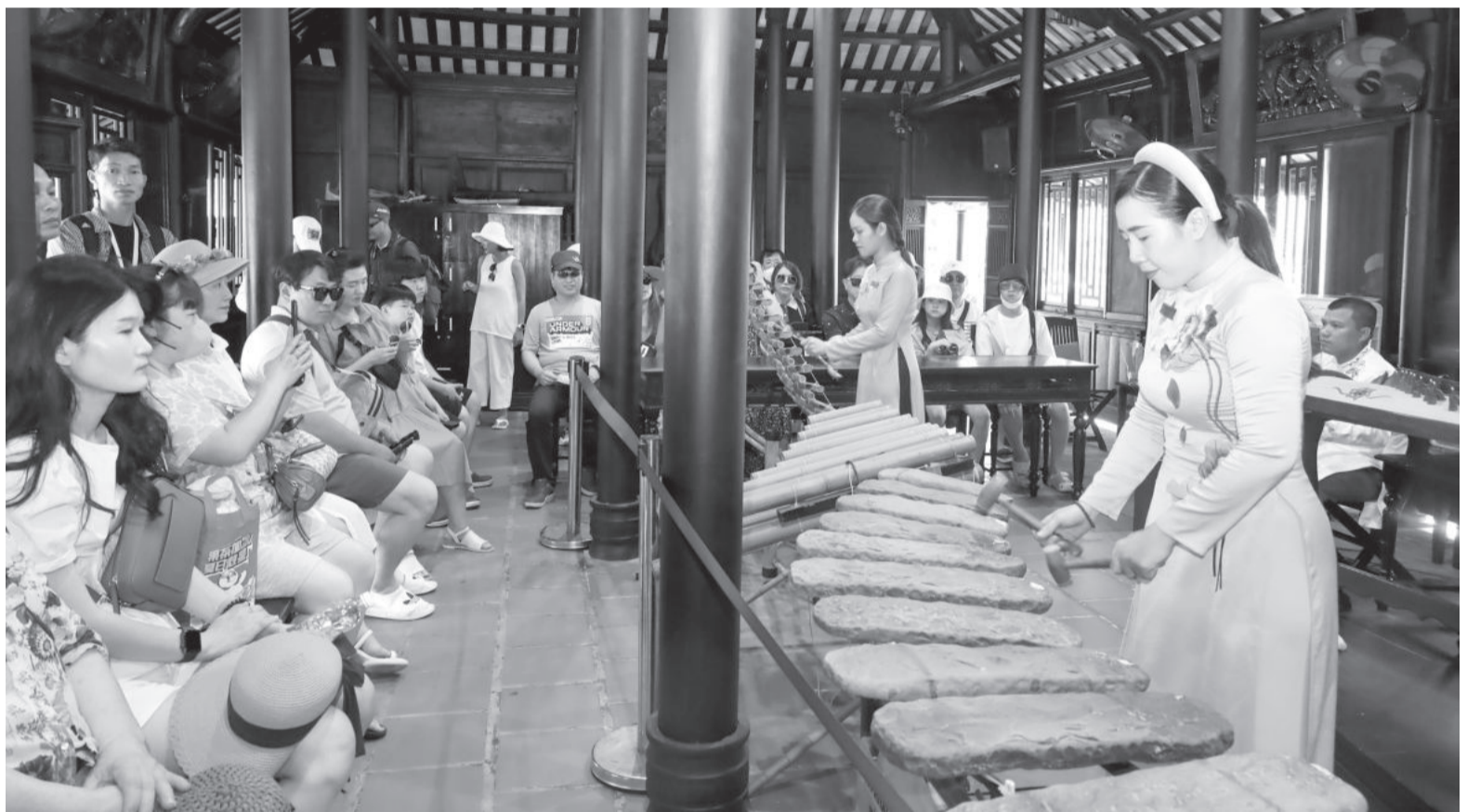
● Biểu diễn nhạc cụ dân tộc phục vụ khách du lịch tại danh thắng Hòn Chông.

ở Khánh Hòa hoạt động này diễn ra còn chậm, chưa như kỳ vọng. Ngoài di tích Tháp Bà Ponagar, danh thắng Hòn Chông, tỉnh Khánh Hòa vẫn còn thiếu những điểm du lịch văn hóa, những tour, tuyến du lịch văn hóa thực sự nổi bật để thu hút, hấp dẫn du khách tìm đến trải nghiệm".