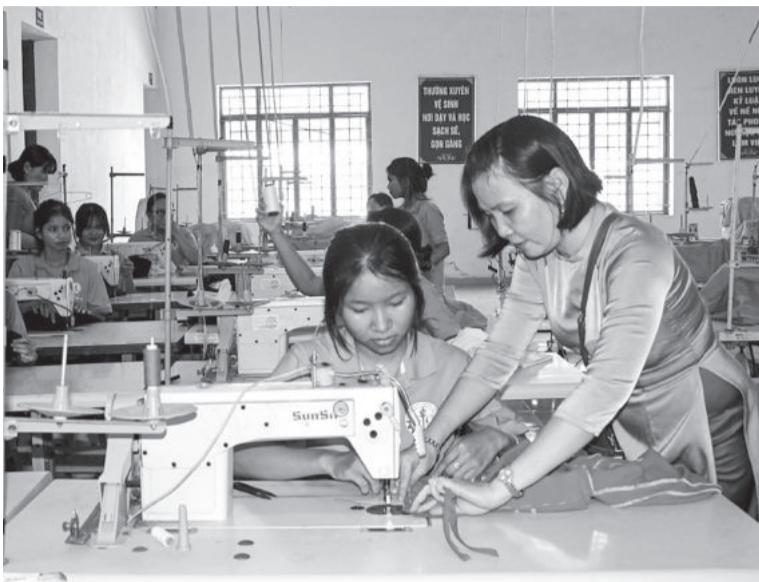
● Dạy nghề may công nghiệp cho lao động tại TP. Cam Ranh.

xuyên cho 24.625 người; 6 tháng đầu năm 2024, đào tạo cho 15.502 người. Số người sau đào tạo tìm được việc làm hoặc tự tạo việc làm đạt khoảng 80%. Qua đó, góp phần nâng tỷ lệ lao động qua đào tạo toàn tỉnh đến nay đạt 83,5%, trong đó tỷ lệ lao động qua đào tạo có bằng cấp chứng chỉ đạt 29,9%.