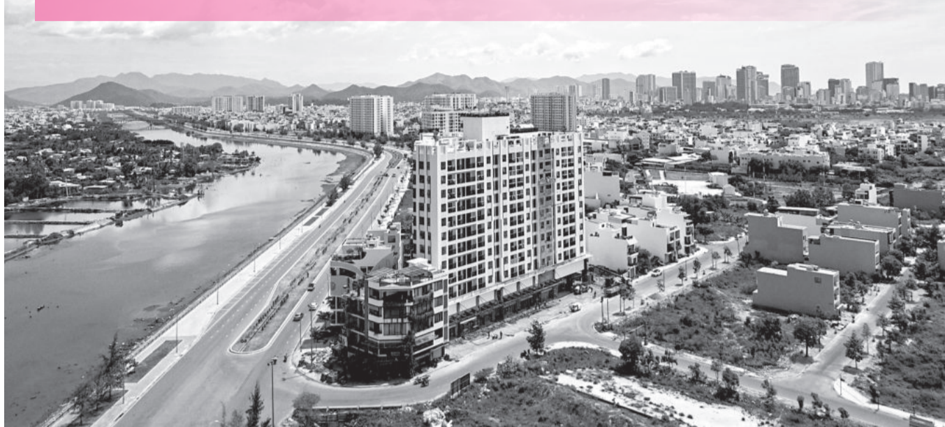
● Chung cư CT-01, Khu đô thị mới VCN - Phước Long chuẩn bị hoàn thành đưa vào khai thác.

Số lượng giao dịch bất động sản (BDS) trên thị trường những tháng gần đây mặc dù không cao nhưng tổng trị giá giao dịch lại tăng lên đáng kể. Đây là tín hiệu tích cực, báo hiệu thị trường này đang dần phục hồi.