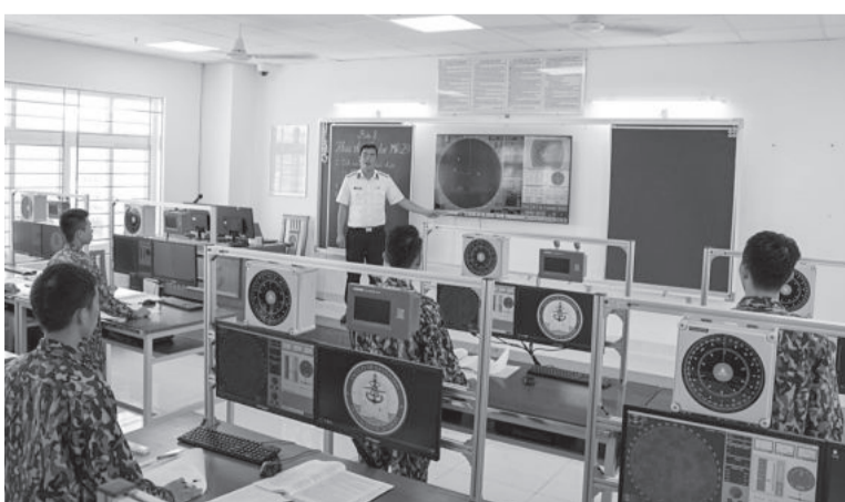
● Giờ học chuyên ngành tại phòng học chuyên dùng của Khoa Hàng hải.

Bên cạnh giờ giảng ở các khoa chuyên ngành, đội ngũ giảng viên ở các khoa khác, bằng nhiều hình thức khác nhau, như: “Điểm tin đầu giờ”, XEM TIẾP TRANG 10