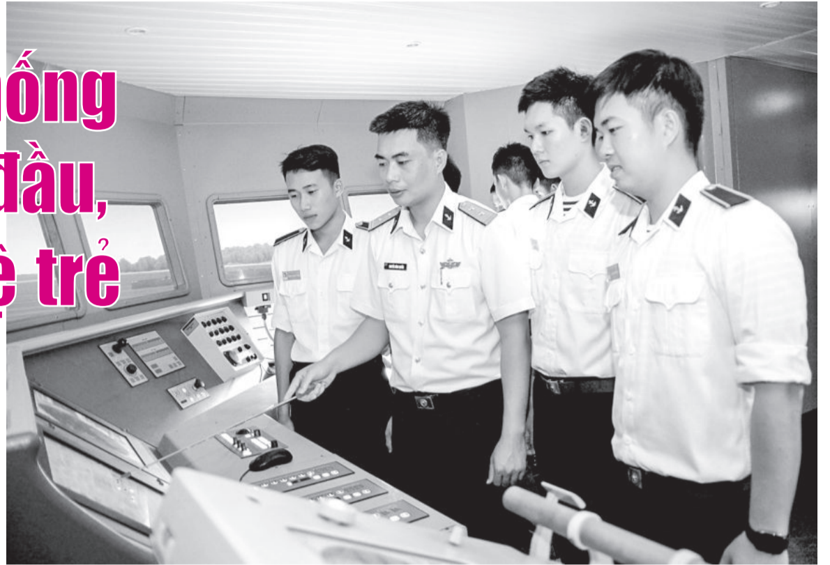
● Huấn luyện thực hành trang thiết bị hàng hải trên hệ thống mô phỏng tàu hộ vệ tên lửa Gepard 3.9.

Rời Trung tâm Mô phỏng tác chiến, chúng tôi ghé thăm giờ giảng bài tại phòng học chuyên dùng máy điều khiển vũ khí chống thủy lôi, Khoa Vũ khí