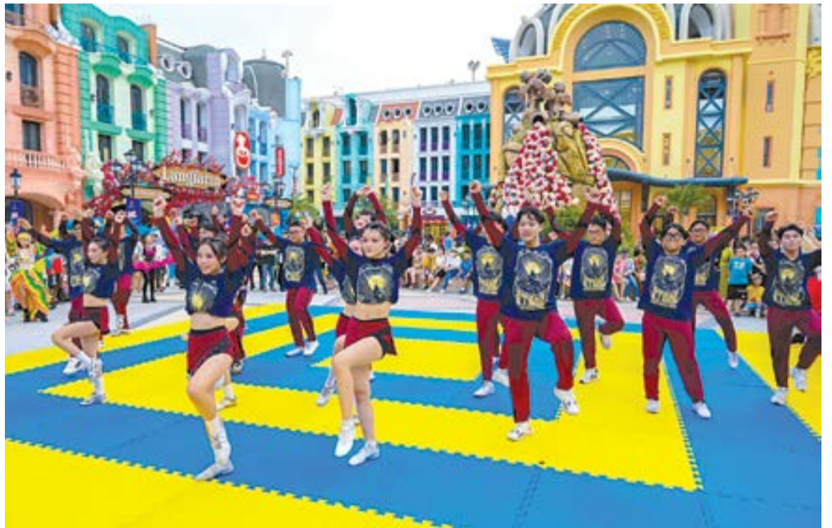
● Du khách theo dõi show diễn sôi động ở Vinpearl Harbour.

Nha Trang - Khánh Hòa là "thiên đường" của du lịch biển, đảo. Bên cạnh thể mạnh về du lịch nghỉ dưỡng, Nha Trang - Khánh Hòa đang dần trở thành