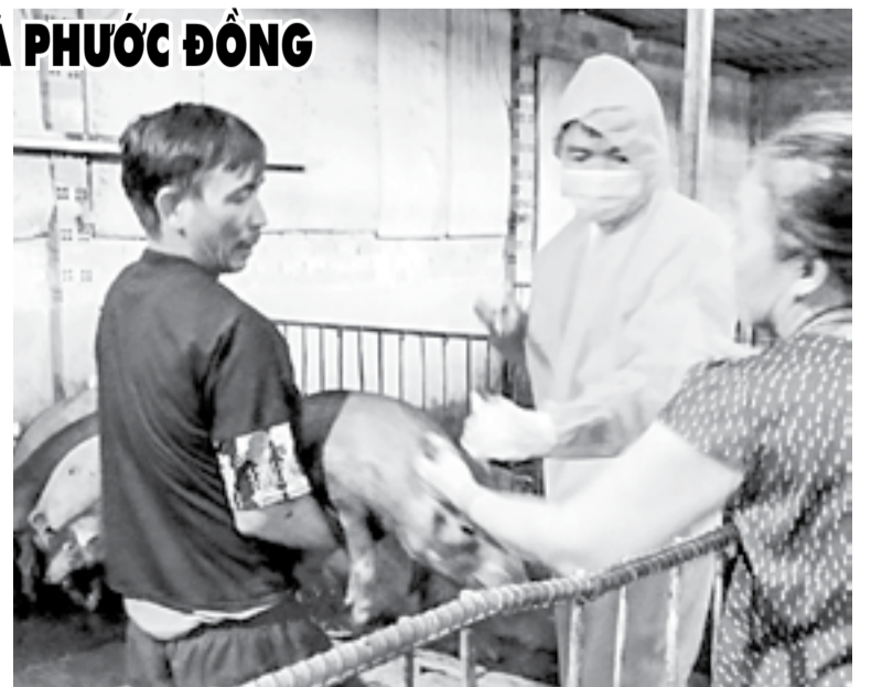
● Tiêm vắc xin phòng bệnh dịch tả heo Châu Phi cho đàn heo ở xã Phước Đồng.