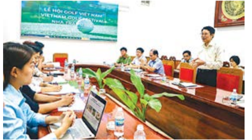
● Đồng chí Đinh Văn Thiệu phát biểu tại cuộc họp.

Sáng 26-7, đồng chí Đinh Văn Thiệu - Phó Chủ tịch UBND tỉnh chủ trì cuộc họp với các sở, ban, ngành liên quan và Báo Sài Gòn Giải Phóng về việc phối hợp tổ chức Lễ hội Golf Việt Nam - Vietnam Golf Festival Nha Trang 2024.