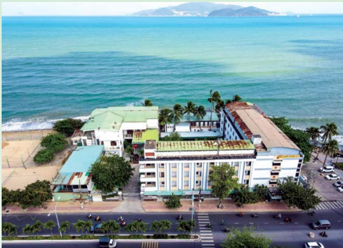
● Khu vực Nhà khách 378 là vị trí được chọn để xây dựng Bảo tàng Alexandre Yersin trong thời gian tới.

Hiện nay, trên địa bàn TP. Nha Trang có Bảo tàng Yersin nằm trong khuôn viên Viện Pasteur Nha Trang. Bảo tàng này được hình thành từ 27 năm trước, với diện tích khoảng 100m 2 , trưng bày rất nhiều hiện vật, hình ảnh có giá trị liên quan đến cuộc đời, sự nghiệp khoa học của bác sĩ A.Yersin. Tuy nhiên, do diện tích nhỏ, vị trí nằm trong khuôn viên của Viện Pasteur Nha Trang và do đơn vị này quản lý nên việc quảng bá, phát huy giá trị của bảo tàng còn gặp nhiều khó khăn. Lượng khách đến tham quan, học tập tại đây rất ít và bảo tàng chủ yếu mới chỉ làm nhiệm vụ gìn giữ các hiện vật, hình ảnh, tư liệu vốn có. Việc xây dựng Bảo tàng Alexandre