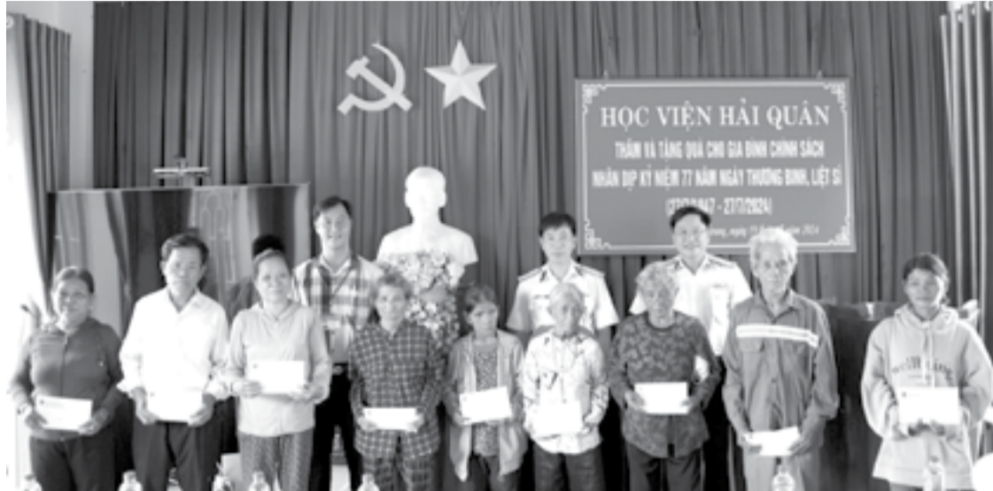
● Học viện Hải quân thăm, tặng quà gia đình chính sách xã Khánh Trung (huyện Khánh Vĩnh).

● Nhân kỷ niệm 77 năm Ngày Thương binh - Liệt sĩ (27-7-1947 - 27-7-2024), ngày 26-7, Công ty TNHH Tâm Hương phối hợp với Hội UNESCO tỉnh tổ chức đến thăm và tặng quà cho các Bà mẹ Việt Nam Anh hùng, thương bệnh binh, người có công với cách mạng trên địa bàn TP. Nha Trang.