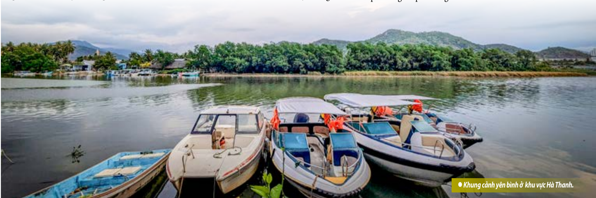
● Khung cảnh yên bình ở khu vực Hà Thanh.