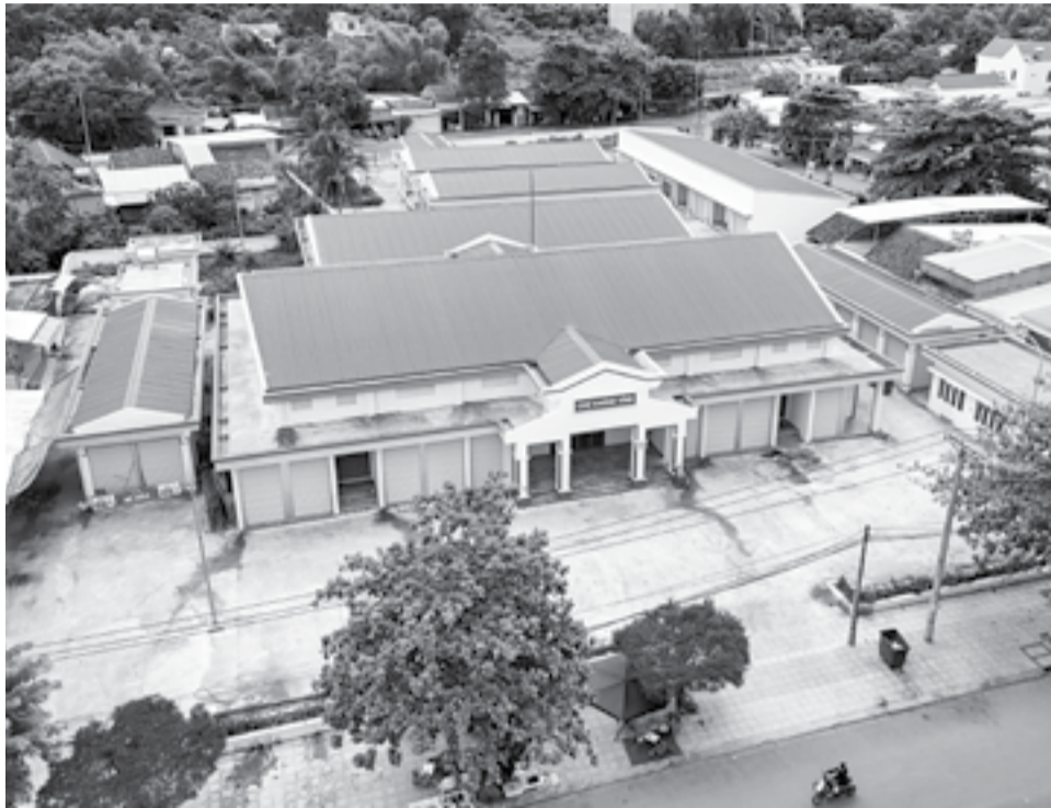
● Chợ thị trấn Khánh Vĩnh xây xong đã lâu nhưng chưa đi vào hoạt động.

Công tác xây dựng đã hoàn thành từ ngày 1-10-2023. Tuy nhiên, đến nay, chợ vẫn chưa đưa vào sử dụng được vì chưa lựa chọn được đơn vị thuê quyền khai thác tài sản kết cấu hạ tầng chợ theo quy định.