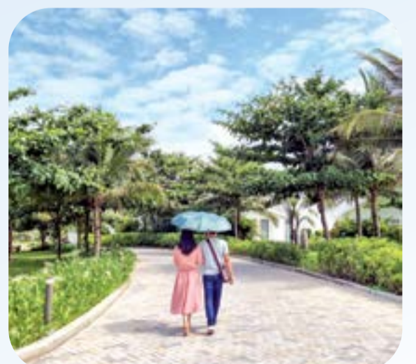
● Ảnh: T.K