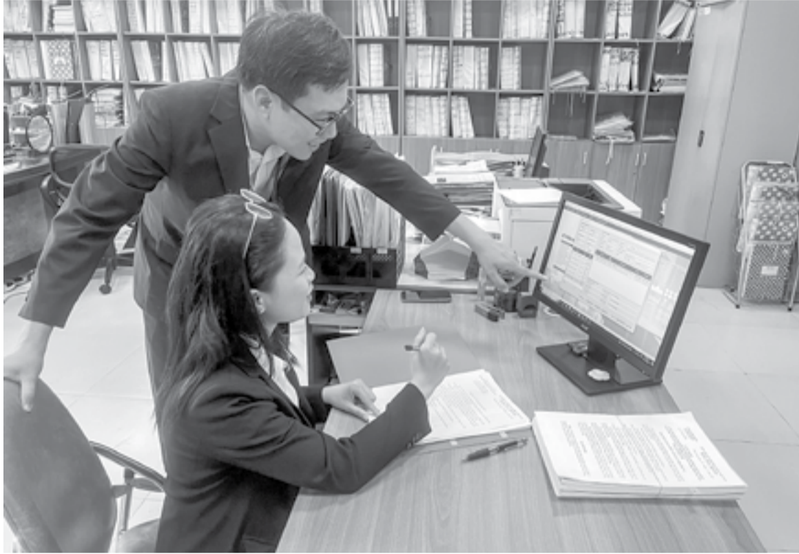
● Hoạt động nghiệp vụ của công chức Kho bạc Nhà nước Khánh Hòa.