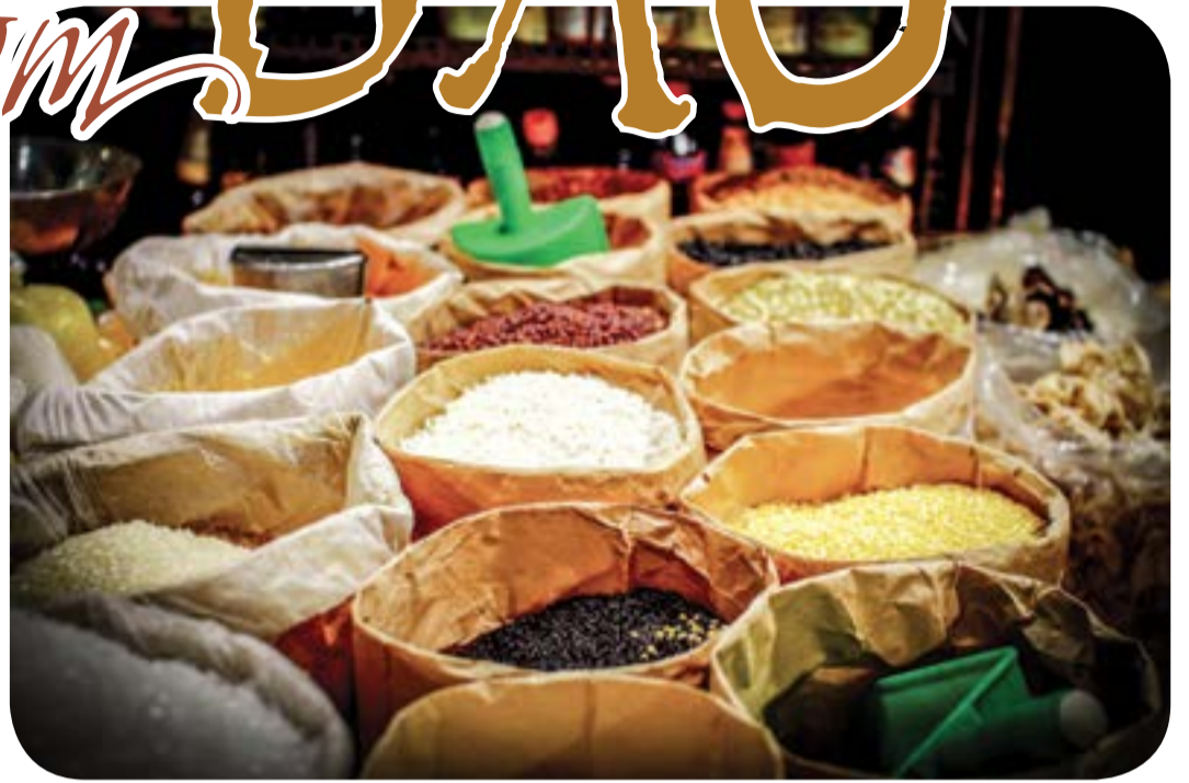
● Bao bì giấy ngày xưa.