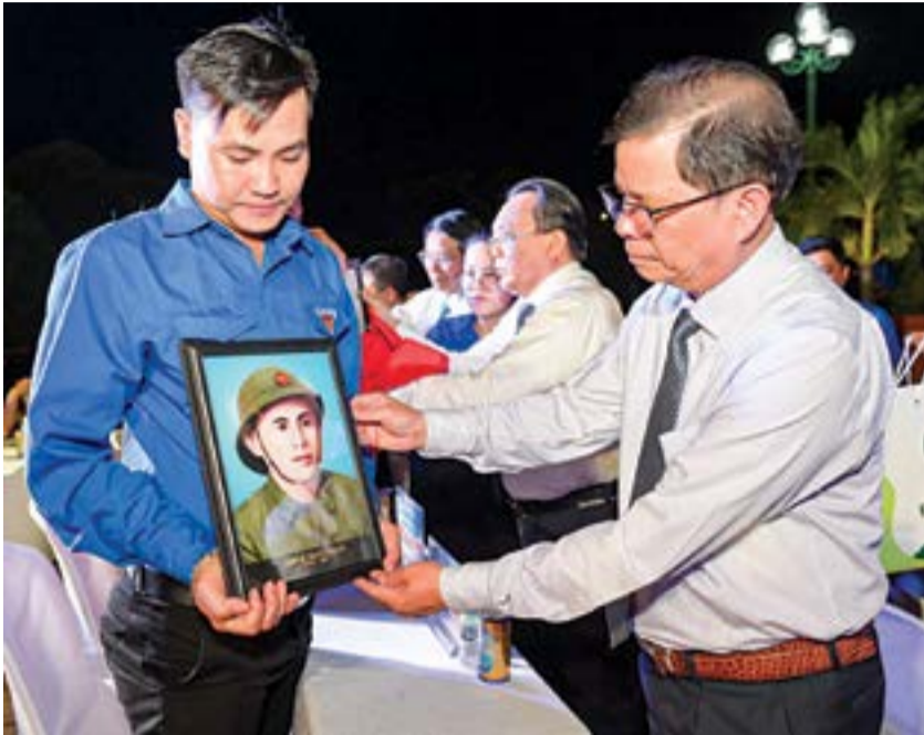
● Các đồng chí lãnh đạo tỉnh trao ảnh phục chế cho gia đình các liệt sĩ.