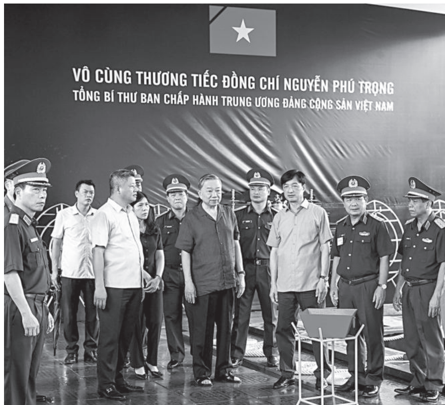
● Chủ tịch nước Tô Lâm cùng đoàn đã kiểm tra những công việc quan trọng để chuẩn bị cho lễ viếng, lễ truy điệu và an táng Tổng Bí thư Nguyễn Phú Trọng vào các ngày 25 - 26-7.