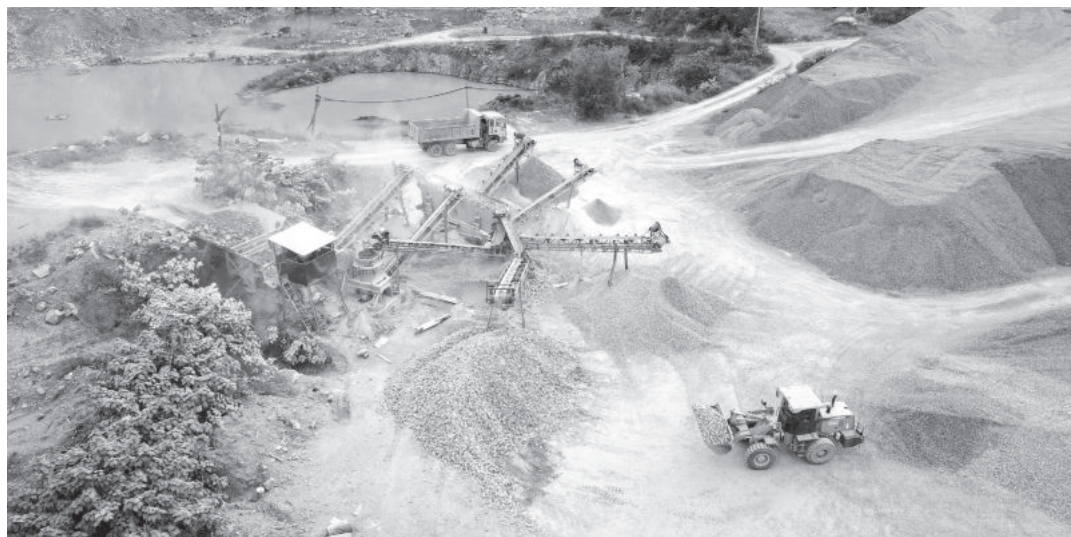
● Hoạt động khai thác tại một mỏ khoáng sản ở huyện Diên Khánh.