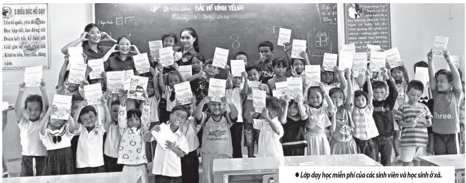
● Lớp dạy học miễn phí của các sinh viên và học sinh ở xã.