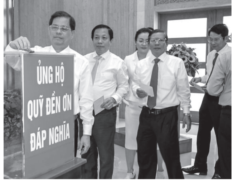
● Các đồng chí lãnh đạo tỉnh tham gia ủng hộ Quỹ “Đền ơn đáp nghĩa” tỉnh.

quyết hồ sơ người có công được thực hiện nghiêm túc, đúng quy định. Đến nay, toàn tỉnh không còn hồ sơ tồn đọng để nghị xác nhận người có công. Công tác quản lý mộ, nghĩa trang liệt sĩ, tổ chức thăm viếng, dâng hương, dâng hoa, di chuyển hài cốt liệt sĩ và xác định danh tính hài cốt liệt sĩ được thực hiện thường xuyên. Hiện nay, toàn tỉnh có 126 công trình ghi công liệt sĩ. Trong đó có, 7 nghĩa trang, 42 đài tưởng niệm,