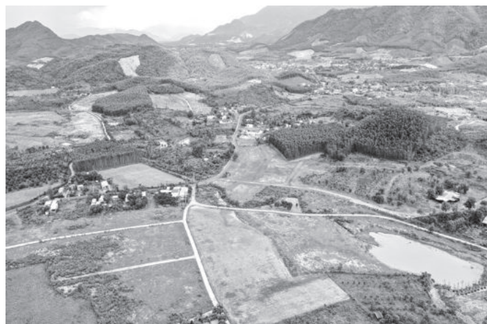
● Một khu vực đất nông nghiệp huyện Khánh Vinh.

Ngày 23-7, Thủ tướng Chính phủ có Chỉ thị số 22 yêu cầu Bộ Tài nguyên và Môi trường và các bộ, ngành có liên quan, UBND các tỉnh, thành phố trực thuộc Trung ương tổ chức thực hiện kiểm kê đất đai năm 2024 trên phạm vi cả nước.