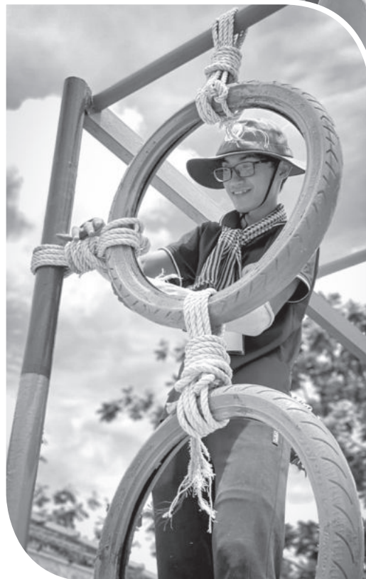
● Sửa chữa khu vui chơi cho thiếu nhi tại xã.