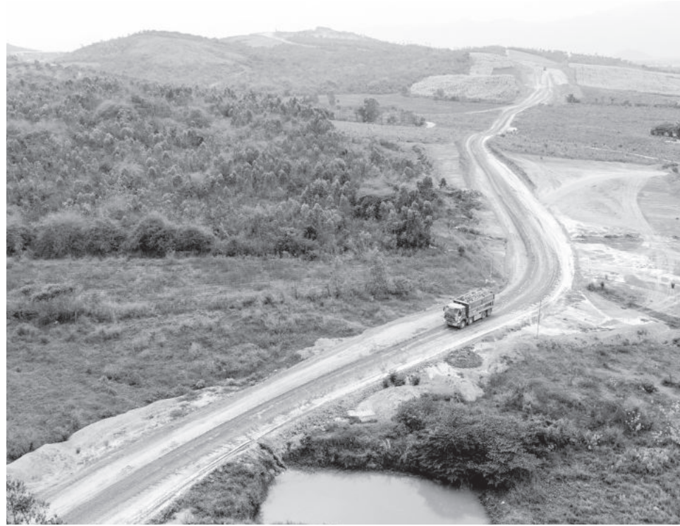
● Tiến độ dự án được cải thiện nhờ thuận lợi trong công tác giải phóng mặt bằng.

bằng, nền đường, cống thoát nước (đạt 16,73/22km). Công tác thi công đắp đất, đào đất, đào đá, làm cống vòm thi công đang triển khai đạt tiến độ... Đối với gói xây lắp số 2 (từ Km22 + 00 đến Km32 + 00), nhà thầu Phương Nam đang san ủi mặt bằng, nền đường, cống thoát nước được 2,4/9,5km. Các nhà thầu còn lại đang triển khai san ủi mặt bằng, đã hoàn thành việc xây dựng nhà ban điều hành và lán trại, triển khai đúc dầm, thi công đường công vụ... Năm 2024, Ban Quản lý Dự án đầu tư xây dựng các công trình giao thông tỉnh được giao 1.600 tỷ đồng tại Dự án Đường bộ cao tốc Khánh Hòa - Buôn Ma Thuột, đến nay đã giải ngân được hơn 300 tỷ đồng, đạt 20,67%.