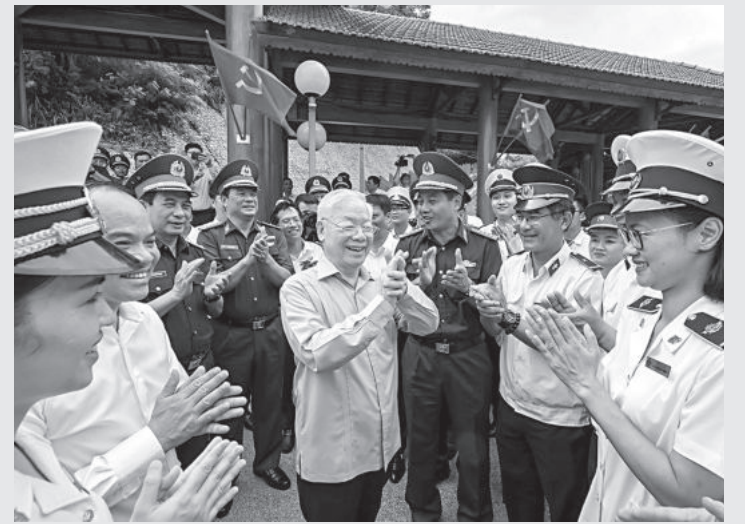
● Tổng Bí thư Nguyễn Phú Trọng với lực lượng chức năng Cửa khẩu quốc tế Hữu Nghị (tỉnh Lạng Sơn).

Được tin Tổng Bí thư Nguyễn Phú Trọng từ trần, đồng chí Trần Thanh Mẫn - Ủy viên Bộ Chính trị, Chủ tịch Quốc hội đã bày tỏ niềm tiếc thương vô hạn và chia sẻ những cảm xúc, suy nghĩ của mình về nhà lãnh đạo lỗi lạc của Đảng, Nhà nước và nhân dân ta.