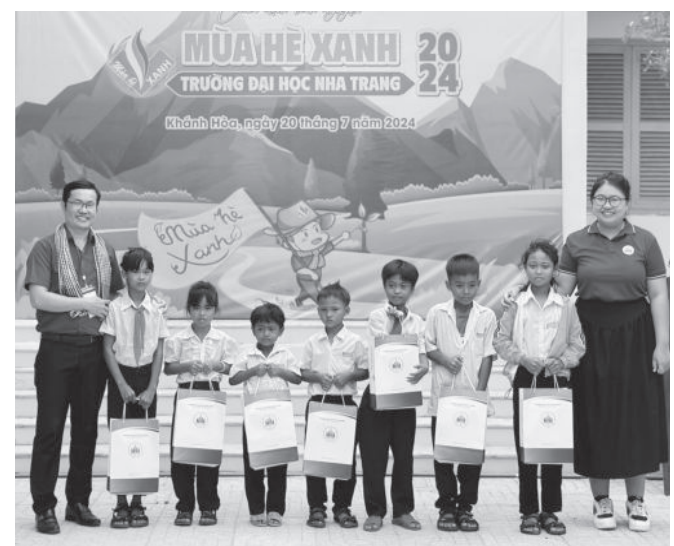
● Trao quà cho các thiếu nhi có hoàn cảnh khó khăn.