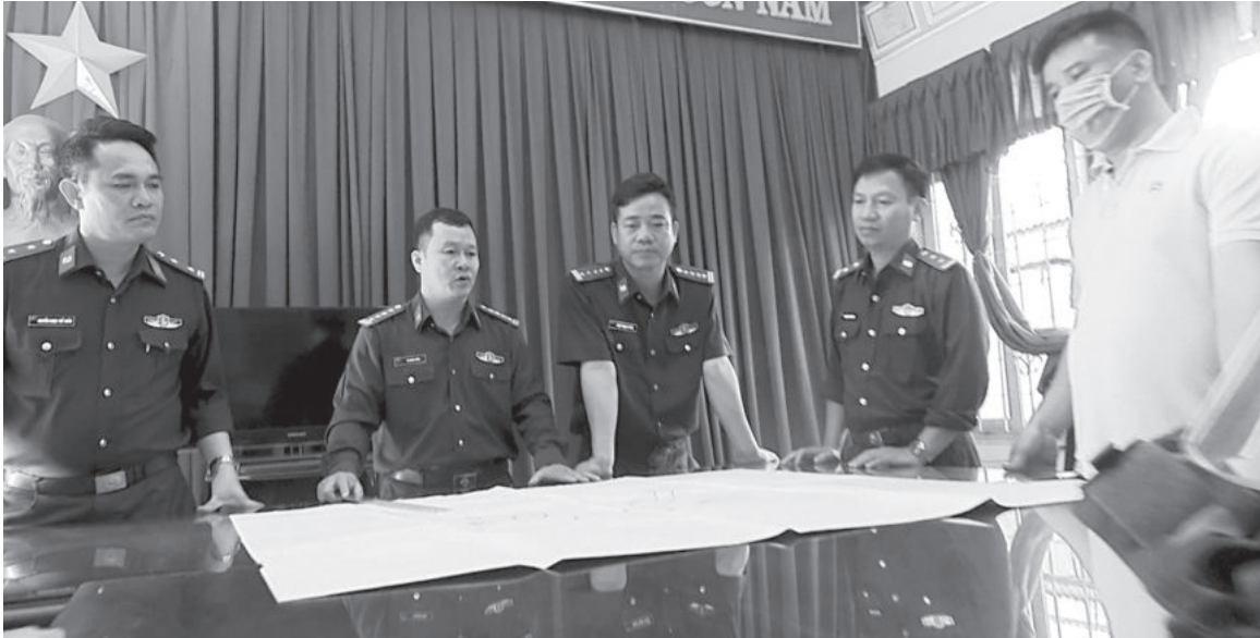
● Lực lượng Bộ đội Biên phòng tỉnh triển khai kế hoạch phá án về ma túy.

vẫn diễn biến phức tạp. Hoạt động mua bán, tàng trữ và sử dụng nhỏ lẻ các chất ma túy vẫn diễn ra. Các đối tượng đã hạn chế sử dụng phương thức mua bán truyền thống giao nhận "tiền - hàng" như trước; tăng cường lợi dụng dịch vụ Grab, shipper để thực hiện giao dịch, tiền thanh toán được chuyển vào tài khoản cá nhân; lợi dụng các ứng dụng mã hóa đầu cuối hoặc ứng dụng mạng xã hội có hệ thống máy chủ ở nước ngoài (Viber, Telegram, Wechat...) để giao dịch thực hiện các hành vi phạm tội liên quan đến ma túy. Các đối tượng cũng không hình thành các điểm mua bán ma túy cố định mà thường xuyên thay đổi điểm hẹn, điểm giao tiền, giao ma túy, hạn chế việc mua bán trực tiếp; quá trình trao đổi,