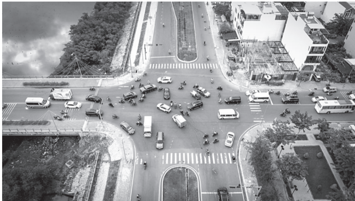
● Nút giao đường Tố Hữu và đường Vành đai 2 thường xuyên kẹt xe vào giờ cao điểm.

Tháng 3-2024, UBND tỉnh đồng ý chủ trương đầu tư Dự án Cải tạo, tổ chức giao thông nút giao đường Vành đai 2 và đường Tố Hữu với phương án đường Vành đai 2 đi thẳng chui dưới đường Tố Hữu kết hợp mở rộng cầu Quán Trường. Tuy nhiên, mới đây, Sở Giao thông vận tải đã báo cáo UBND tỉnh thay đổi phương án theo hướng, trước mắt chỉ mở rộng cầu Quán Trường, cải tạo nút giao 2 đầu cầu để đảm bảo an toàn giao thông.