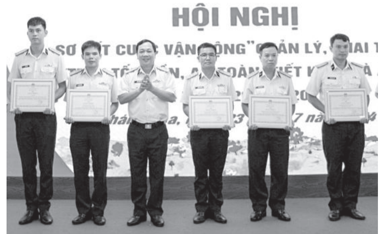
● Thủ trưởng học viện trao thưởng cho các tập thể, cá nhân có thành tích.

Chiều 23-7, Học viện Hải quân tổ chức hội nghị sơ kết 5 năm thực hiện Cuộc vận động “Quản lý, khai thác vũ khí, trang bị kỹ thuật tốt, bền, an toàn, tiết kiệm và an toàn giao thông” (Cuộc vận động 50) giai đoạn 2020 - 2024.