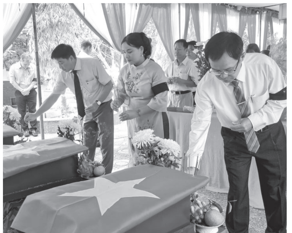
● Đoàn đại biểu HĐND, UBND huyện Khánh Vĩnh thắp hương viếng anh linh các liệt sĩ.