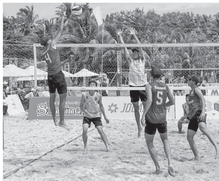
● Các vận động viên nam tuyển Sanvinest Khánh Hòa thi đấu tại giải.