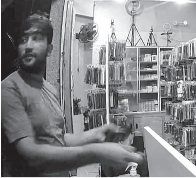
● Hình ảnh người dân cung cấp nghi phạm người nước ngoài sử dụng chiêu thức vờ mua hàng để lừa đảo các tiệm tạp hóa ở Ninh Hòa.

Mới đây, trên địa bàn thị xã Ninh Hòa xuất hiện một người nước ngoài đi tới các tiệm bán tạp hóa vờ mua hàng để tiến hành các hoạt động lừa đảo, chiếm đoạt tiền.