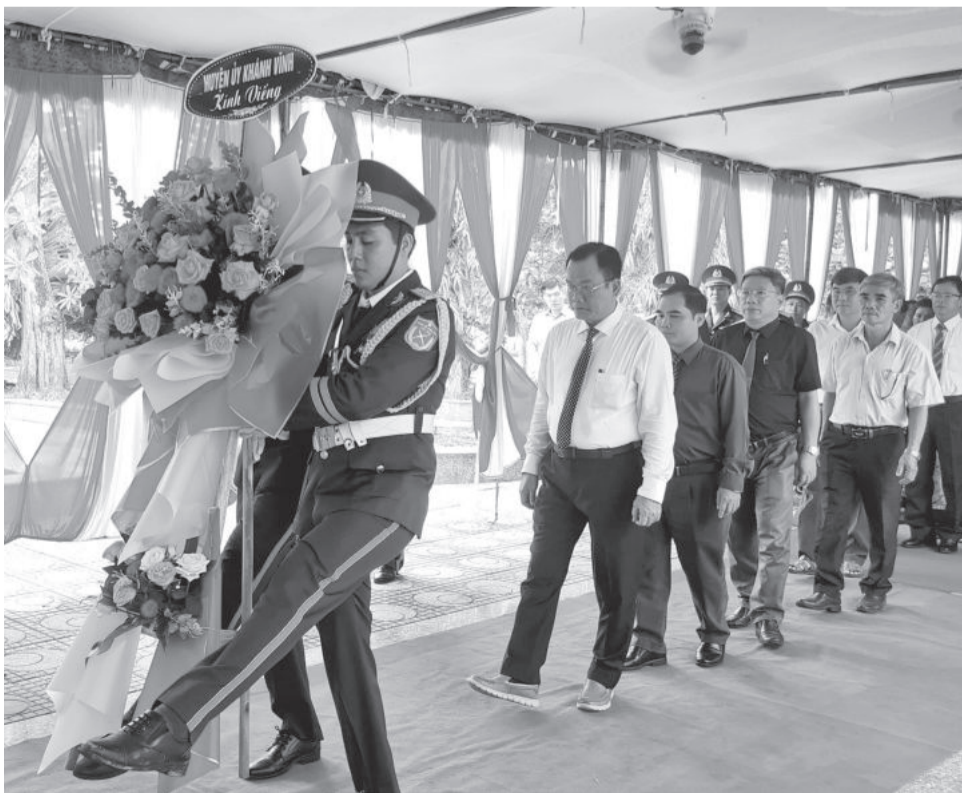
● Đoàn đại biểu Huyện ủy Khánh Vĩnh dâng hoa viếng anh linh các liệt sĩ.