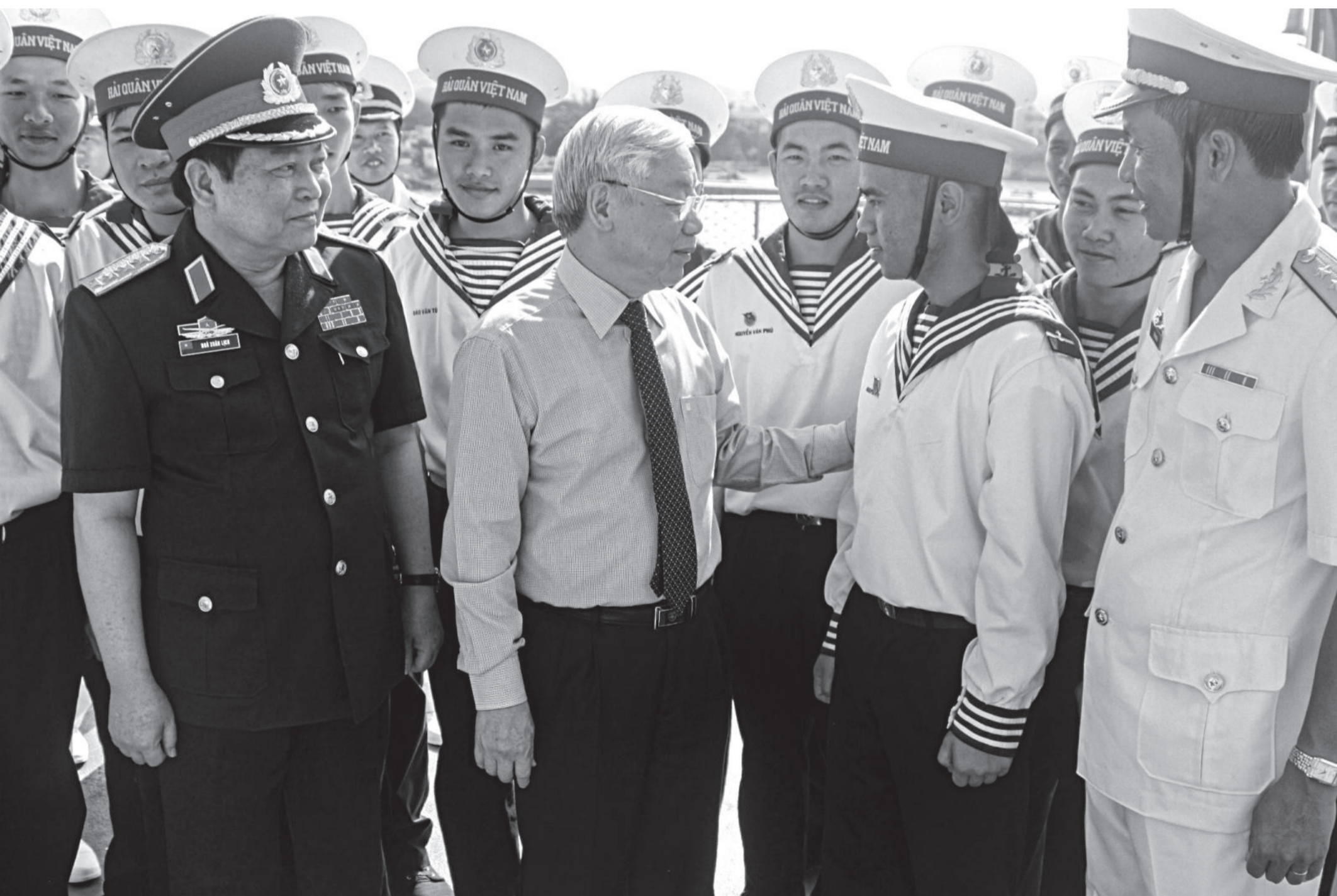
● Tổng Bí thư Nguyễn Phú Trọng thăm bộ đội tại huyện Trường Sa vào tháng 5-2016.

TÌNH CẢM CỦA CÁN BỘ, NHÂN DÂN KHÁNH HÒA VỚI TỔNG BÍ THƯ NGUYỄN PHÚ TRỌNG