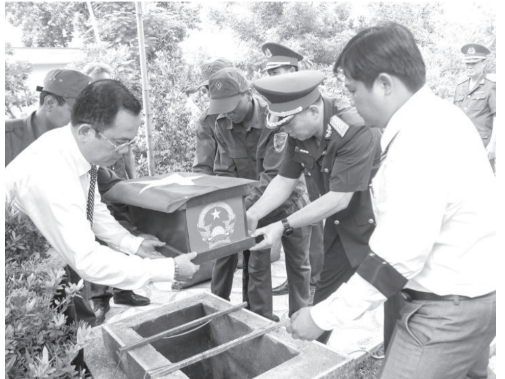
● Các đại biểu tiến hành lễ an táng hài cốt liệt sĩ.