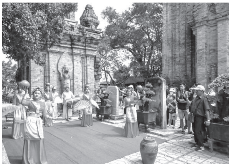
● Biểu diễn múa Chăm phục vụ khách tham quan di tích Tháp Bà Ponagar.