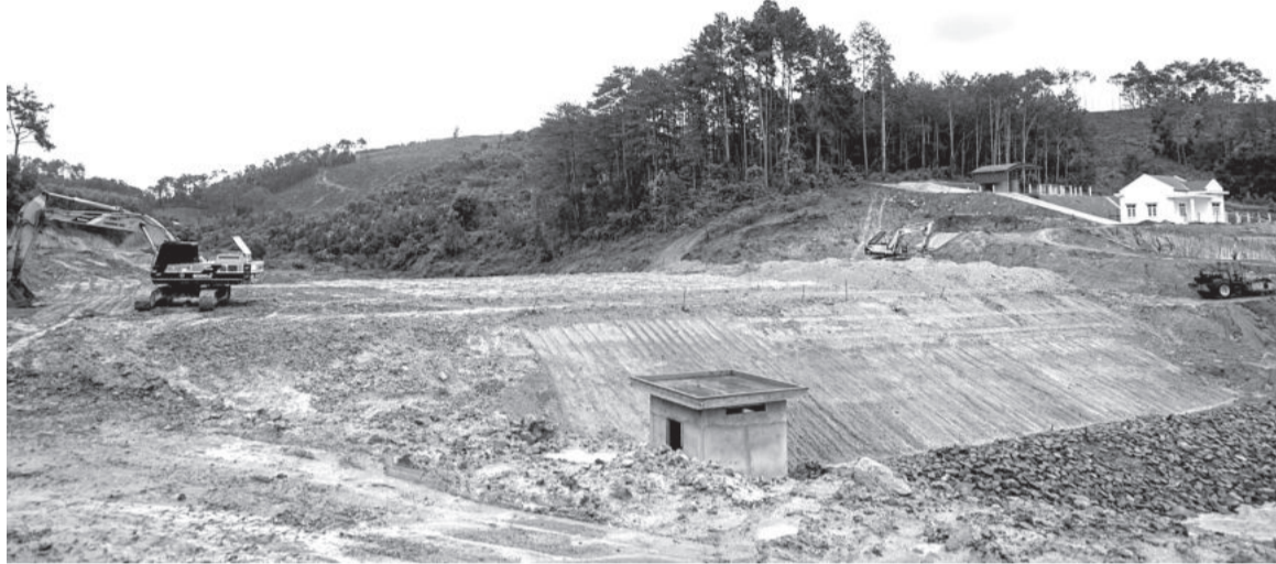
● Công trình hồ chứa nước đầu làng Ka Tơ đã thi công được 65% khối lượng.

Theo báo cáo của UBND huyện, hiện nay, địa phương có 41 công trình thủy lợi hoạt động, nhưng chỉ là các đập và kênh mương nhỏ, trong đó có 19 công trình hoạt động không hiệu quả. Công suất tưới thiết kế của các công trình thủy lợi trên địa bàn khoảng 225ha, nhưng thực tế chỉ tưới cho khoảng 198ha, chủ yếu là cây hàng năm, chỉ mới đáp ứng được khoảng 4% nhu cầu nước tưới phục vụ sản xuất nông nghiệp toàn huyện. Đối với 96% diện tích sản xuất nông nghiệp còn lại chủ yếu sử dụng nước mưa hoặc người