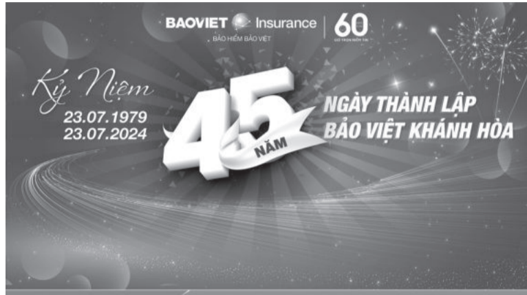
● Kỷ niệm một chặng đường hình thành và phát triển của Bảo Việt Khánh Hòa.