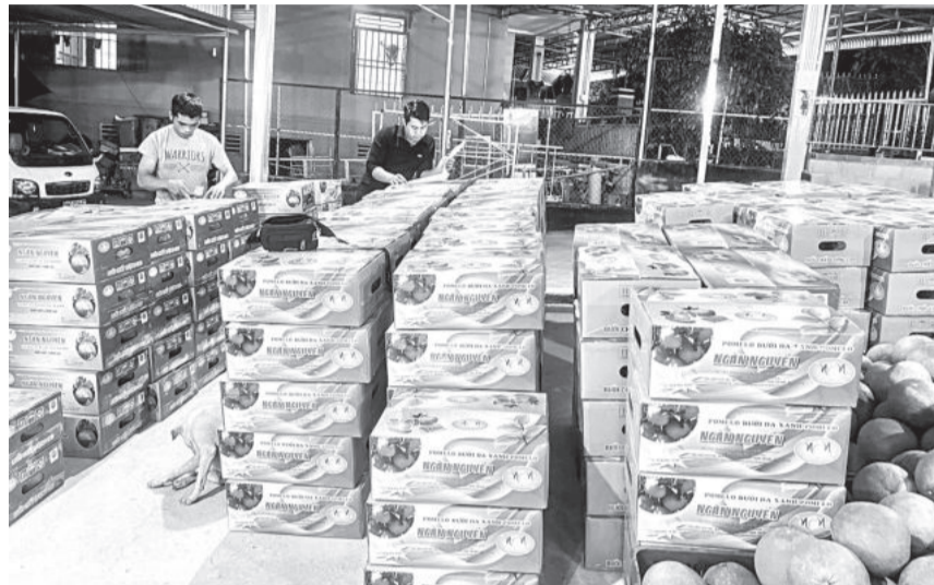
● Bưởi da xanh tại Công ty TNHH Xuất nhập khẩu trái cây và nông sản Ngân Nguyễn.