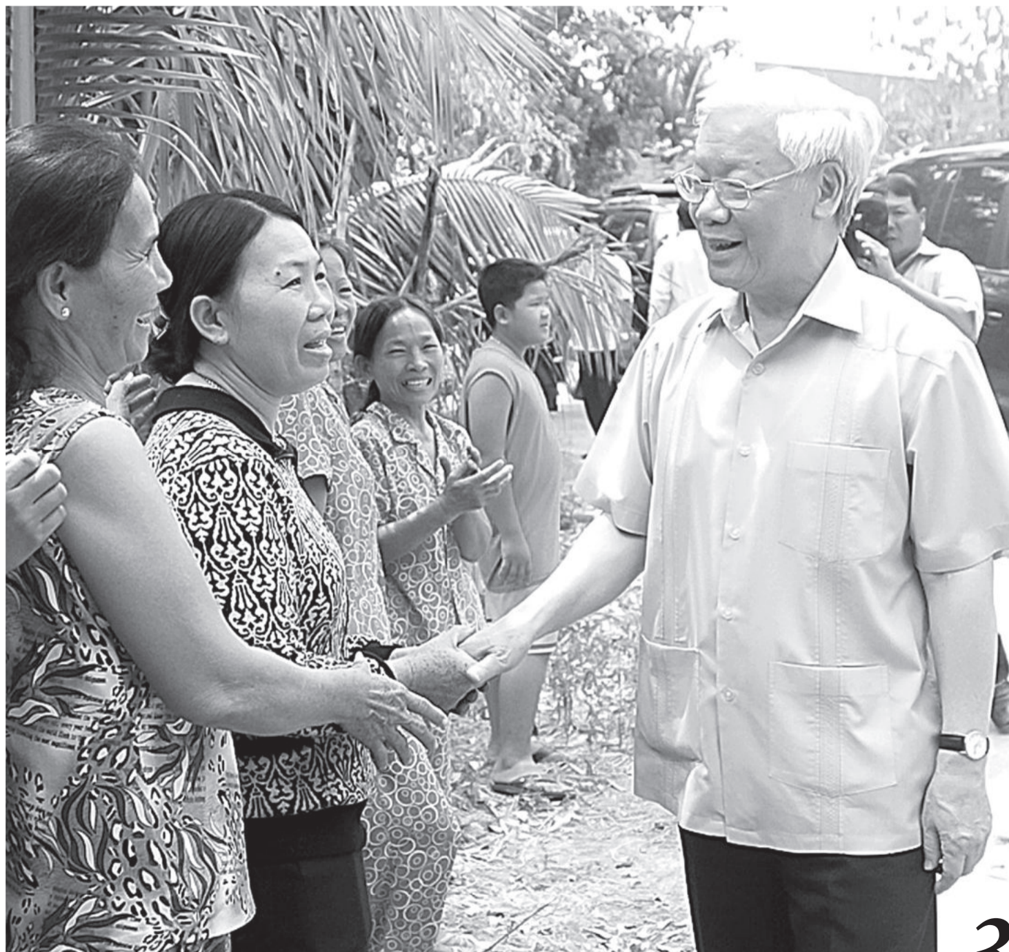
• Tổng Bí thư Nguyễn Phú Trọng thăm hỏi cuộc sống nhân dân xã Diên Điện, huyện Diên Khánh (tháng 5 năm 2016).

Báo Khánh Hòa trân trọng giới thiệu bài viết của Đại tướng Tô Lâm - Ủy viên Bộ Chính trị, Chủ tịch nước Cộng hòa XHCN Việt Nam.