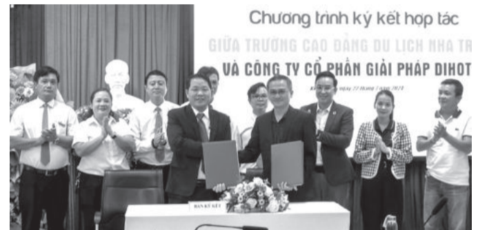
● Trường Cao đẳng Du lịch Nha Trang và Công ty Cổ phần Giải pháp DiHotel ký kết hợp tác.

Chiều 22-7, Trường Cao đẳng Du lịch Nha Trang tổ chức ký kết thỏa thuận hợp tác với Công ty Cổ phần Giải pháp DiHotel (TP. Hồ Chí Minh) và khách sạn Mường Thanh Luxury Viễn Triều về việc chuyển giao công nghệ, đào tạo, thực tập và giải quyết việc làm cho sinh viên.