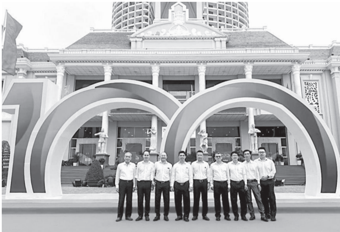
● Lãnh đạo và cán bộ Bảo Việt Khánh Hòa.

Theo lãnh đạo Bảo Việt Khánh Hòa, sau những bước đi sơ khởi, từ năm 1990 đến năm 2000, công ty bắt đầu chuyển mình cùng sự phát triển mạnh mẽ và không ngừng của toàn ngành Bảo hiểm. Môi trường kinh doanh ngày càng thông thoáng, mọi tiềm năng được khai thác, hành lang pháp lý về bảo hiểm được xây dựng. Giai đoạn từ năm 2000 đến năm 2009, tuy mức cạnh tranh trên địa bàn gay gắt và phức tạp nhưng với vị thế cùng sức mạnh nội lực của mình, Bảo Việt Khánh Hòa vẫn đứng vững, ngày càng được khách hàng tin yêu, tín nhiệm. Đến năm 2015, công ty có những bước tiến vượt bậc với doanh thu hàng năm tăng từ 15% đến hơn 20%. Bảo Việt Khánh Hòa đã khẳng định rõ nét hơn vị trí