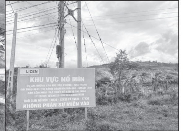
● Biển báo khu vực nổ mìn ở xã Ninh An.

Trao đổi với phóng viên ngày 22-7, ông Trương Anh Đài - Ban điều hành số 2, Công ty Cổ phần LIZEN cho biết: "Công ty đã cam kết với chính quyền địa phương sau khi kết thúc việc nổ mìn (dự kiến sẽ hoàn thành đầu tháng 8), đối với công trình nhà bị hỏng, công ty sẽ cùng đơn vị bảo hiểm, phối hợp với UBND xã Ninh An, thôn Hòa Thiện 1 thông báo đến từng hộ dân