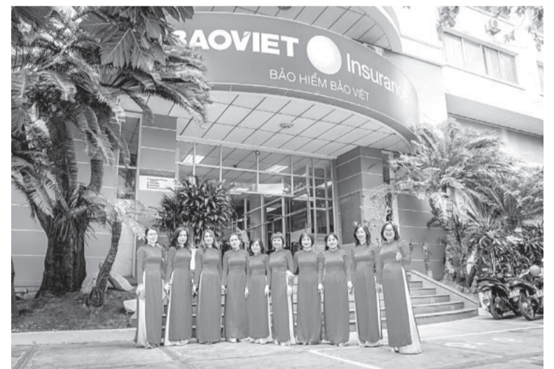
● Lực lượng nữ cán bộ, nhân viên Bảo Việt Khánh Hòa.

Để hiện thực hóa những mục tiêu đề ra, thời gian qua, Bảo Việt Khánh Hòa đã không ngừng nâng cao chất lượng phục vụ, năng lực cạnh tranh. Như trong các năm 2017 và 2018, liên tiếp xảy ra thảm họa thiên tai, gây tổn thất cho hàng loạt nhà máy và các công trình, khách sạn, xe cộ, tàu thuyền... là những khách hàng của Bảo Việt Khánh Hòa. Với trách