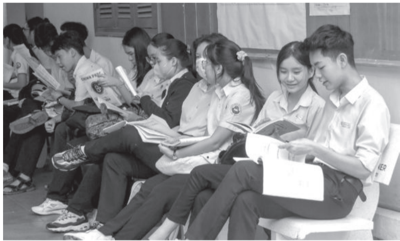
● Thí sinh tham dự kỳ thi vào lớp 10 năm học 2024 - 2025.