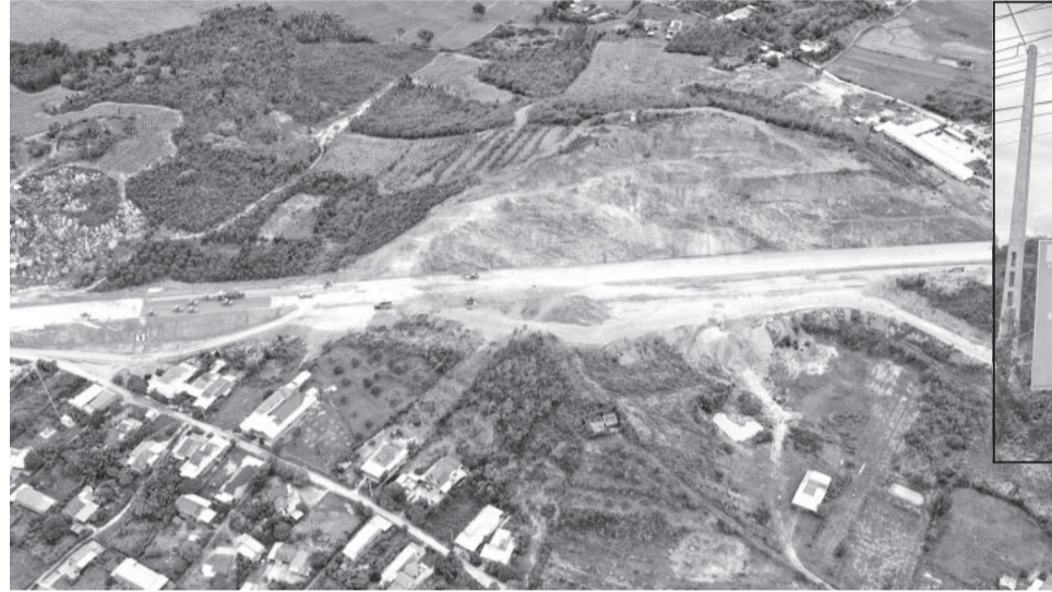
● Khu vực nổ mìn ảnh hưởng đến khu dân cư ở thôn Hòa Thiện 1 (xã Ninh An).

Thương cấp giấy phép sử dụng vật liệu nổ công nghiệp. Tuy nhiên, quá trình thực hiện nổ mìn vẫn xảy ra tình trạng đất, đá bay vào khu dân cư làm ảnh hưởng đến đời sống người dân. Qua kết quả kiểm tra ngày 27-5 cho thấy, có 10 hộ gia đình bị ảnh hưởng về nhà ở như: Bể mái ngói, hỏng mái tôn, có hiện tượng nứt vách tường nhà chính và nhà phụ. Đối với mái ngói bị bể và tôn bị thủng, Công ty Cổ phần LIZEN đã cùng người dân khắc phục sửa chữa; phần nứt vách tường nhà chính và phụ chưa thực hiện.