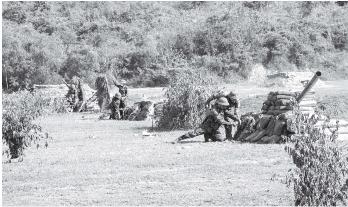
● Lực lượng vũ trang tỉnh bắn đạn thật trong diễn tập khu vực phòng thủ kết hợp phòng thủ dân sự tỉnh năm 2023.

Thời gian qua, Tỉnh ủy, UBND tỉnh đã tập trung lãnh đạo, chỉ đạo thực hiện toàn diện các giải pháp nâng cao chất lượng xây dựng và hoạt động khu vực phòng thủ (KVPT) tỉnh, huyện ngày càng vững chắc.