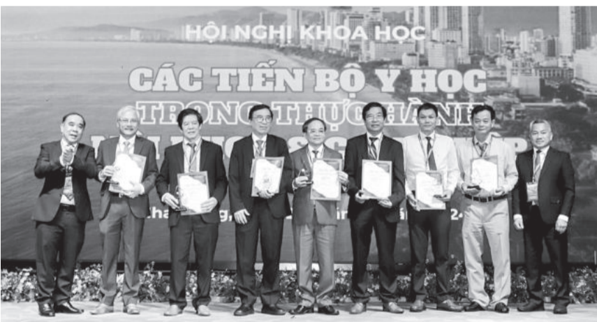
● Lãnh đạo Bệnh viện Đa khoa tỉnh trao kỷ niệm chương cho các chuyên gia đầu ngành về nội khoa tham gia hội nghị.

Trong 2 ngày 20 và 21-7, Bệnh viện Đa khoa tỉnh tổ chức hội nghị khoa học các tiến bộ y học trong thực hành nội khoa và can thiệp. Tham dự hội nghị có gần 200 chuyên gia, bác sĩ đến từ các bệnh viện, trường đại học y dược, đơn vị y tế trong và ngoài nước.