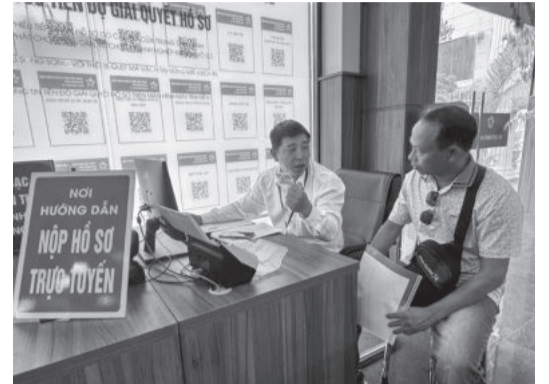
● Bộ phận hướng dẫn, hỗ trợ nộp hồ sơ trực tuyến tại Trung tâm Phục vụ hành chính công tỉnh.

UBND tỉnh vừa ban hành Chương trình hành động nâng cao chỉ số năng lực cạnh tranh cấp tỉnh (PCI), chỉ số xanh cấp tỉnh (PGI) năm 2024 với mục tiêu tạo chuyển biến đồng bộ, thực chất trên các tiêu chí thành phần của chỉ số PCI, phấn đấu chỉ số PCI nằm trong nhóm các tỉnh, thành phố có chất lượng điều hành tốt; duy trì và tiếp tục cải thiện chỉ số PGI trong năm 2025.