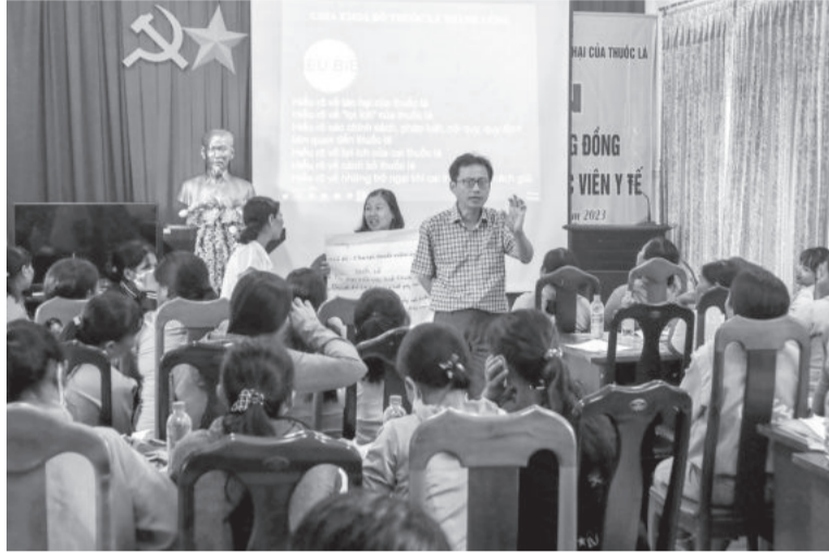
● Tập huấn tư vấn cai nghiện thuốc lá cho nhân viên y tế huyện Khánh Vĩnh.

Lượng mỡ thừa trong máu (hay còn gọi là mỡ máu cao) là tình trạng gia tăng cholesterol xấu, chất béo trung tính triglyceride hoặc tăng cả hai ở trong máu. Do vậy, để giảm tình trạng mỡ máu cao, các chuyên