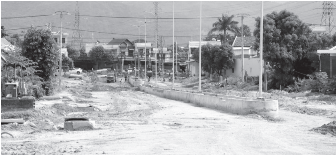
● Đường D30 đoạn nối ra đường 23 tháng 10 còn ngổn ngang.

Hiện nay, Dự án Đường D30 kết nối đường Võ Nguyên Giáp với đường 23 tháng 10 đã hết hạn thời gian trong hợp đồng nhưng vẫn chưa hoàn thành do vướng giải phóng mặt bằng. Mới đây, Ban Quản lý Dự án đầu tư xây dựng các công trình nông nghiệp và phát triển nông thôn tỉnh có văn bản đề nghị chấm dứt hợp đồng thi công với đơn vị liên danh nhà thầu nhưng UBND tỉnh không đồng ý.