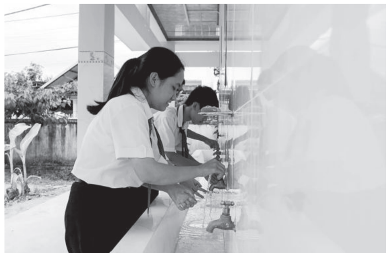
● Học sinh Trường THCS Ngô Quyền (huyện Diên Khánh) rửa tay bằng xà phòng.