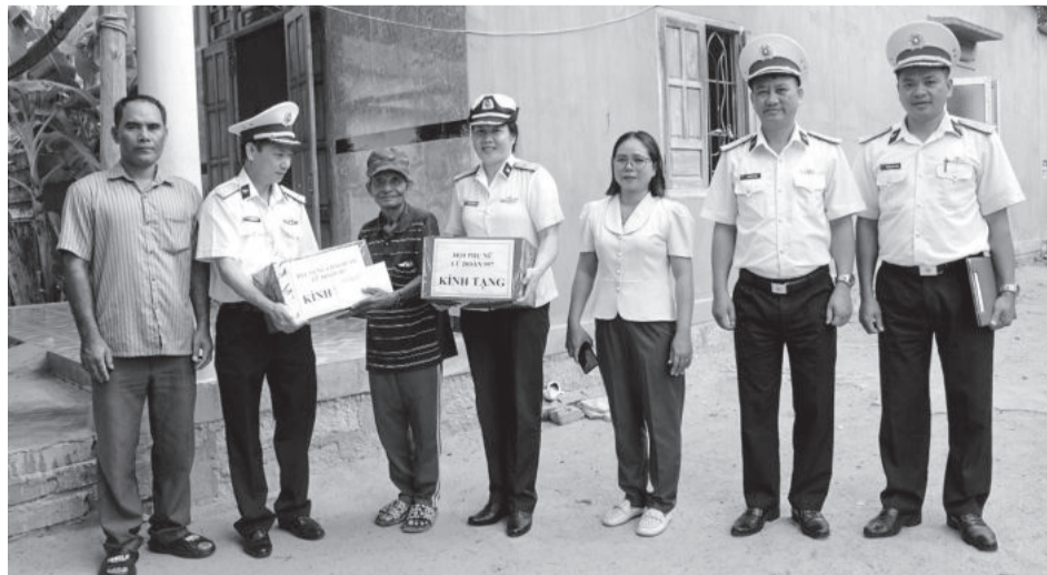
● Đại diện Lữ đoàn 957 trao quà cho một gia đình.