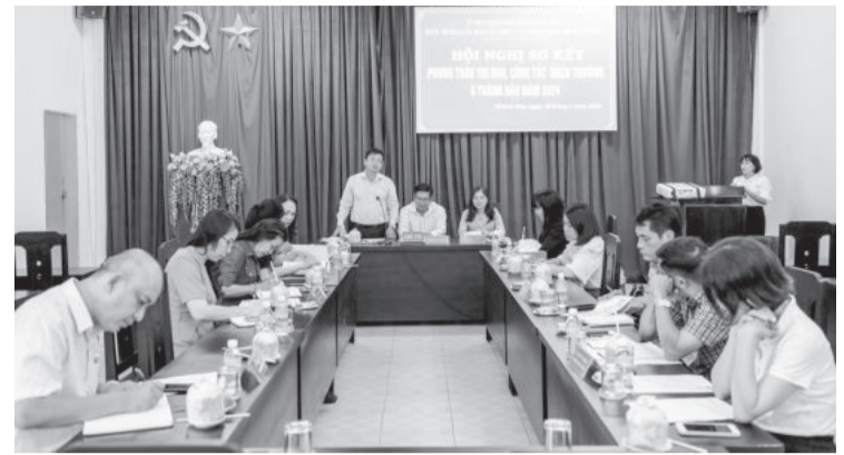
● Quang cảnh hội nghị.

Chiều 18-7, Khối thi đua các Đảng ủy khối và cơ quan trực thuộc Tỉnh ủy gồm các đơn vị: Báo Khánh Hòa - Trường khối; Đảng ủy Khối các cơ quan tỉnh; Đảng ủy Khối doanh nghiệp tỉnh; Trường Chính trị tỉnh; Đài Phát thanh và Truyền hình Khánh Hòa tổ chức hội nghị sơ kết phong trào thi đua, công tác khen thưởng 6 tháng đầu năm 2024.