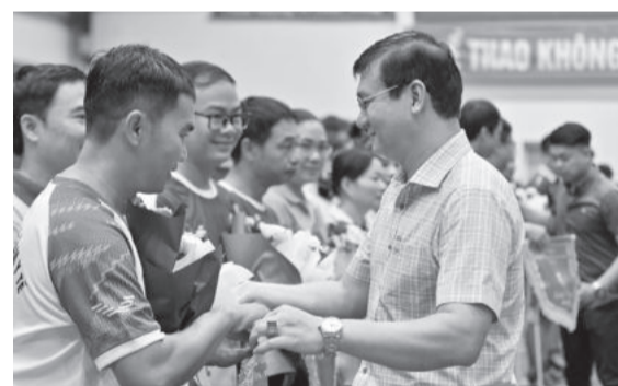
● Ban tổ chức tặng cờ và hoa cho đại diện các đoàn tham dự.

Sáng 18-7, tại TP. Nha Trang diễn ra lễ khai mạc hội thao Khối thi đua các viện, phân viện Trung ương năm 2024.