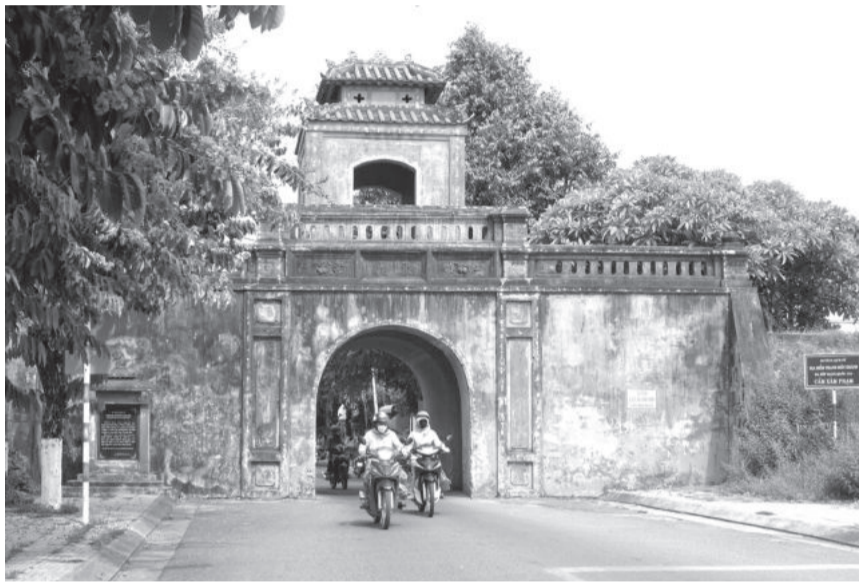
● Cổng phía đông của Thành cổ Diên Khánh.