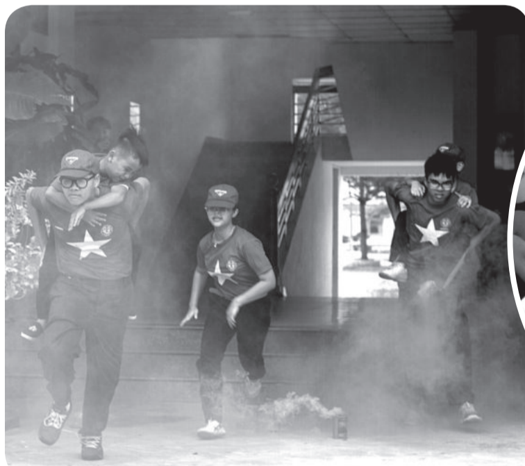
● Thực hành thoát hiểm khi xảy ra cháy nổ.