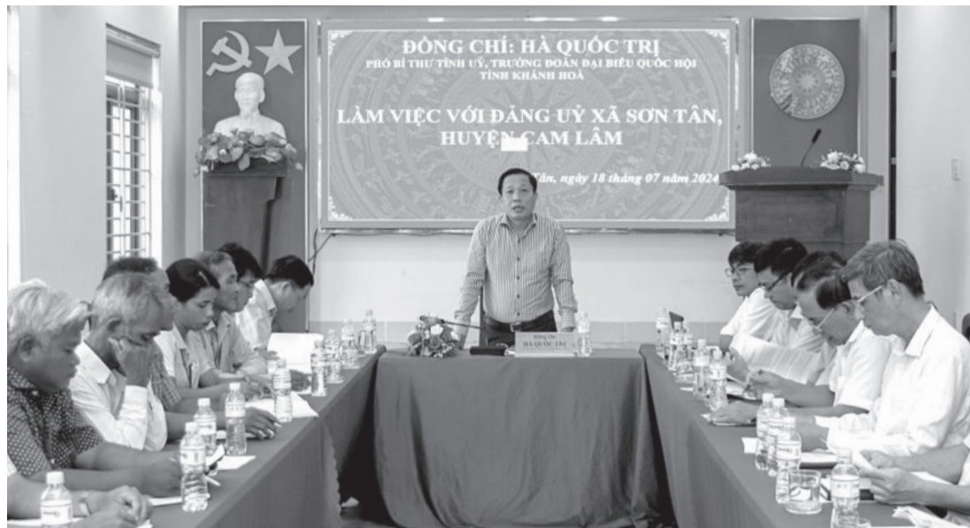
● Đồng chí Hà Quốc Trị phát biểu kết luận.

Chiều 18-7, đồng chí Hà Quốc Trị - Phó Bí thư Tỉnh ủy, Trưởng đoàn Đại biểu Quốc hội tỉnh làm việc với Đảng ủy xã Sơn Tân (huyện Cam Lâm) về tình hình thực hiện nhiệm vụ 6 tháng đầu năm 2024.