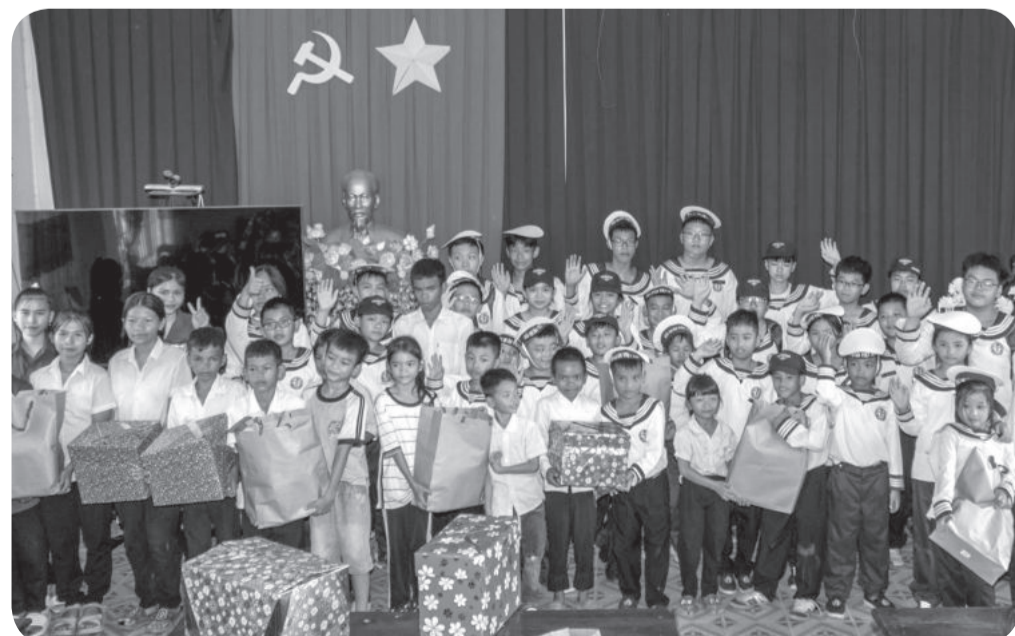
● Tham gia hoạt động xã hội, tặng quà cho thiếu nhi có hoàn cảnh khó khăn tại xã Cầu Bà (huyện Khánh Vĩnh).