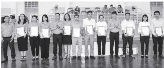
● Ban tổ chức trao giải cho các đơn vị có tiểu phẩm "Chủ tịch công đoàn cơ sở giỏi".

Cuộc thi tiểu phẩm "Chủ tịch công đoàn cơ sở giỏi" được tổ chức từ tháng 6, có 28 clip dự thi được tuyển chọn từ các LĐLĐ cấp huyện, công đoàn ngành, công đoàn cơ sở trực thuộc tham gia. Các đội thi đã đầu tư công phu, dàn dựng kịch bản chặt chẽ, hấp dẫn người xem, mang ý nghĩa tuyên truyền cao. Qua chấm điểm, Ban tổ chức đã trao 1 giải nhất, 2 giải nhì, 3 giải ba, 4 giải khuyến khích cho các clip dự thi xuất sắc;