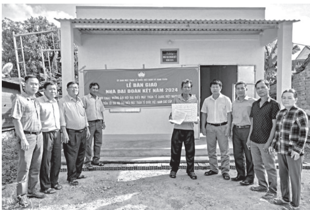
● Một căn nhà Đại đoàn kết do Mặt trận xã Diên Xuân (huyện Diên Khánh) hỗ trợ xây dựng.

Với phương châm “Chung tay vì người nghèo - không để ai bị bỏ lại phía sau”, thời gian qua, MTTQ Việt Nam các cấp trong tỉnh và các tổ chức chính trị - xã hội, cơ quan, đơn vị, doanh nghiệp, nhà hảo tâm đã có những hành động cụ thể. Thông qua những hoạt động như: Hỗ trợ xây nhà, tặng sinh kế, tạo điều kiện vay vốn... đã góp phần giúp những hoàn cảnh khó khăn, hộ nghèo trên địa bàn tỉnh vươn lên ổn định cuộc sống và thoát nghèo.