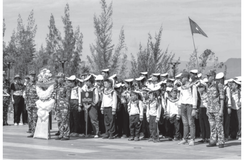
● Dâng hương, dâng hoa tại Khu tưởng niệm chiến sĩ Gạc Ma.