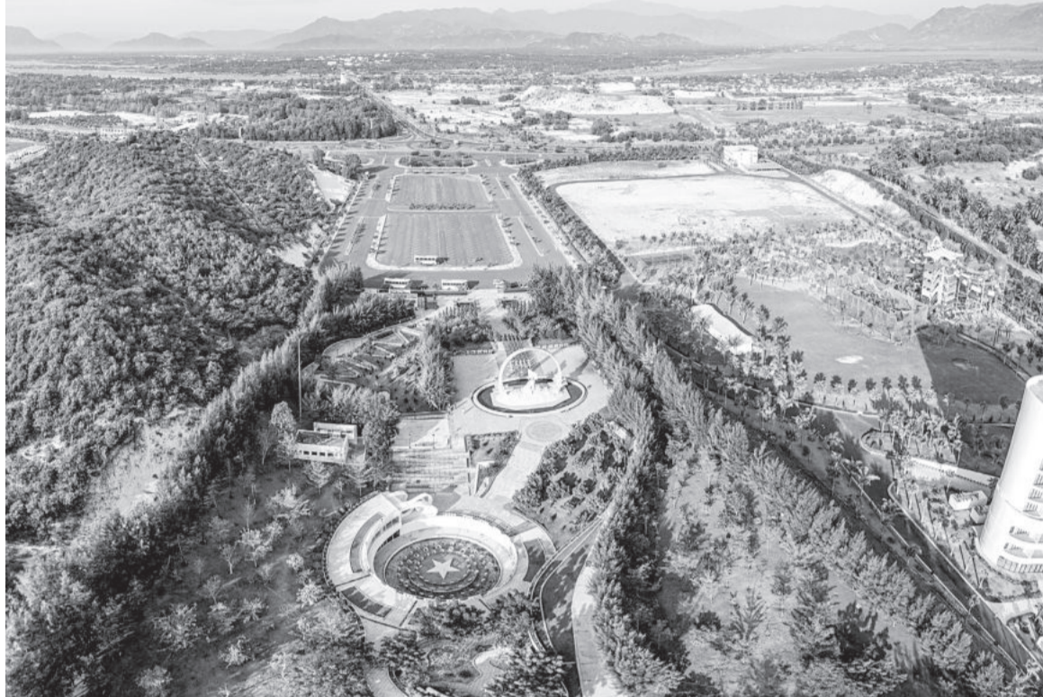
● Một góc Cam Lâm.

đô thị, huyện đã lập tờ trình phê duyệt chủ trương lập Chương trình phát triển đô thị khu vực dự kiến hình thành đô thị mới Cam Lâm, tỉnh Khánh Hòa đến năm 2045 và đã được Sở Xây dựng cho ý kiến đối với nội dung này. Ngày 22-5, UBND huyện tiếp tục trình UBND tỉnh về việc phê duyệt kế hoạch tổ chức lập Chương trình phát triển đô thị khu vực dự kiến hình thành đô thị mới Cam Lâm và đã được Sở Xây dựng cho ý kiến. UBND huyện đang trình HĐND huyện xem xét, bổ sung danh mục dự án lập Chương trình phát triển đô thị mới Cam Lâm vào kế hoạch đầu tư công trung hạn giai đoạn 2021 - 2025 của huyện và phê duyệt chủ trương đầu tư dự án vào kỳ họp HĐND huyện trong tháng 7. Sau khi