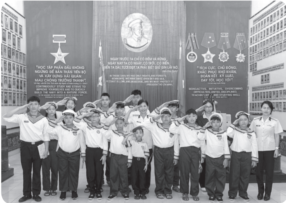
● Tham quan Nhà truyền thống Học viện Hải quân.