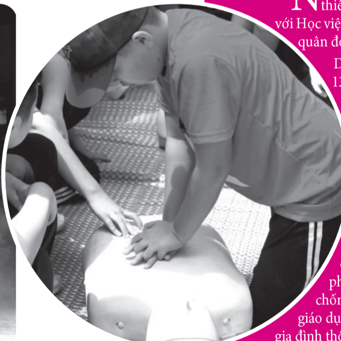
● Các học viên được tập huấn kiến thức về sơ cứu.

Nhằm tạo sân chơi rèn luyện ý nghĩa, bổ ích cho thiếu nhi trong dịp hè, Tỉnh đoàn vừa phối hợp với Học viện Hải quân tổ chức chương trình Học kỳ trong quân đội “Chúng em là chiến sĩ Hải quân” năm 2024.