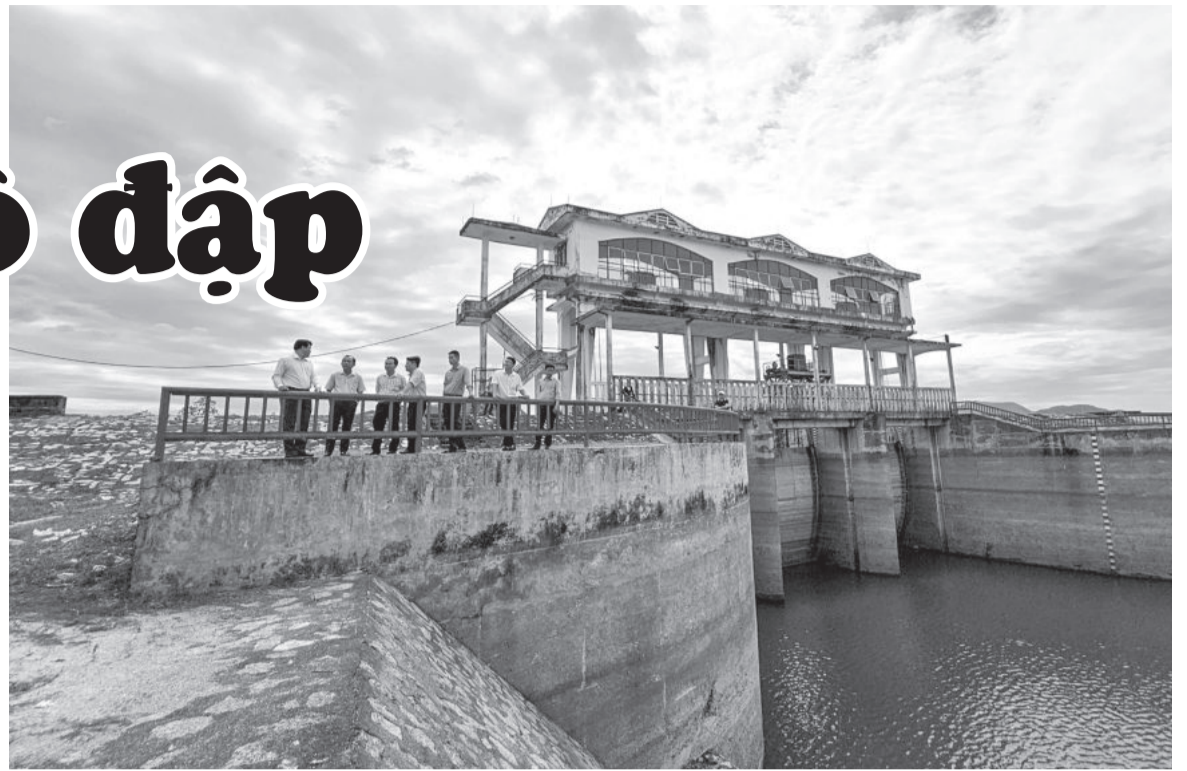
● Đoàn công tác của Sở Nông nghiệp và Phát triển nông thôn kiểm tra tại hồ chứa nước Suối Dầu.

Công ty Thủy lợi Khánh Hòa được tỉnh giao quản lý, khai thác 19 hồ chứa nước, có tổng dung tích hơn 213 triệu m 3 ; 32 đập dâng trên sông, suối; hơn 460km kênh mương và công trình trên kênh; 3 trạm bơm. Hệ thống này hàng năm cấp nước cho sinh hoạt và các hoạt động công nghiệp, dịch vụ, nông nghiệp... Trong đó, cấp nước thô sinh hoạt khoảng 22 triệu m 3 /năm, cấp nước tưới cho sản xuất nông nghiệp khoảng 32.000ha/năm.