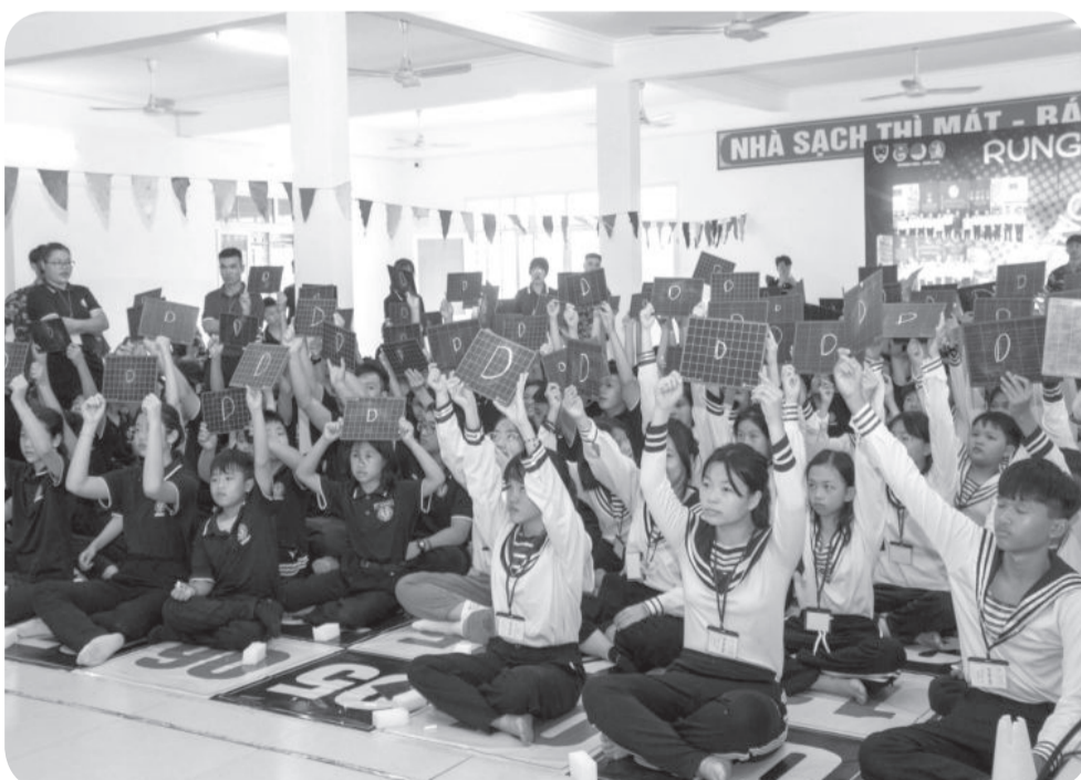
● Tham gia trau dồi kiến thức với hình thức thi rung chuông vàng.