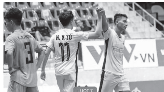
● Trận đấu giữa Sanvinest Khánh Hòa và Luxury Hạ Long giai đoạn lượt đi.

Trước khi bước vào vòng đấu này, Sanvinest Khánh Hòa đang có 12 điểm, tạm xếp vị trí thứ 6 trên bảng xếp hạng sau 3 trận thắng, 3 trận hòa và 5 trận thua. Trong khi đó, đội khách Luxury Hạ Long chỉ có 1 điểm với 1 trận hòa, đứng cuối bảng xếp hạng. Ở trận đấu này, Sanvinest Khánh Hòa được đánh giá cao hơn về thực lực cũng như kinh nghiệm. Tại giai đoạn lượt đi, Sanvinest Khánh Hòa đã có chiến thắng 3-1 trên sân của Luxury Hạ Long. Đây sẽ là cơ hội để các cầu thủ phổ biến có được trận thắng đầu tiên trên sân nhà ở giai đoạn lượt về.