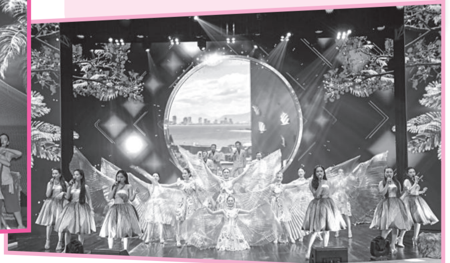
● Tiết mục hát múa "Khánh Hòa - nhịp sống mới".