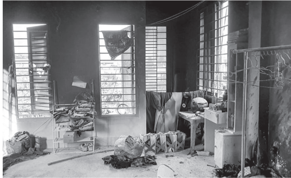
● Lực lượng phòng cháy, chữa cháy phường Vĩnh Hải kịp thời dập tắt đám cháy xảy ra tại tầng 3 căn nhà trên đường 2 tháng 4.

lượng PCCC cơ sở dập tắt kịp thời. Qua đó, đã ngăn chặn đám cháy bùng phát lớn, hạn chế đến mức thấp nhất thiệt hại về tài sản cho nhân dân. Ngoài vụ việc điển hình nêu trên, trước đó, lực lượng PCCC tại chỗ phường Vạn Thắng cũng kịp thời can thiệp, dập tắt đám cháy xảy ra tại kho chứa đồ điện lạnh cũ ở Tổ dân phố 2 Vạn Đức. Đây là kho hàng điện lạnh cũ nằm trong khu dân cư, khi đám cháy xảy ra, các thành viên trong Tổ liên gia an toàn PCCC Vạn Đức đã bấm chuông báo cháy để cảnh báo cho