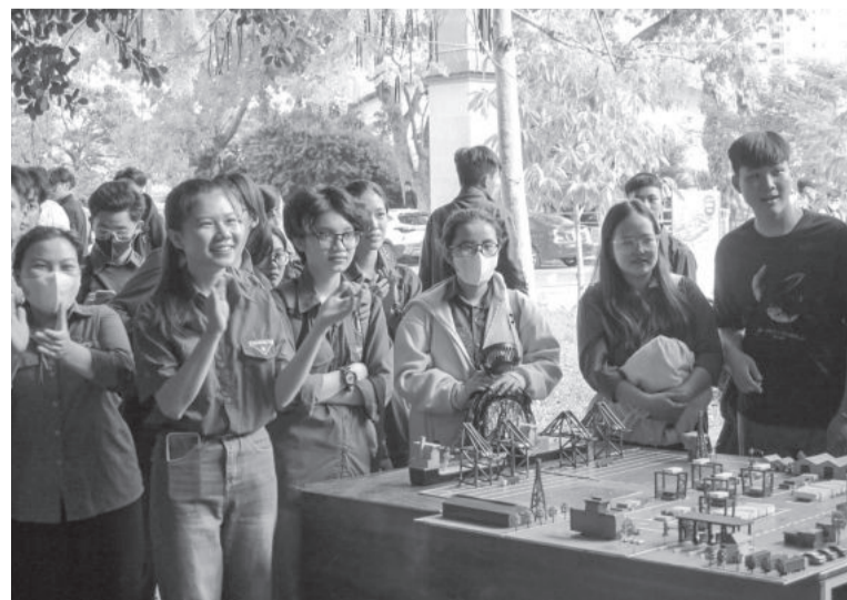
● Sinh viên Trường Đại học Nha Trang.