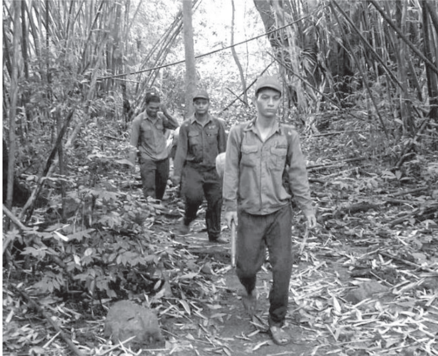
● Lực lượng của Ban Quản lý rừng phòng hộ Nam Khánh Hòa và người dân nhận khoán bảo vệ rừng đi tuần tra ở xã Thành Sơn.

Chính sách giao khoán bảo vệ rừng cho hộ đồng bào dân tộc thiểu số (ĐBDTTS), người Kinh nghèo được huyện Khánh Sơn nỗ lực triển khai bước đầu đã đem lại hiệu quả. Đến nay, trên địa bàn có 222 hộ nhận khoán bảo vệ hơn 6.260ha rừng tự nhiên, với tổng kinh phí hơn 2,5 tỷ đồng/năm.