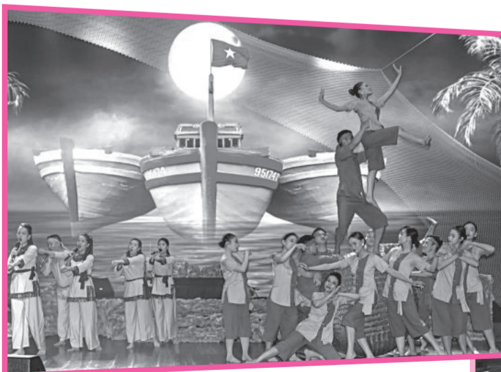
● Tiết mục ca cảnh "Khúc hát ra khơi".

Chương trình nghệ thuật mới của Đoàn Ca múa nhạc Hải Đăng cho thấy được sự nhẹ nhàng, gọn gàng trong âm nhạc, vũ đạo, hình ảnh sân khấu, trang phục biểu diễn. Về cơ bản, tập thể đoàn đã hoàn thành yêu cầu dàn dựng những tiết mục có nội dung tư tưởng, hình thức nghệ thuật tốt. Tuy nhiên, vẫn còn một vài chi tiết nhỏ trong các tiết mục cụ thể cần được nghiên cứu chỉnh sửa, hoàn thiện trước khi biểu diễn phục vụ khán giả.