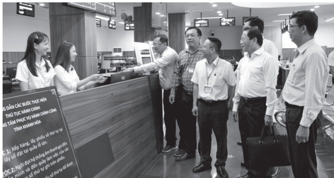
● Đoàn công tác của TP. Cần Thơ tham quan, trao đổi kinh nghiệm cải cách hành chính tại Trung tâm Phục vụ hành chính công tỉnh vào tháng 6-2024.

Kết quả khảo sát, đánh giá mức độ hài lòng của tổ chức, cá nhân đối với sự phục vụ của cơ quan hành chính nhà nước và đơn vị sự nghiệp công lập trên địa bàn tỉnh (SIPAS) năm 2023 do UBND tỉnh công bố trong tháng 6 đã cho thấy những chuyển biến tích cực. Đây là động lực để cán bộ, công chức, viên chức toàn tỉnh tiếp tục nỗ lực nâng cao chất lượng phục vụ, đáp ứng mong đợi của người dân, tổ chức.