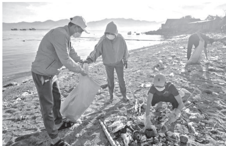
● Người dân tham gia thu gom rác tại khu vực bãi biển xã Vĩnh Lương.

Đến thôn Đông Bé (xã Diên Thọ, huyện Diên Khánh), hỏi