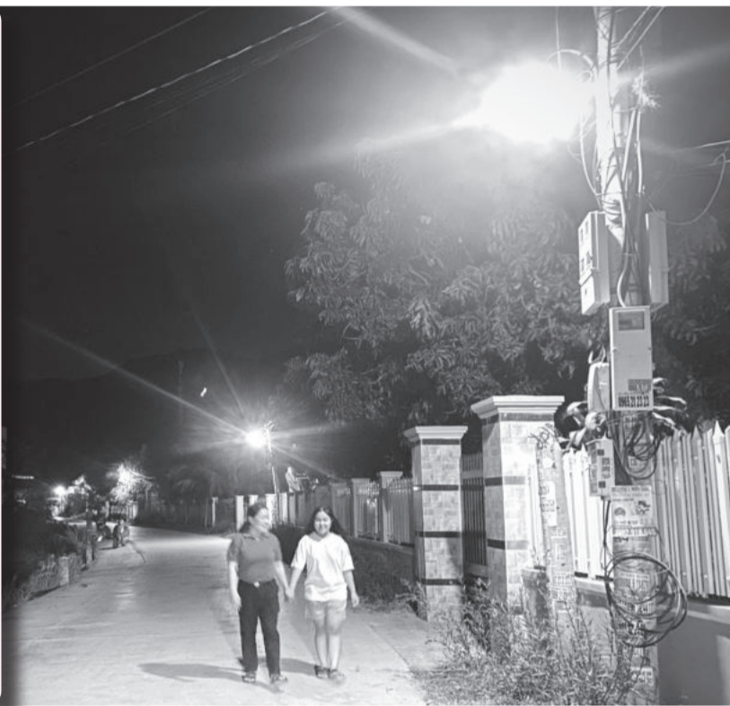
● Mô hình “Thắp sáng đường quê” ở xã Ninh Ích, thị xã Ninh Hòa.

Bên cạnh những già làng, người có uy tín phát huy tốt vai trò “giữ lửa” ở buôn làng, thời gian qua, mặt trận các cấp và các tổ chức thành viên có nhiều hình thức tuyên truyền bền bỉ và hiệu quả đã đẩy mạnh các phong trào thi đua, phát triển nhiều mô hình “Dân vận khéo” nhằm huy động sức dân để chăm lo cho dân. Qua đó, góp phần nâng cao đời sống cho người dân, giúp các vùng quê ngày càng “thay da, đổi thịt”.