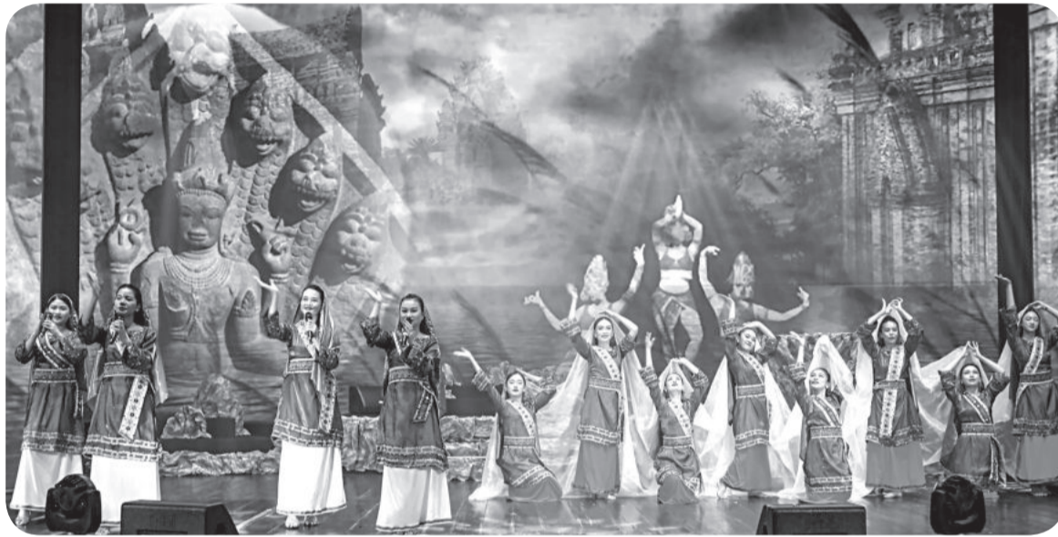
● Tiết mục hát múa "Lời yêu đêm hội".

Sau hơn 2 tháng dàn dựng, tập luyện, tối 16-7, Đoàn Ca múa nhạc Hải Đăng có buổi diễn báo cáo với Hội đồng nghệ thuật Sở Văn hóa và Thể thao chương trình nghệ thuật năm 2024. Với 7 tiết mục ca, múa, nhạc được đầu tư công phu, đa số mang màu sắc dân gian đương đại hứa hẹn sẽ được khán giả đón nhận.