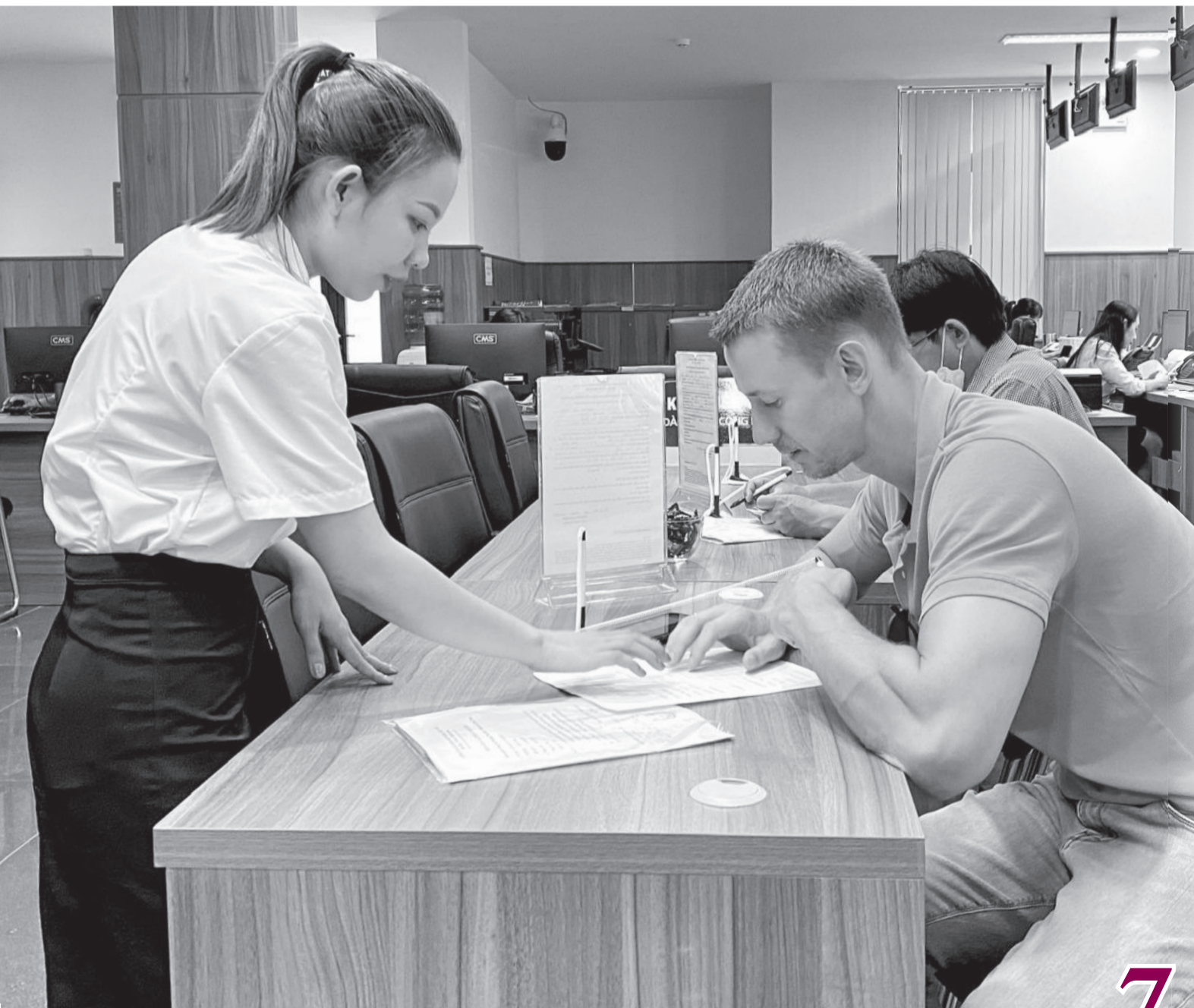
• Nhân viên Trung tâm Phục vụ hành chính công tỉnh hướng dẫn khách hàng thực hiện thủ tục hành chính.