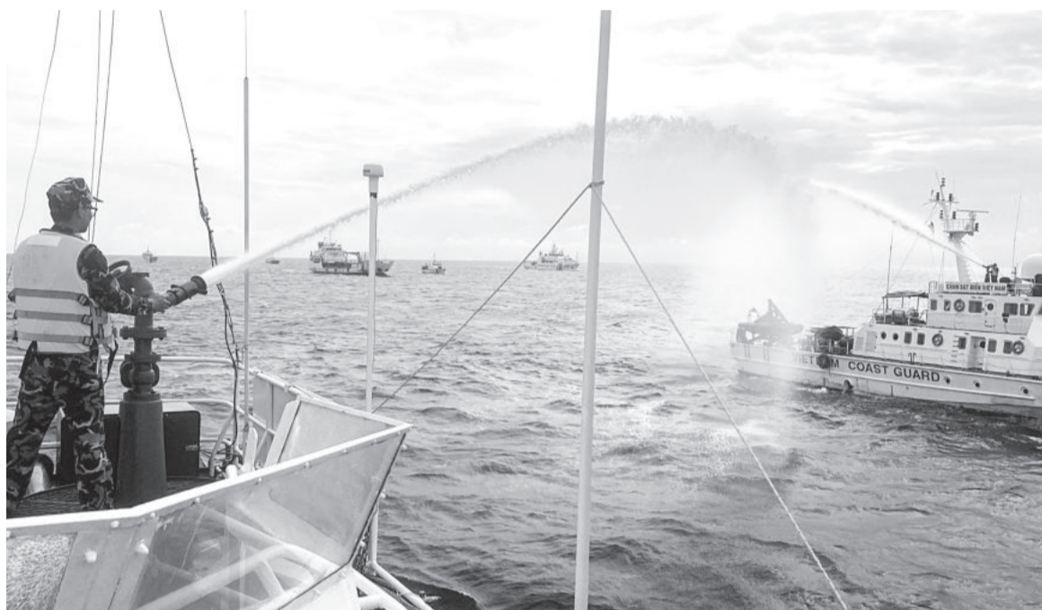
● Các cán bộ, chiến sĩ huấn luyện nâng cao năng lực sẵn sàng chiến đấu.

Thời gian qua, Đảng ủy, Bộ Tư lệnh Vùng Cảnh sát biển 3 tập trung lãnh đạo, chỉ đạo công tác huấn luyện, sẵn sàng chiến đấu, xem đây là nhiệm vụ chính trị trọng tâm, nội dung quan trọng quyết định chất lượng tổng hợp, sức mạnh chiến đấu của các đơn vị nhằm đáp ứng yêu cầu nhiệm vụ trong tình hình mới.