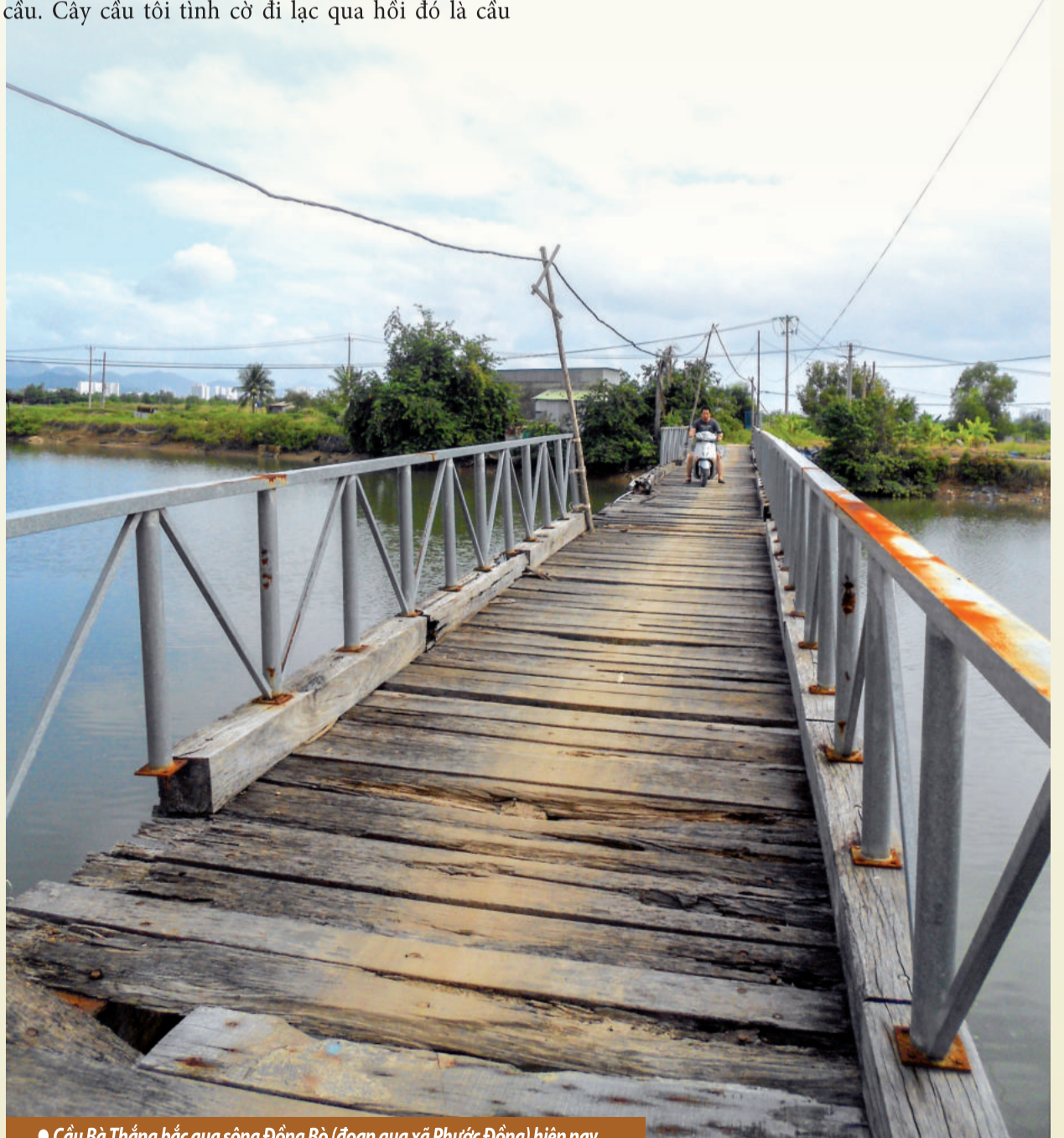
● Cầu Bà Thắng bắc qua sông Đông Bò (đoạn qua xã Phước Đông) hiện nay.