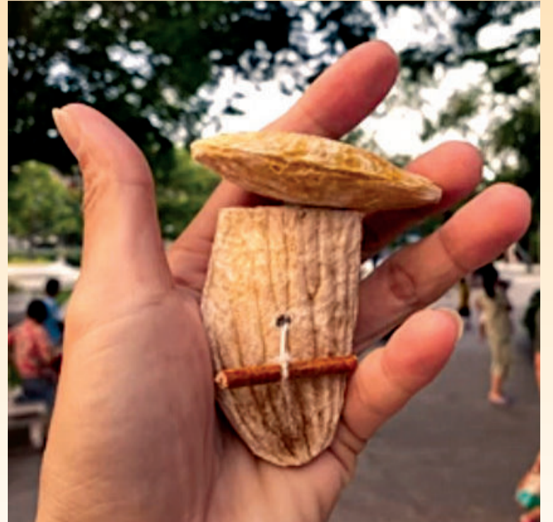
● Ảnh internet

Đã gần bảy mươi tuổi rồi, vậy mà đến mùa, cầm cái hạt xoài đã gọt nhãn bóng, lại nhớ tới hồi mình còn là con trẻ. Mọi thứ cứ tưởng như mới vừa diễn ra hôm qua. Nhớ cả câu đồng dao gắn