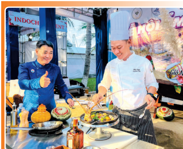
● Liên hoan Du lịch biển Nha Trang 2024 sẽ có nhiều gian hàng ẩm thực giới thiệu món ngon xứ Trầm Hương.