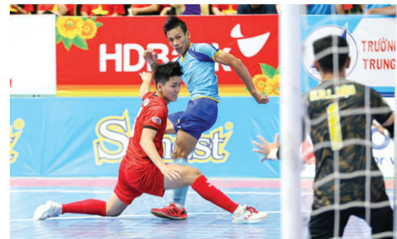
● Trận đấu giữa Sanvinest Khánh Hòa gặp Tân Hiệp Hưng - TP. Hồ Chí Minh mùa giải năm ngoái.

Đội tuyển futsal quốc gia thi đấu vòng chung kết Giải futsal châu Á quốc gia đã chính thức trở lại. Câu lạc bộ Futsal Sanvinest Khánh Hòa đã giành đường tiếp theo của mùa giải.