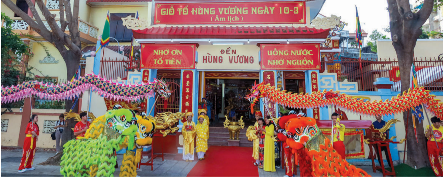
● Đền Hùng Vương - một trong những di tích vừa hoàn thành xong việc tu bổ.

Vừa qua, Sở Văn hóa và Thể thao đã nghiệm thu, bàn giao để đưa vào sử dụng nhiều di tích sau khi hoàn thành việc tu bổ. Đây đều là những di tích đã được UBND tỉnh xếp hạng nên việc tu bổ kịp thời những hạng mục công trình bị xuống cấp góp phần giữ cho di tích tiếp tục trường tồn cùng thời gian.