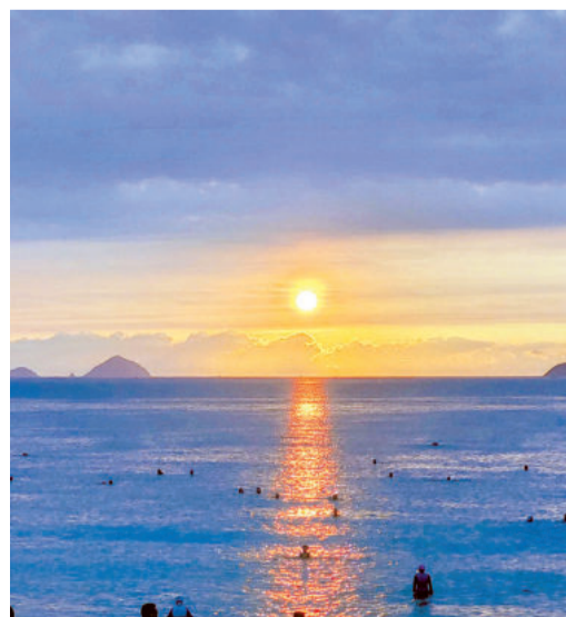
● Ảnh: NHÂN TÂM