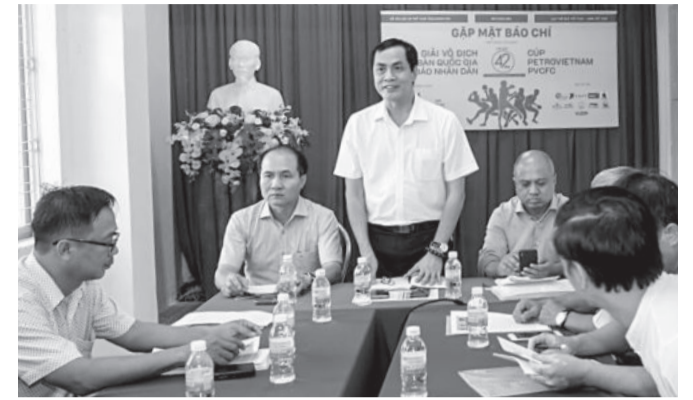
● Ban tổ chức gặp mặt báo chí thông tin về giải đấu.

chất lượng chuyên môn cao với sự góp mặt đầy đủ của các tuyển thủ quốc gia (vừa thi đấu vòng loại Olympic Paris 2024), VĐV trẻ quốc gia (đạt thành tích cao giải vô địch trẻ Đông Nam Á 2024) thi đấu các nội dung đơn, đôi, đồng đội để cạnh tranh 7 bộ huy chương. Bên cạnh các giải thưởng theo quy định, Báo Nhân Dân và đơn vị đồng hành là Công ty Cổ phần Phân bón Dầu khí Cà Mau sẽ trao 2 giải triển vọng giành cho 2 VĐV trẻ nam, nữ xuất sắc nhất; 2 tặng thưởng dành cho địa phương tích cực xây dựng phong trào thi đấu bóng bàn và địa phương đăng cai tổ chức giải. Tổng trị giá giải thưởng 485 triệu đồng. Trong đó, giải nhất đồng đội nam, đồng đội nữ 50 triệu đồng; nhất đôi