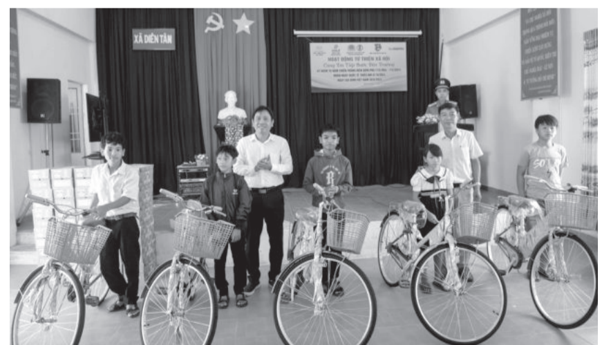
● Lãnh đạo Báo Khánh Hòa và xã Diên Tân trao tặng xe đạp cho học sinh.

Ngày 31-5, các đơn vị gồm: Phòng Quản lý xuất nhập cảnh, Công an tỉnh; Báo Khánh Hòa; Công ty TNHH Good Day Venaja; Công ty TNHH Thương mại và Du lịch Asia Tourist; Đoàn xã Diên Tân (huyện Diên Khánh) phối hợp tổ chức hoạt động "Cùng em tiếp