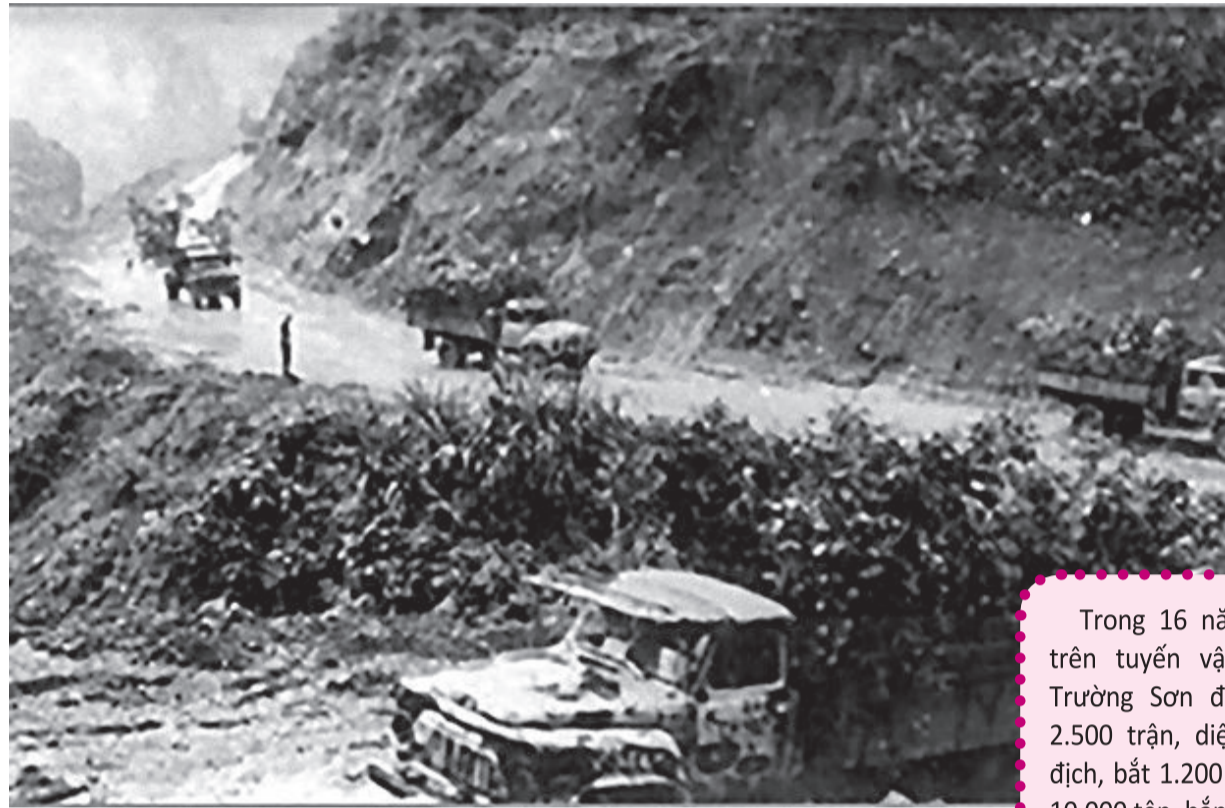
● Đường Hồ Chí Minh là một kỳ tích vĩ đại của dân tộc ta. (Ảnh tư liệu)

○ T.K (Theo tài liệu tuyên truyền của Ban Tuyên giáo Trung ương)