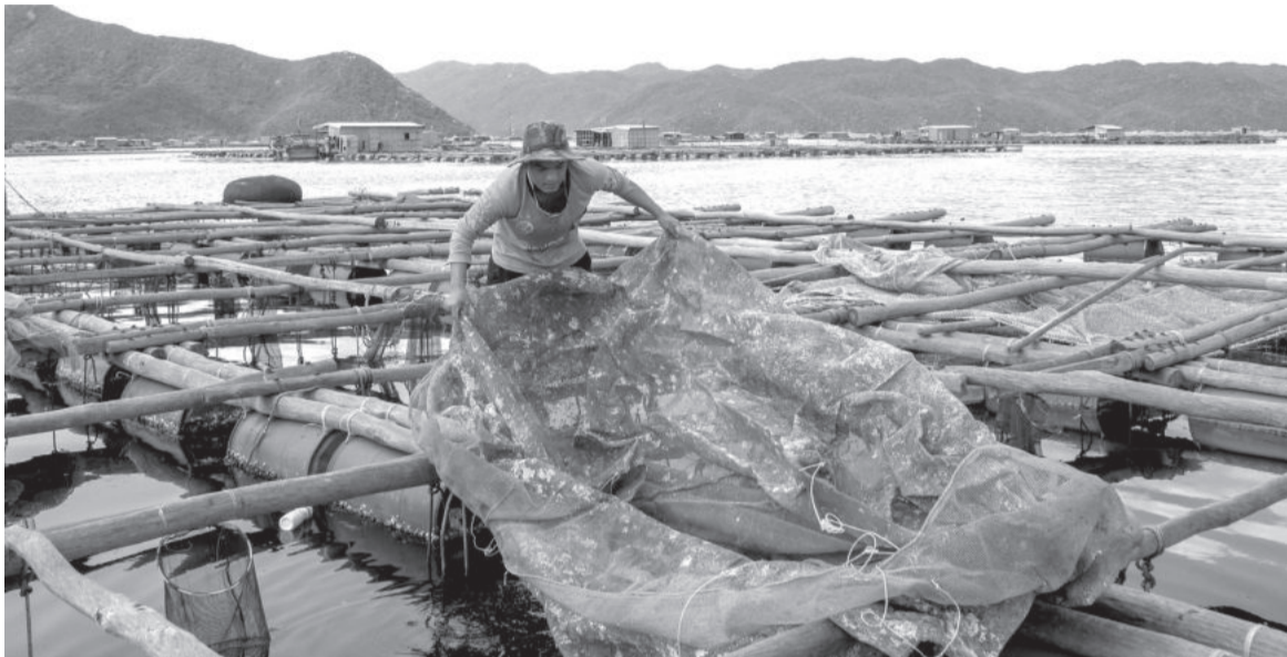
● Lao động trên các lồng bè nuôi tôm tại huyện Vạn Ninh.

Việc triển khai các dự án tại Khu Kinh tế (KKT) Vân Phong sẽ ảnh hưởng đến đời sống, sản xuất của người dân huyện Vạn Ninh, nhất là lao động làm nghề nuôi trồng, đánh bắt thủy sản. Do vậy, ngày 19-3, UBND tỉnh đã ban hành quyết định triển khai Đề án hỗ trợ đào tạo nghề, giải quyết việc làm cho lao động bị thu hồi đất thực hiện các dự án trên địa bàn huyện nhằm chuyển đổi nghề nghiệp, tạo việc làm ổn định cho người dân.