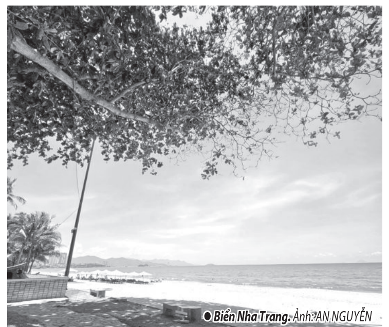
● Biển Nha Trang. Ảnh: AN NGUYỄN