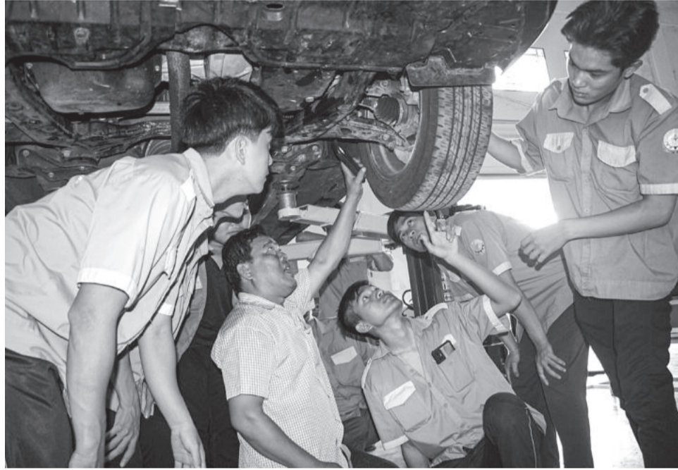
● Học sinh, sinh viên chăm chú học thực hành trên thiết bị.

Hiện nay, có 80% thời gian học tập của học sinh, sinh viên Trường Cao đẳng Kỹ thuật Công nghệ Nha Trang là thực hành trên thiết bị nên giúp học