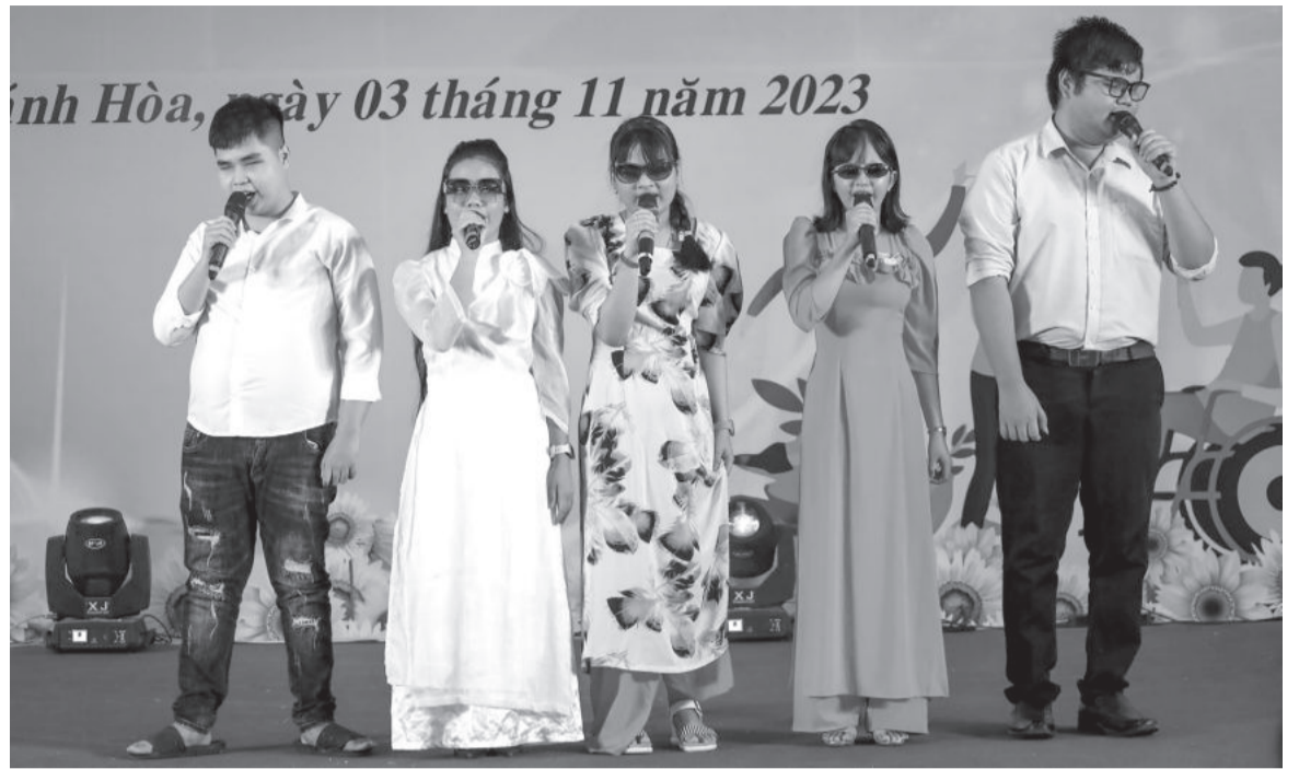
● Hội viên Hội Người mù thị xã Ninh Hòa tham gia đoàn nghệ thuật quần chúng người khuyết tật của thị xã biểu diễn tại Liên hoan "Tiếng hát từ trái tim" năm 2023.

Hội Người mù thị xã Ninh Hòa thành lập năm 1993, đến nay có 210 hội viên, trong đó có 30 hội viên được ăn, ở, làm việc tại trụ sở; 90% hội viên biết đọc, biết viết; nhiều hội viên được tạo việc làm, thu nhập 300.000 - 600.000 đồng/tháng. Nhiều năm liền, hội được Hội Người Khuyết tật Việt Nam, Hội Người mù Việt Nam, UBND tỉnh tặng bằng khen về thành tích xuất sắc trong công tác hội; hội cũng nhiều lần đạt giải thưởng trong các cuộc liên hoan, biểu diễn văn nghệ các cấp. Năm 2023, hội vận động các tổ chức, cá nhân tặng quà, hỗ trợ gần 1,3 tỷ đồng; vận động tổ chức 1 lớp dạy nghề xoa bóp, 2 khóa học chữ nổi Braille, 1 khóa học đàn và tặng 10 suất học bổng cho trẻ em mù, con em hội viên mù; duy trì nguồn vốn 85 triệu đồng cho 10 chị em hội viên vay luân phiên... Hội cũng đại diện cho đoàn nghệ thuật quần chúng thị xã Ninh Hòa tham gia liên hoan Tiếng hát từ trái tim dành cho người khuyết tật tỉnh và đạt 4 giải nhất, 1 giải nhì tiết mục; tham gia Liên hoan nghệ thuật quần chúng dành cho người khuyết tật lần thứ IX, đạt 1 giải nhất, 1 giải nhì tiết mục và giải nhất toàn đoàn.