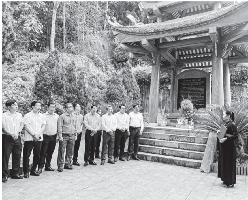
● Hướng dẫn viên giới thiệu với đoàn công tác về di tích Đồi Phong tướng.