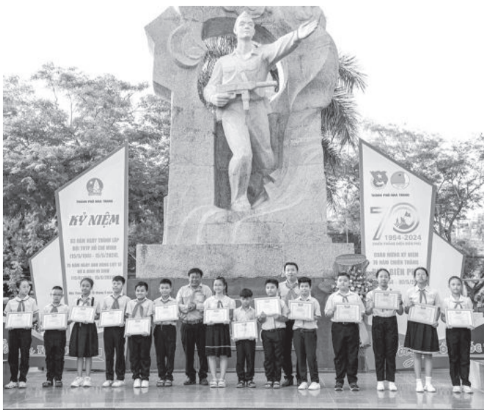
● Hội đồng Đội TP. Nha Trang khen thưởng các đội viên đạt thành tích cao trong các cuộc thi.