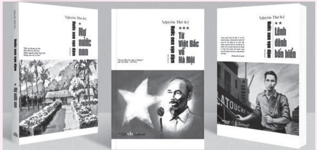
● Ba cuốn tiểu thuyết trong bộ “Nước non vạn dặm” đã xuất bản.