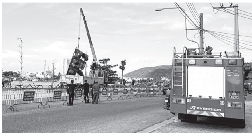
● UBND xã Phước Đông cưỡng chế các lồng bè nuôi trái phép ở vùng biển Hòn Rớ.

Từ ngày 13 đến 17-5, UBND xã Phước Đông (TP. Nha Trang) tổ chức cưỡng chế tháo dỡ các lồng, bè nổi nuôi thủy sản trái phép tại vùng nước thuộc khu vực Hòn Rớ, xã Phước Đông. Lãnh đạo UBND xã Phước Đông cho biết, theo kế hoạch cưỡng chế, hiện trạng vùng nước thuộc khu vực Hòn Rớ có 15 lồng, bè nổi xây dựng trái phép. Tuy nhiên, qua quá trình vận động, hiện nay chỉ còn 6 bè nổi không tự giác tháo dỡ.