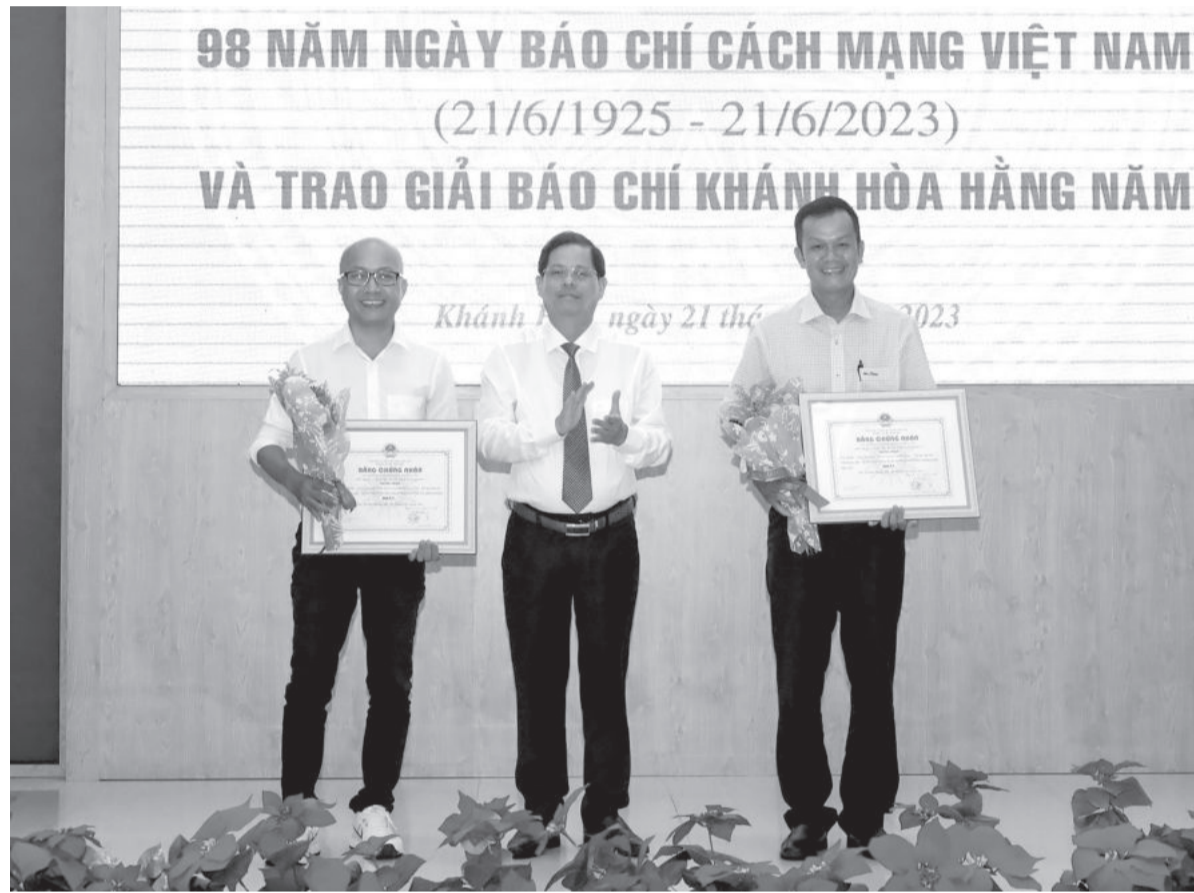
● Phóng viên Báo Khánh Hòa nhận giải nhất Giải báo chí tỉnh năm 2023.

năm 1951 đến 1975, tờ báo cách mạng của Tỉnh ủy Khánh Hòa lần lượt được đổi tên thành Thông tin, Gió mới, Giải phóng Khánh Hòa. Dù với tên gọi nào, những người làm báo cách mạng ở Khánh Hòa vẫn giữ vững ngọn lửa đấu tranh từ thời Báo Thăng.