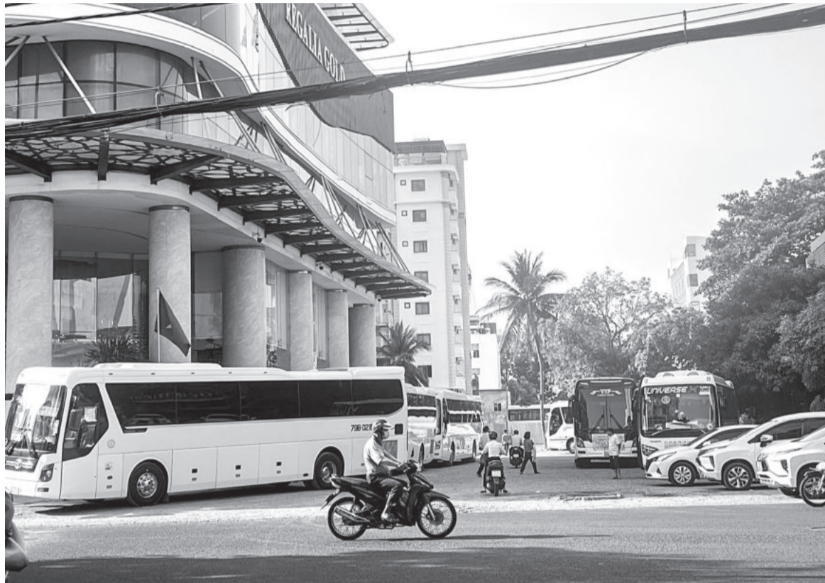
● Sau khi Báo Khánh Hòa phản ánh, tình trạng dừng, đỗ xe trái phép tại khu vực đường Tô Hiến Thành nổi dài vẫn diễn ra.

Theo báo cáo của Phòng Quản lý đô thị thành phố, hiện nay, khu vực đất trống đã giải tỏa nêu trên có các phương tiện ô tô khách, taxi dừng để đón, trả khách nên khi lưu thông ra, vào đường Nguyễn Thị Minh Khai gây ùn tắc giao thông tại nút giao đường Nguyễn Thị Minh Khai - Tô Hiến Thành. Mặt khác, ô tô trên 16 chỗ ra, vào Khách sạn Regalia Gold trên đường Nguyễn Thị Minh Khai đã ảnh hưởng đến giao thông tại khu vực này. Để ngăn chặn ô tô dừng, đỗ tại khu vực