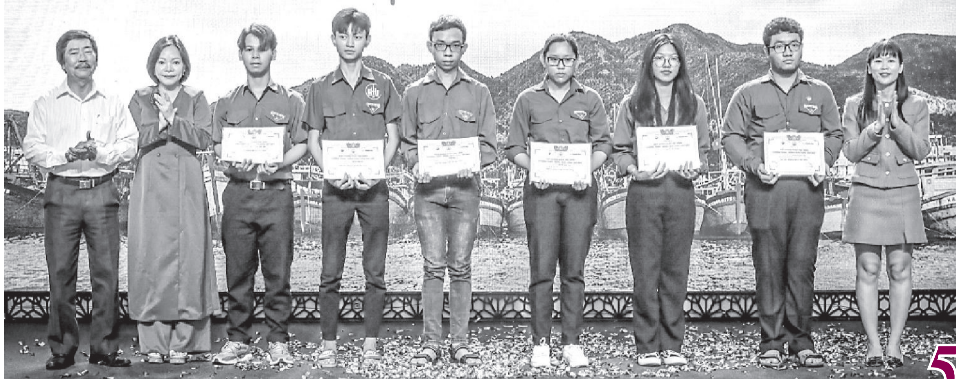
● Lãnh đạo Báo Khánh Hòa, Công ty Cổ phần Nước giải khát Yến sào Khánh Hòa, Hội Nghệ cá Khánh Hòa trao học bổng "Đồng hành cùng ngư dân" năm 2023.

CHƯƠNG TRÌNH TRAO HỌC BỔNG "ĐỒNG HÀNH CÙNG NGƯ DÂN"