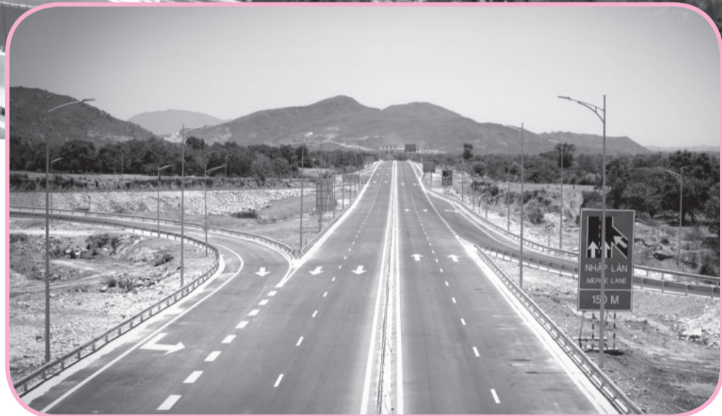
● Nút giao đường bộ cao tốc Cam Lâm - Vinh Hảo đoạn đi qua huyện Thuận Bắc, tỉnh Ninh Thuận.