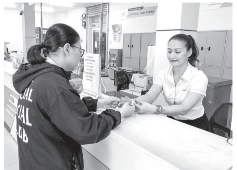
● Giao dịch viên Bưu điện TP. Nha Trang giới thiệu SIM Vinaphone cho khách hàng.

Cũng theo đại diện Trung tâm Kinh doanh VNPT - Khánh Hòa, nhiệm vụ quan trọng nhất