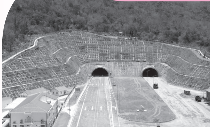
● Hầm núi Vung trên tuyến đường bộ cao tốc Cam Lâm - Vinh Hảo qua địa bàn huyện Thuận Nam, tỉnh Ninh Thuận.

Ngày 25-4, có mặt tại công trình đường bộ cao tốc Cam Lâm - Vinh Hảo, phóng viên ghi nhận toàn tuyến đã được xây dựng hoàn thiện; một vài nhóm công nhân đang vệ sinh lan can, lòng đường để sẵn sàng thông xe vào 7 giờ ngày 26-4.