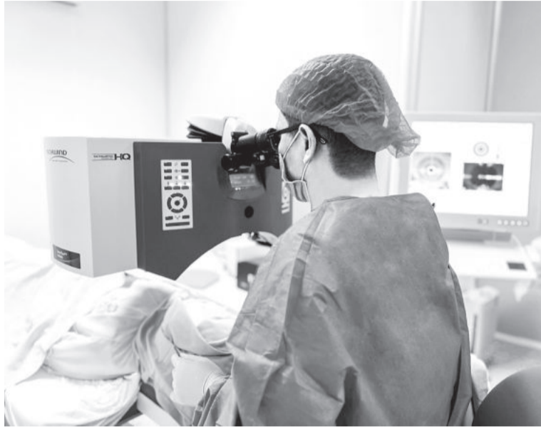
● Phẫu thuật xóa cận không chạm SmartSurFACE tại Bệnh viện Mắt Sài Gòn Nha Trang.

vào giác mạc, thời gian phục hồi nhanh. Sau mổ, tôi có thể nhanh chóng quay trở lại chơi những môn thể thao yêu thích mà không cần lo đến biến chứng, chấn thương về giác mạc. Thị lực của tôi cũng được cải thiện rất nhiều, bây giờ có thể nhìn rõ mọi thứ mà không cần đeo kính”.