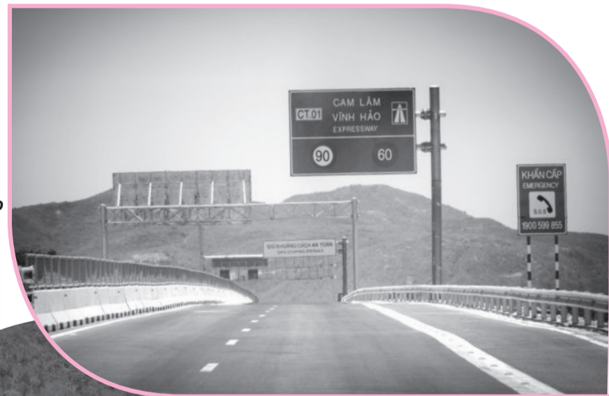
● Tuyến đường cao tốc Cam Lâm - Vinh Hảo dự kiến thông xe vào sáng 26-4.