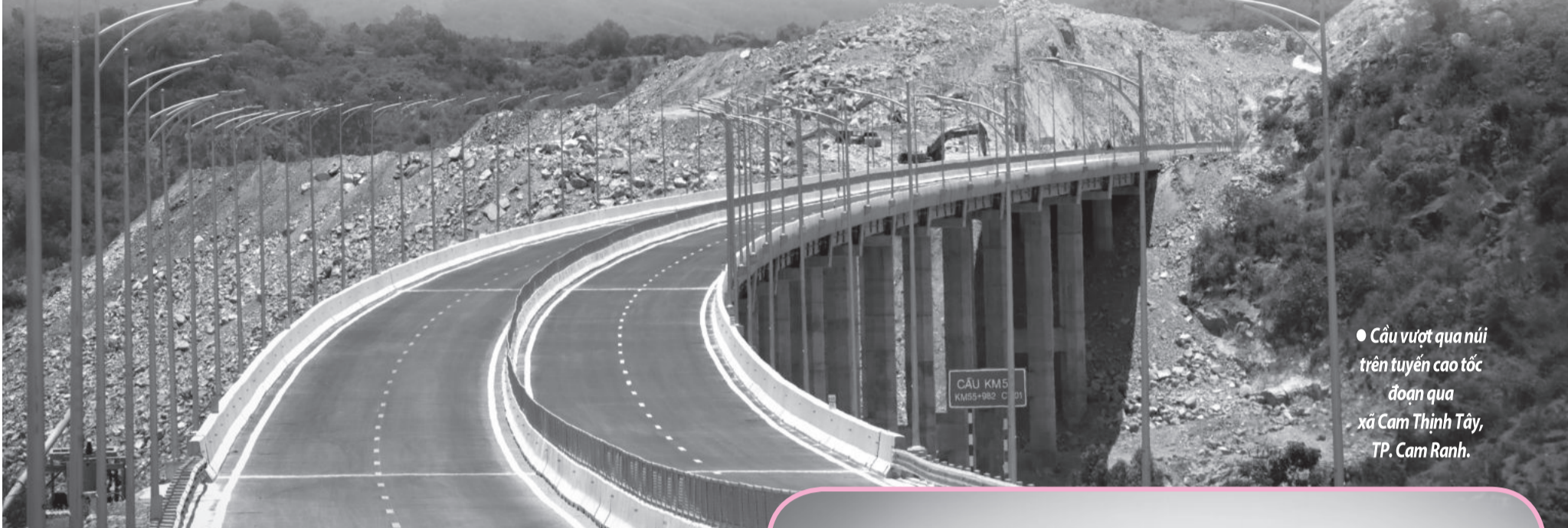
● Cầu vượt qua núi trên tuyến cao tốc đoạn qua xã Cam Thịnh Tây, TP. Cam Ranh.