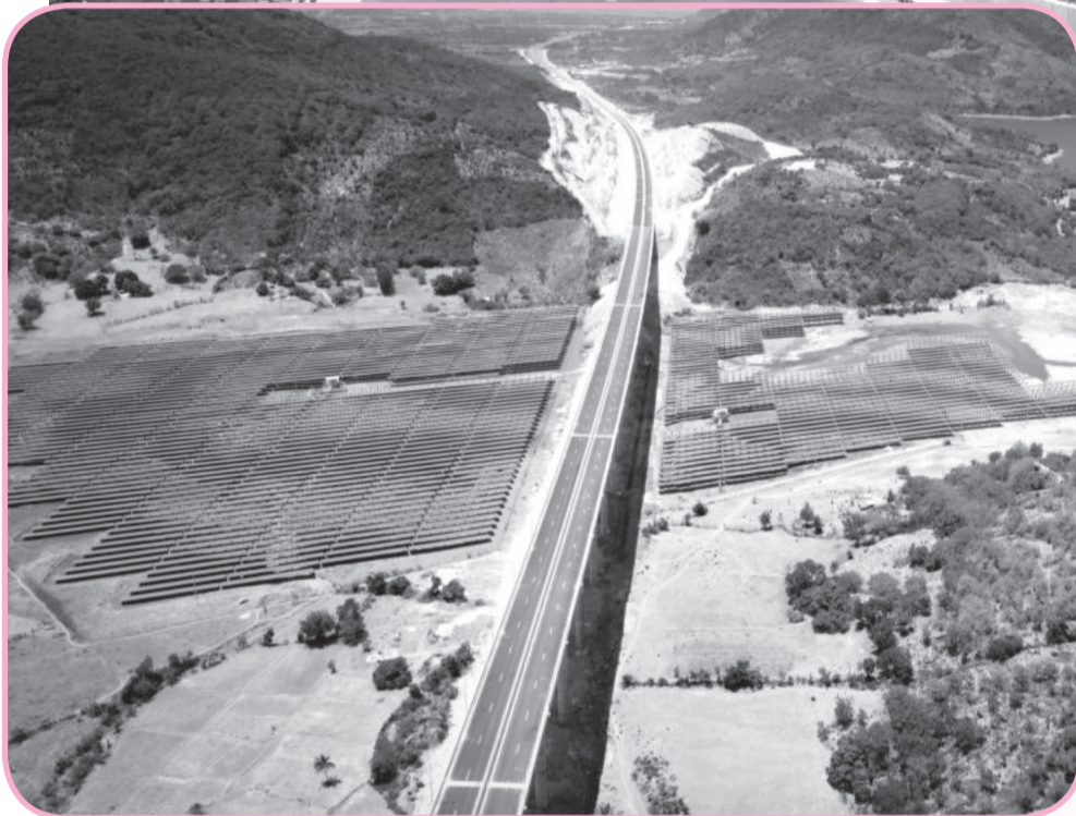
● Cầu trên cao tốc đoạn qua tỉnh Ninh Thuận.