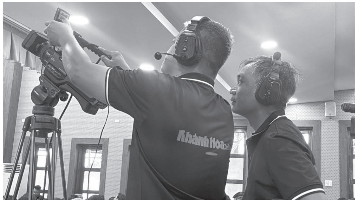
● Phóng viên tác nghiệp livestream tại Hội thảo “100 năm hành trình lịch sử: Nhận diện, phát huy các giá trị văn hóa, con người Nha Trang trong xây dựng, phát triển thành phố” do UBND TP. Nha Trang tổ chức.

tạo bạo khi ra Báo Khánh Hòa Chủ nhật. Tờ báo có 16 trang khổ 28 x 20cm với nhiều chuyên mục về kinh tế - xã hội, văn hóa - thể thao, an ninh - trật tự, truyện ngắn... được độc giả ủng hộ; có thời điểm, Báo Khánh Hòa Chủ nhật phát hành lên đến 8.000 - 10.000 tờ/kỳ. Mạng lưới phát hành mở rộng ở TP. Hồ Chí Minh, Đắk Lắk, Gia Lai, Phú Yên, Bình Định... Có thể