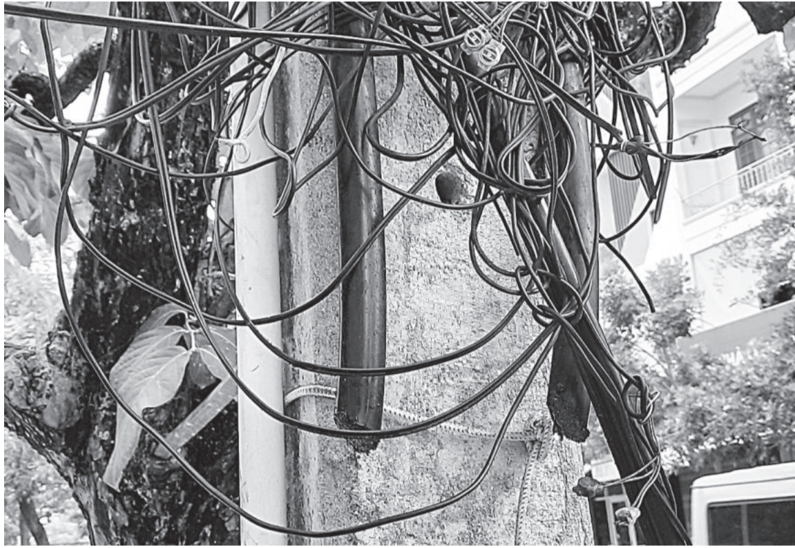
● 2 sợi cáp viễn thông trên tuyến cáp đường Hoàng Hoa Thám bị kẻ gian cắt trộm.

Sau một thời gian tạm lắng, gần đây, một số tuyến cáp viễn thông của Trung tâm Viễn thông Nha Trang (đơn vị trực thuộc Viễn thông Khánh Hòa) đã bị kẻ gian cắt trộm, phá hoại. Đơn vị đang tìm biện pháp để bảo vệ hạ tầng viễn thông - công nghệ thông tin nhằm đảm bảo thông tin liên lạc thông suốt phục vụ nhu cầu của khách hàng.