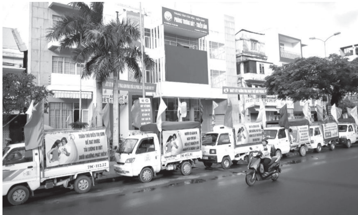
● Truyền thông phòng, chống HIV/AIDS tại TP. Nha Trang.

Nhờ có tình yêu thương, chia sẻ của người thân, cộng đồng, nhất là sự thấu hiểu, đồng hành của các cán bộ y tế đã tiếp thêm nghị lực cho những người có “H” vượt qua mặc cảm, kiên trì điều trị.