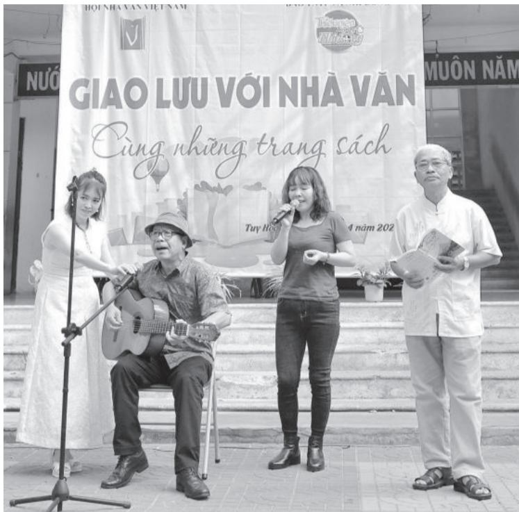
● Các nhà văn, nhà thơ tham dự trại sáng tác ở Phú Yên giao lưu với các em học sinh.

Có dịp dự một trại sáng tác cho thiếu nhi của Hội Nhà văn Việt Nam tổ chức ở Phú Yên vừa qua, có thể nhận thấy số cây bút trẻ rất ít, sau trại sáng tác chưa thấy xuất hiện tác phẩm nào chú ý. Điều đáng nói, số người viết dự