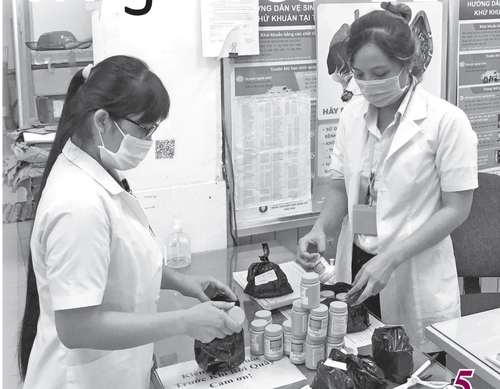
● Cán bộ y tế Phòng khám chuyên khoa HIV/AIDS và điều trị nghiện chất chuẩn bị thuốc ARV cho bệnh nhân.