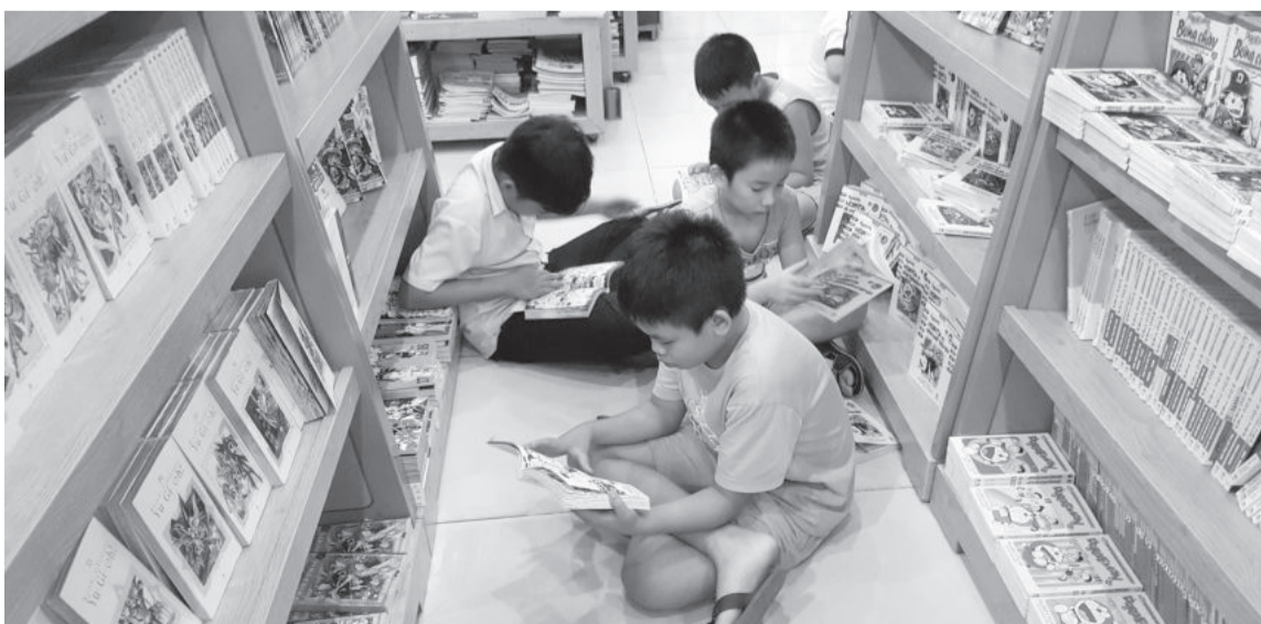
● Trẻ em đọc sách tại Nhà sách Phương Nam Nha Trang.