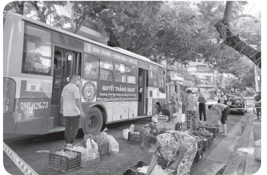
● Một điểm bán hàng lưu động bằng xe buýt thời dịch Covid-19 (tháng 9-2021).

Quán cà phê nào đang mở ca khúc Hoa sữa của Hồng Đăng: "Kỷ niệm ngày xưa vẫn còn đâu đó, những bạn bè xưa, những con đường nhỏ...". Kỷ