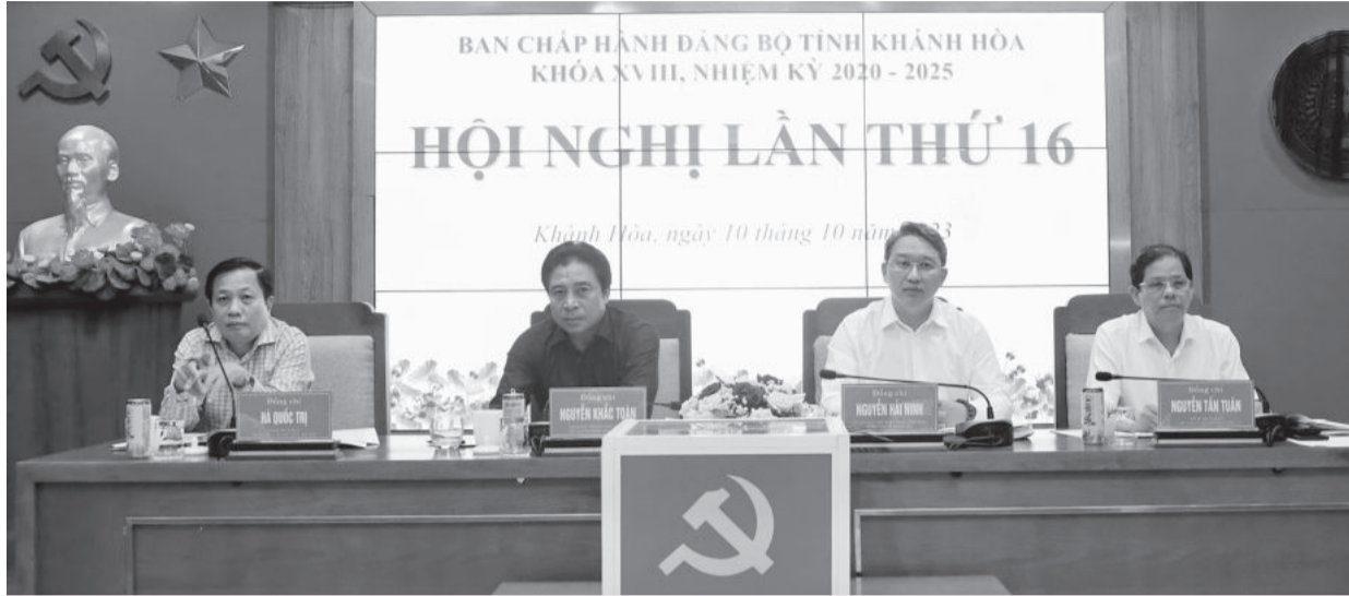
● Thường trực Tỉnh ủy chủ trì hội nghị.