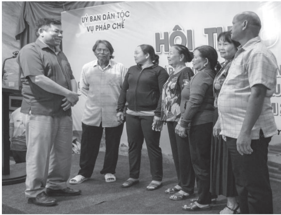
● Thứ trưởng, Phó Chủ nhiệm Ủy ban Dân tộc Y THÔNG (bìa trái) trao đổi với những người có uy tín trong đồng bào dân tộc thiểu số ở Khánh Hòa.

Ủy ban Dân tộc vừa tổ chức Hội thảo kinh nghiệm và giải pháp nâng cao chất lượng công tác phổ biến, giáo dục pháp luật (PBGDPL) cho đồng bào dân tộc thiểu số (ĐBDTTS) trong điều kiện mới khu vực Nam Trung Bộ năm 2023. Tại hội thảo, trên cơ sở đánh giá công tác PBGDPL cho ĐBDTTS thời gian qua, các đại biểu đã đưa ra nhiều giải pháp nhằm nâng cao chất lượng, hiệu quả công tác này thời gian tới.