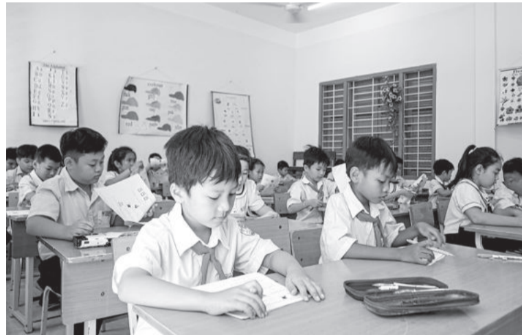
● Học sinh Trường Tiểu học Cam Linh (TP. Cam Ranh) trong giờ học Tiếng Anh.