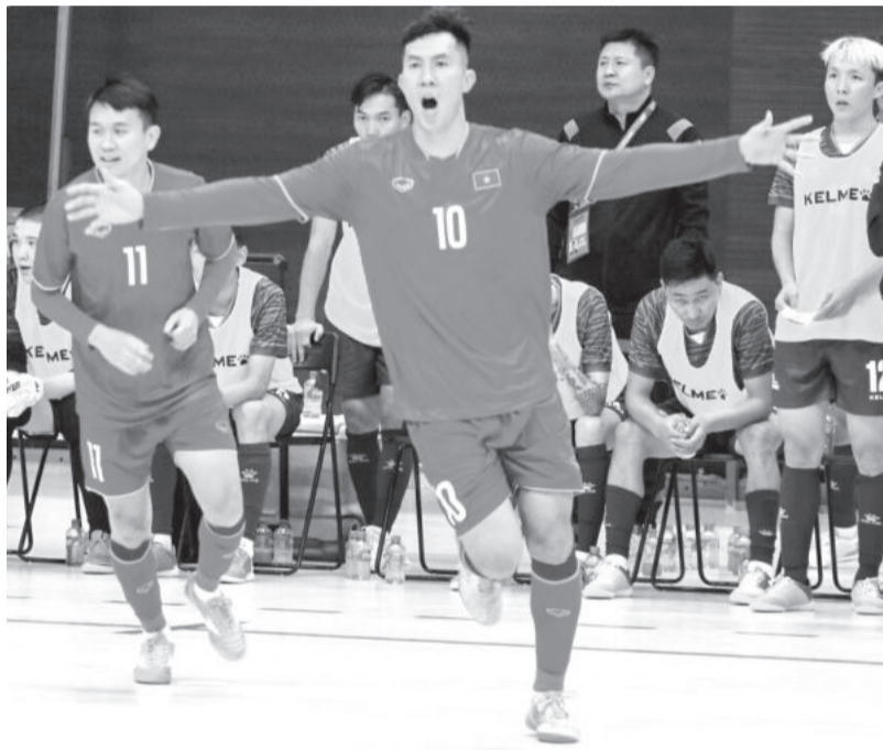
● Đội tuyển futsal Việt Nam chính thức giành vé vào vòng chung kết futsal châu Á 2024 sau 2 chiến thắng ở vòng loại bảng D tại Mông Cổ.

Sau 2 trận thắng liên tiếp trước Mông Cổ, Nepal lượt trận bảng D vòng loại giải futsal châu Á 2024 tại Mông Cổ (diễn ra từ ngày 7 đến 11-10), đội tuyển futsal Việt Nam sớm đoạt vé tham dự vòng chung kết cùng tham vọng lần thứ 3 góp mặt tại Vòng chung kết FIFA Futsal World Cup 2024.