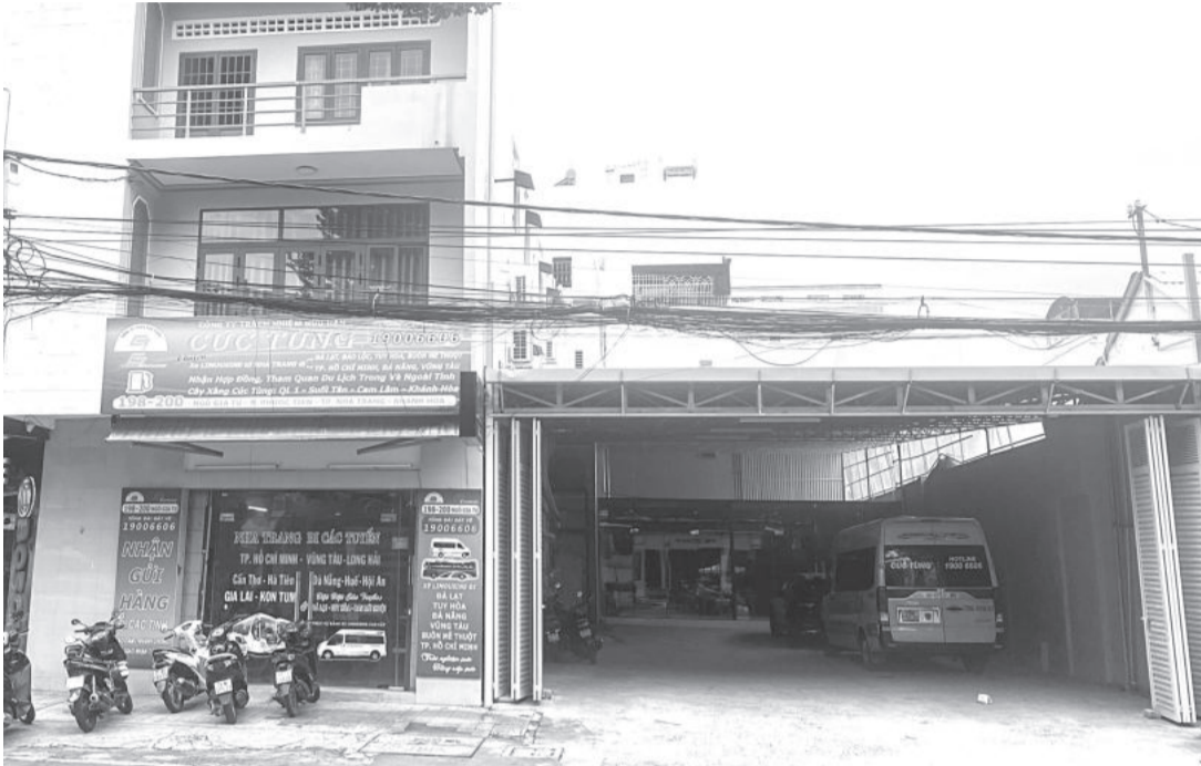
● Trụ sở Văn phòng đại diện Công ty TNHH Cúc Tùng tại số 198 đường Ngô Gia Tự, TP. Nha Trang.

Lãnh đạo Công ty TNHH Cúc Tùng (Văn phòng đại diện tại số 198 đường Ngô Gia Tự, TP. Nha Trang) vừa có báo cáo cho cơ quan chức năng về việc giải quyết nợ 4 tháng tiền lương năm 2021 (từ tháng 2 đến tháng 5-2021) của 6 người lao động đã có đơn gửi các cơ quan chức năng.