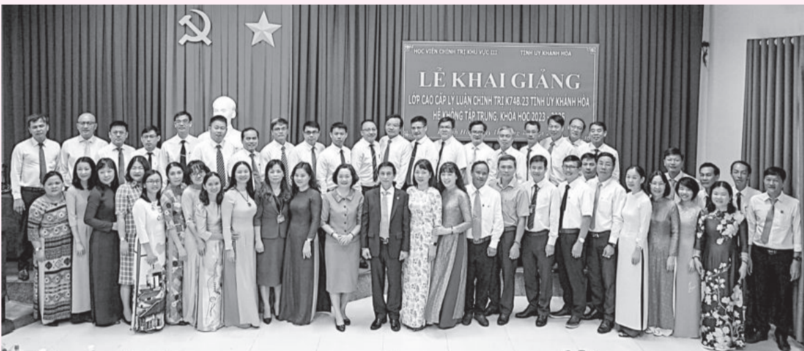
● Lãnh đạo các đơn vị chụp ảnh lưu niệm cùng các học viên.

Ngày 10-10, Học viện Chính trị khu vực III phối hợp với Trường Chính trị tỉnh tổ chức lễ khai giảng lớp cao cấp lý luận chính trị K74B.23 Tỉnh ủy Khánh Hòa hệ không tập trung, khóa học 2023 - 2025.