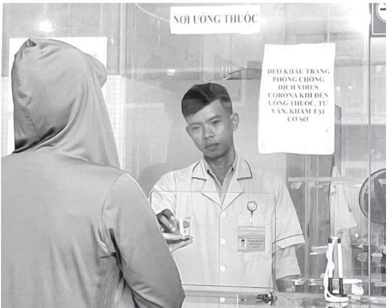
● Phát thuốc Methadone cho bệnh nhân tại Cơ sở điều trị Methadone thị xã Ninh Hòa.

6 tháng đầu năm 2023, toàn tỉnh phát hiện mới 67 ca dương tính với HIV, tăng 8 ca so với cùng kỳ năm 2022. Các cơ sở y tế đã tư vấn, xét nghiệm HIV cho 21.000 lượt người; điều trị nghiện các dạng thuốc phiện bằng Methadone cho 1.330 lượt người; điều trị PrEP cho 275 người. Số người nhiễm HIV còn sống và được quản lý tại địa phương là 1.517 người; trong đó 1.274 người được điều trị bằng thuốc ARV có thể bảo hiểm y tế, chiếm 94,5%. 100% phụ nữ mang thai nhiễm HIV được điều trị dự phòng lây truyền cho con. Các cơ sở y tế đã hoàn thành ký hợp đồng khám, chữa bệnh bảo hiểm y tế cho người nhiễm HIV.