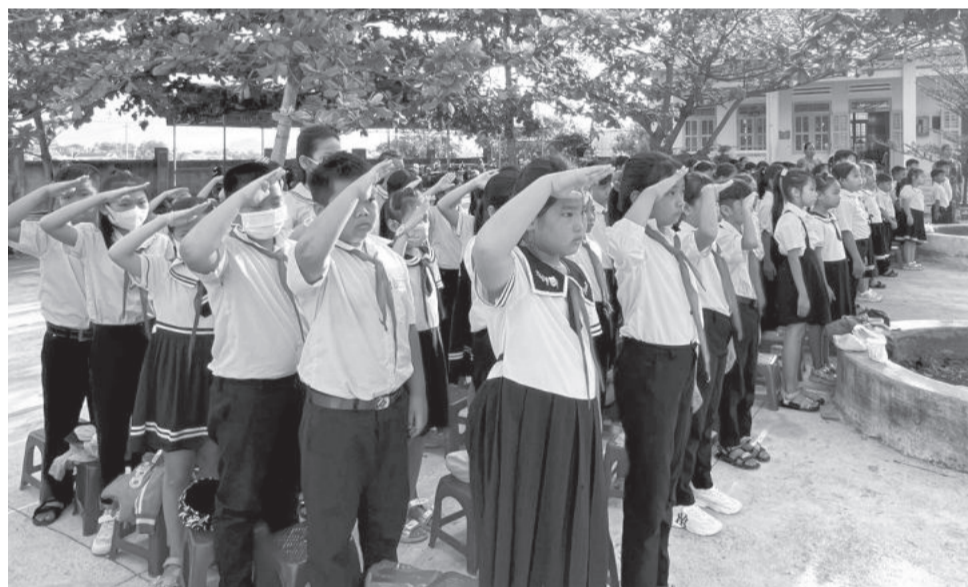
● Các trường tiểu học: Vạn Phú 1, Vạn Phú 2, Vạn Phú 3 (huyện Vạn Ninh) đã được sáp nhập thành Trường Tiểu học Vạn Phú từ ngày 15-8. Trong ảnh: Học sinh tại điểm trường Tiểu học Vạn Phú 1.

- Theo kế hoạch, sau khi thực hiện sắp xếp, đến năm học 2025 - 2026, mạng lưới cơ sở giáo dục công lập theo địa bàn tỉnh dự kiến giảm 66 trường trên tổng số 491 trường, đạt 13,4%. Cụ thể, đối với các đơn vị sự nghiệp trực thuộc Sở GD-ĐT, giữ nguyên các trường THPT, Trường Phổ thông Dân tộc nội trú tỉnh; giảm 2 trung tâm cấp tỉnh (Trung tâm Kỹ thuật tổng hợp - Hướng nghiệp Nha Trang, Trung tâm Giáo dục thường xuyên Nha