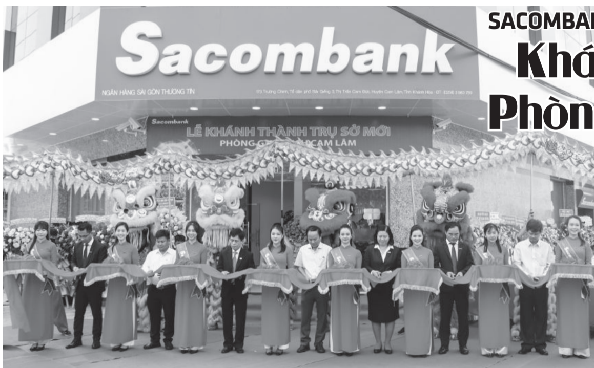
● Các đại biểu cắt băng khánh thành trụ sở mới của Phòng giao dịch Sacombank Cam Lâm.