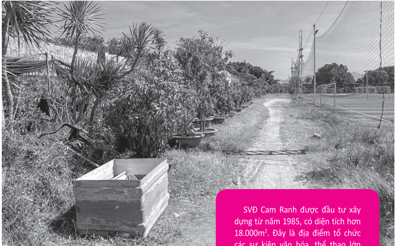
● Công ty TNHH Thanh niên Cam Ranh không thực hiện đầu tư, nâng cấp Sân vận động Cam Ranh theo đúng hợp đồng.