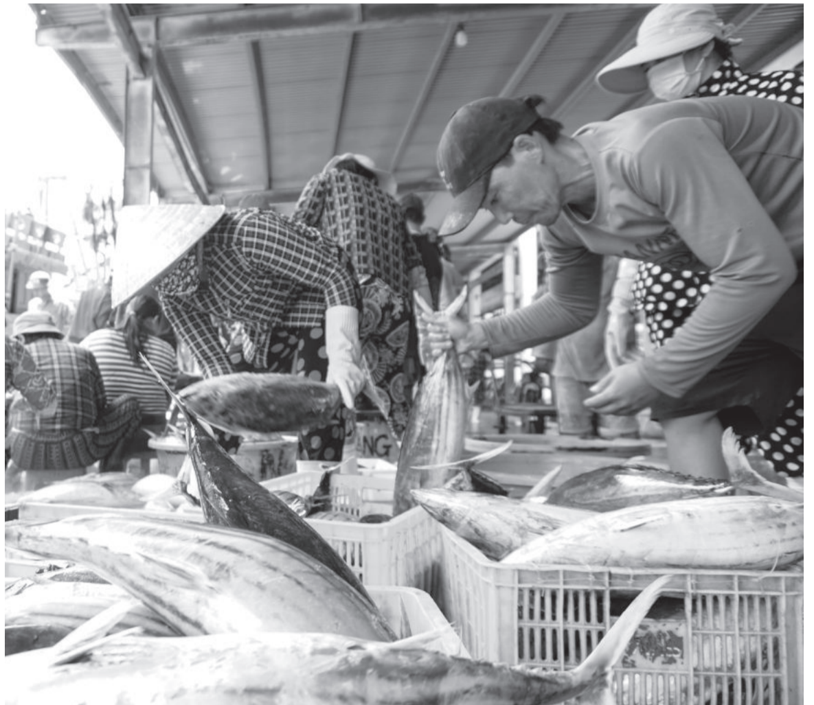
● Hải sản khai thác được bốc dỡ tại cảng Hòn Rớ (TP. Nha Trang).

Để thực hiện hiệu quả công tác truy xuất nguồn gốc hải sản khai thác, bên cạnh việc tổ chức đoàn kiểm tra, rà soát hồ sơ tại