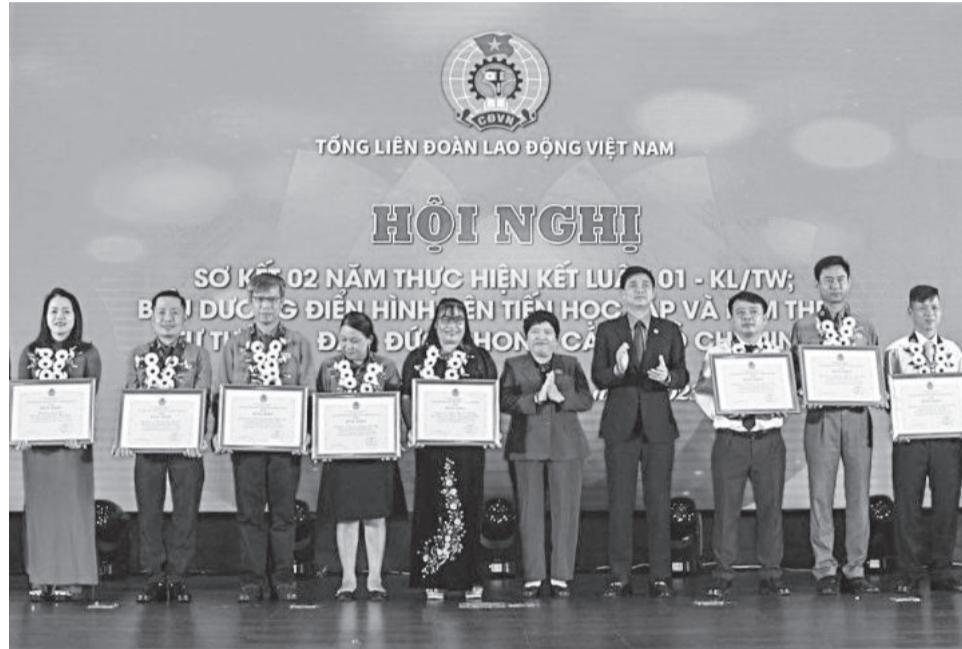
● Đại diện Công đoàn cơ sở Sở Lao động - Thương binh và Xã hội (thứ 3 từ trái sang) nhận bằng khen của Tổng Liên đoàn Lao động Việt Nam về học tập và làm theo tư tưởng, đạo đức, phong cách Hồ Chí Minh.

làm, các cơ sở giáo dục nghề nghiệp đã động viên CB-CC-VC tích cực tham gia công tác tư vấn, tuyển sinh; trực tiếp đến các trường THCS, THPT trên địa bàn để tư vấn học nghề, lập nghiệp; tư vấn qua các cuộc họp thôn, tổ dân phố; đồng thời tích cực xây dựng mối liên kết với các doanh nghiệp trong đào tạo. Nhờ đó, năm 2022, toàn tỉnh đã tuyển sinh và đào tạo nghề cho hơn 29.000 người; từ đầu năm 2023 đến nay, tuyển sinh, đào tạo nghề cho hơn 22.500 người.