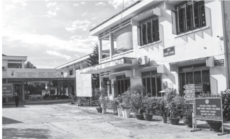
● Tại Bệnh viện Lao và Bệnh phổi tỉnh đặt nhiều biển báo cấm hút thuốc lá.

shisha và các sản phẩm thuốc lá mới khác trong cộng đồng.