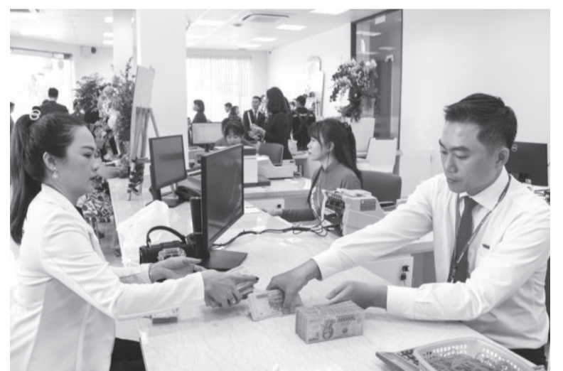
● Khách hàng giao dịch tại trụ sở mới của Phòng giao dịch Sacombank Cam Lâm.

hệ thống Sacombank; dịch vụ quản lý tiền mặt, ví điện tử, tư vấn tài chính, bảo quản tài sản; kinh doanh, cung ứng các dịch vụ ngoại hối trong nước và quốc tế; lưu ký chứng khoán, sản phẩm phát sinh giá cả hàng hóa và các dịch vụ ngân hàng khác trong khuôn khổ được phép hoạt động của Sacombank.