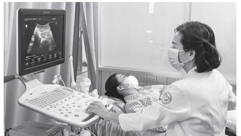
● Bác sĩ Trung tâm Chăm sóc sức khỏe sinh sản tỉnh siêu âm kiểm tra sức khỏe cho bệnh nhân.