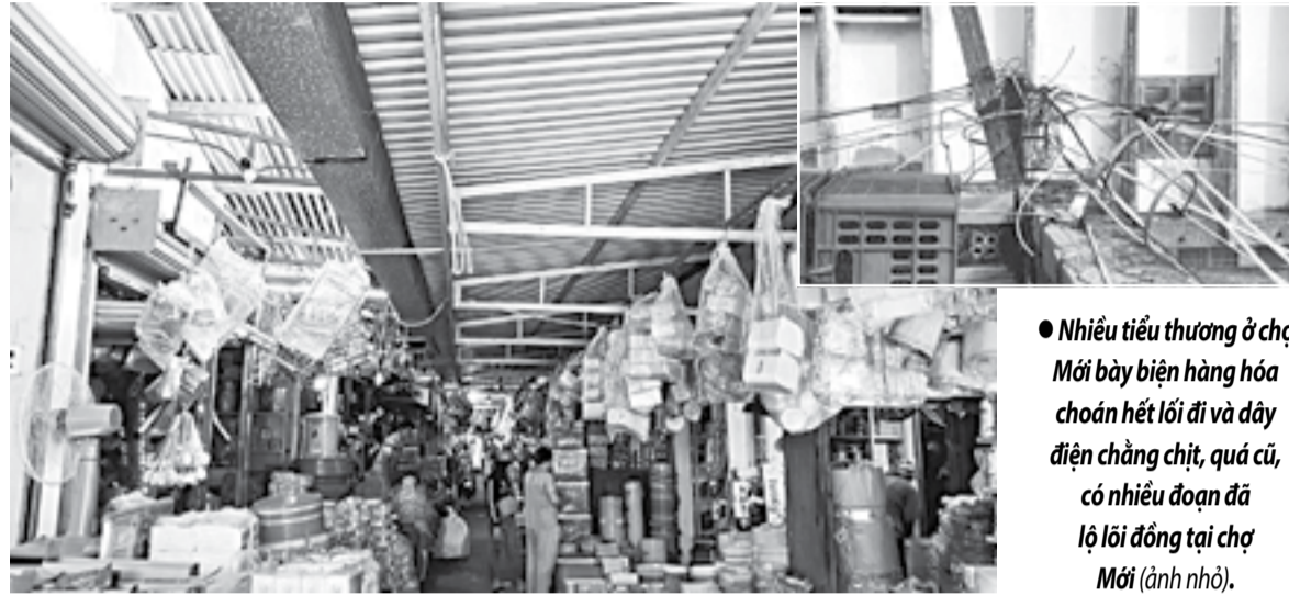
● Nhiều tiểu thương ở chợ Mới bày biện hàng hóa choán hết lối đi và dây điện chằng chịt, quá cũ, có nhiều đoạn đã lộ lõi đồng tại chợ Mới (ảnh nhỏ).

Mới đây, một sạp bán đồ gia dụng trong chợ Mới (phường Cam Thuận, TP. Cam Ranh) đã bị hỏa hoạn thiêu rụi do chập điện. Tuy vụ cháy đã được lực lượng tại chỗ sớm dập tắt, ngăn chặn cháy lan sang các sạp lân cận, nhưng mối lo hỏa hoạn vẫn đang thường trực đối với các tiểu thương kinh doanh tại chợ.