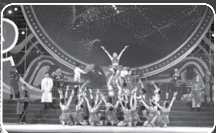
● Tiết mục biểu diễn mang màu sắc dân tộc của Đoàn Ca múa nhạc Hải Đăng trong đêm ca nhạc Âm vang đại dương.