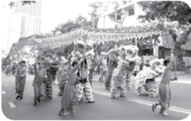
● Biểu diễn lân - sư - rồng trên đường phố.