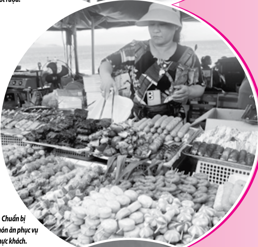
● Chuẩn bị món ăn phục vụ thực khách.