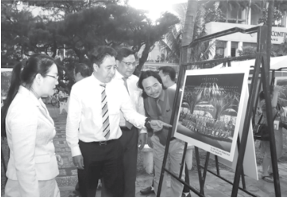
● Đây là kỳ Festival Biển có tới 9 hoạt động triển lãm. Trong ảnh: Các đại biểu xem tác phẩm tại triển lãm mỹ thuật, nhiếp ảnh do Hội Văn học Nghệ thuật tỉnh tổ chức.