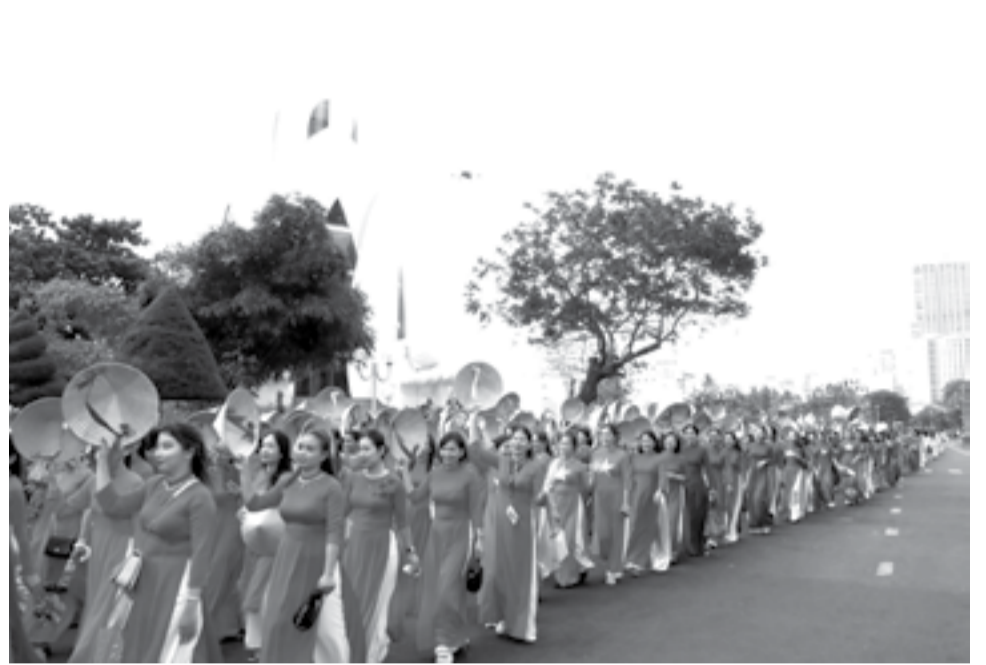
● Với sự tham gia của hơn 6.000 chị em, màn diễu hành áo dài xuống phố do Hội Liên hiệp Phụ nữ tỉnh tổ chức đã được đăng ký Kỷ lục Việt Nam.