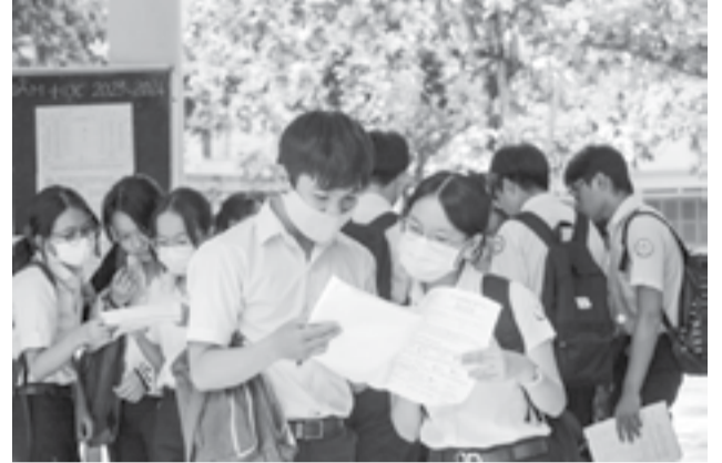
● Trao đổi về đề thi Tiếng Anh tại Trường THPT Nguyễn Văn Trỗi (TP. Nha Trang).