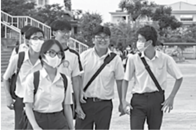
● Các thí sinh dự thi vào Trường THPT Chuyên Lê Quý Đôn.

Ngày 6-6, các thí sinh tham dự Kỳ thi vào lớp 10 THPT công lập trên địa bàn tỉnh năm học 2023 - 2024 hoàn thành môn thi cuối cùng là Tiếng Anh, riêng thí sinh thi vào Trường THPT Chuyên Lê Quý Đôn (TP. Nha Trang) dự thi thêm môn chuyên. Theo kế hoạch của Sở Giáo dục và Đào tạo, kết quả thi sẽ được công bố vào ngày 19-6.