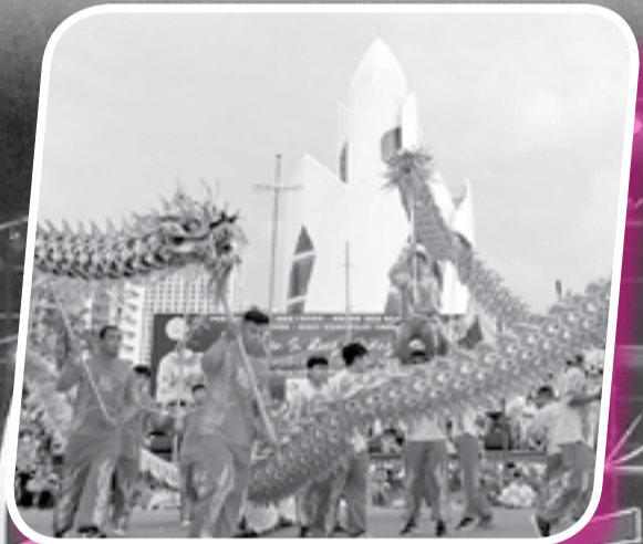
● Biểu diễn lân - sư - rồng trên đường phố.