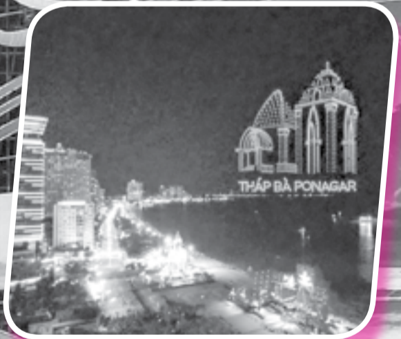
● Màn trình diễn ánh sáng nghệ thuật của 1.653 drone là điểm nhấn ấn tượng nhất của kỳ Festival Biển lần thứ 10.