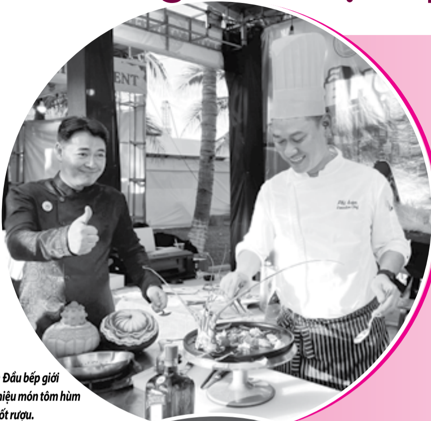
● Đầu bếp giới thiệu món tôm hùm đốt rượu.