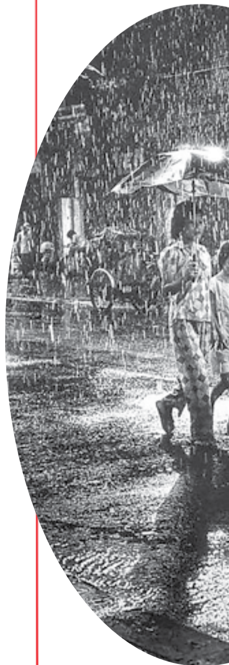
• Dưới cơn mưa.