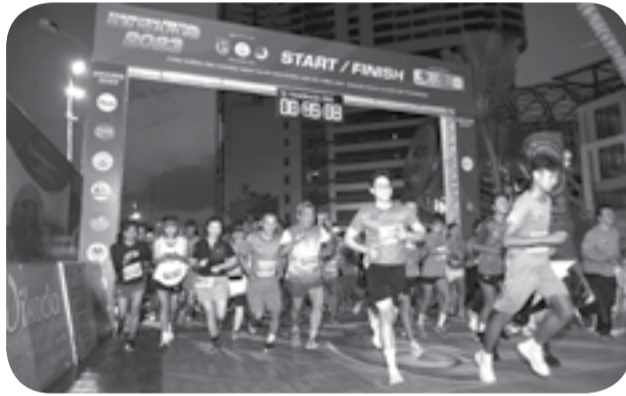
● Trong kỳ Festival Biển 2023, lần đầu tiên Tỉnh đoàn tổ chức giải Marathon "Run to Future" thu hút hơn 3.700 người tham gia.