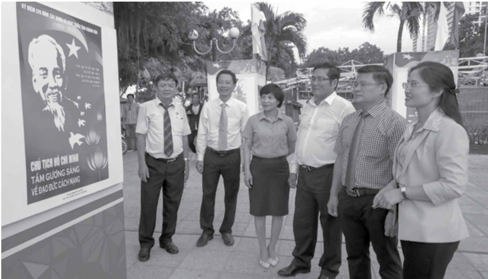
• Các đại biểu xem tác phẩm được giới thiệu tại triển lãm.

Từ ngày 2 đến 6-6, tại khu vực Công viên Phù Đổng (TP. Nha Trang), Sở Văn hóa và Thể thao tổ chức triển lãm tranh cổ động tuyên truyền kỷ niệm 370 năm xây dựng và phát triển tỉnh Khánh Hòa và chương trình Festival Biển Nha Trang - Khánh Hòa 2023. Những tác phẩm được trưng bày, giới thiệu tại triển lãm đã truyền đi thông điệp và mong ước về một tương lai phát triển của xứ Trầm Hương.