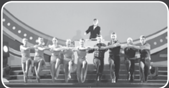
● Festival Biển 2023 đã chào đón sự tham gia biểu diễn của một số đoàn nghệ thuật nước ngoài. Trong ảnh: Các nghệ sĩ người Nga biểu diễn trong chương trình Âm vang đại dương.