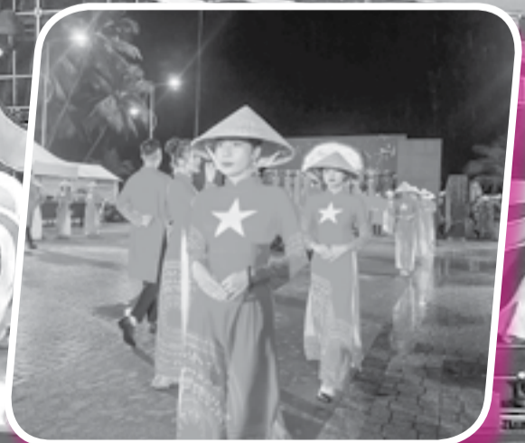
● Trình diễn tại lễ hội áo dài.