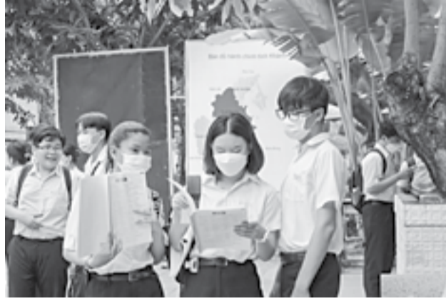
● Thí sinh dự thi tại Trường THPT Lý Tự Trọng (TP. Nha Trang) xem lại bài trước giờ thi môn Tiếng Anh.