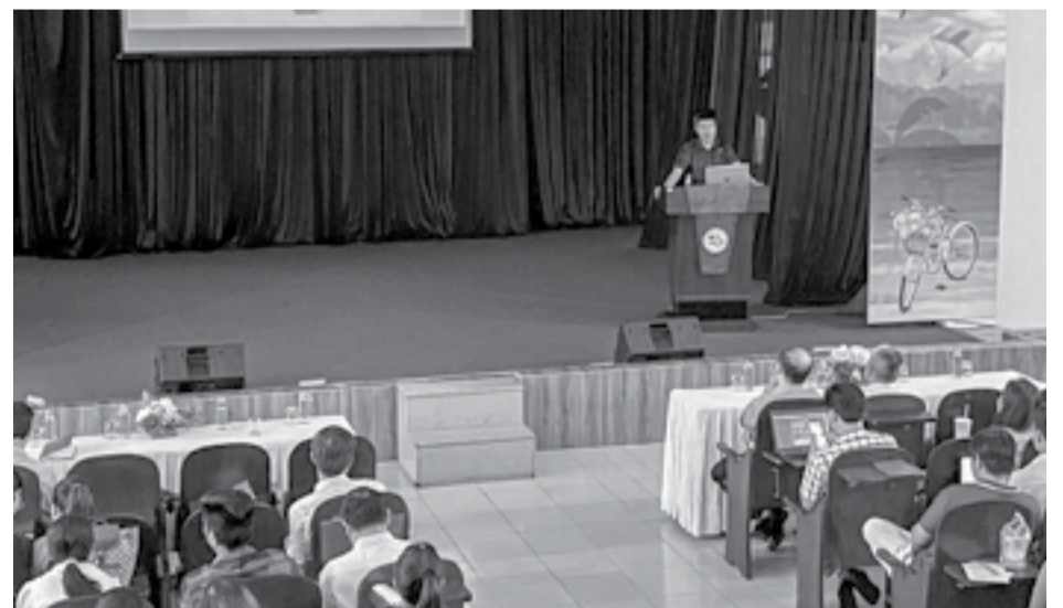
● Quang cảnh buổi tập huấn.