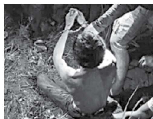
● Hưng bị bắt tại khu vực đồi núi, gần một trường học ở xã Diên Lâm.