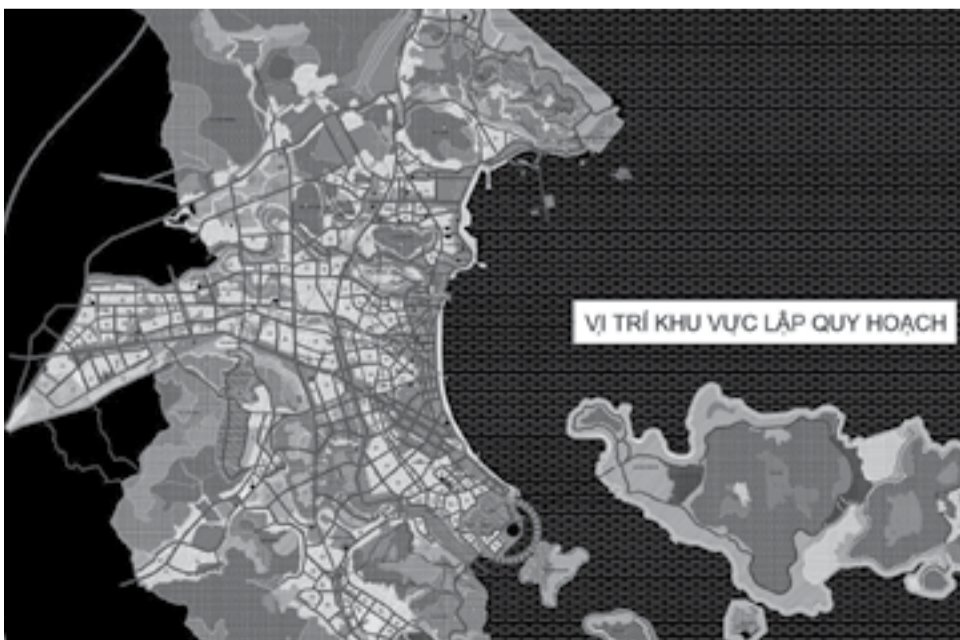
● Khu vực lập điều chỉnh quy hoạch.