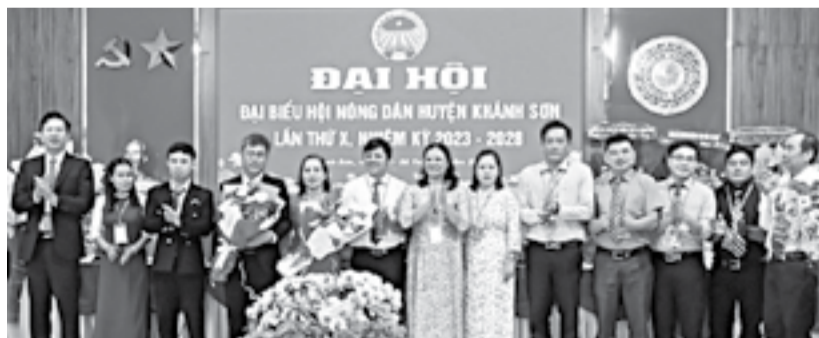
● Ban Chấp hành Hội Nông dân huyện Khánh Sơn khóa X ra mắt đại hội.

Nhiệm kỳ 2018 - 2023, Hội Nông dân huyện đã kết nạp hơn 1.600 hội viên mới. Các cơ sở hội đã thành lập 2 hợp tác xã sản xuất nông nghiệp, 13 tổ hợp tác sản xuất, kinh doanh; tạo điều kiện cho hội viên, nông dân vay hơn 11 tỷ đồng từ Ngân hàng Chính sách xã hội và nguồn Quỹ Hỗ trợ nông dân để đầu tư phát triển sản xuất, kinh doanh; hỗ trợ nông dân mua hàng trăm tấn phân bón theo hình thức trả chậm, tiêu thụ hơn 800 tấn nông sản. Qua bình xét, có hơn 14.800 lượt hộ đạt danh hiệu nông dân sản xuất, kinh doanh giỏi các cấp. Ngoài ra, các cơ sở hội đã huy động hơn 1.160 ngày công lao động tham gia tu sửa 112km