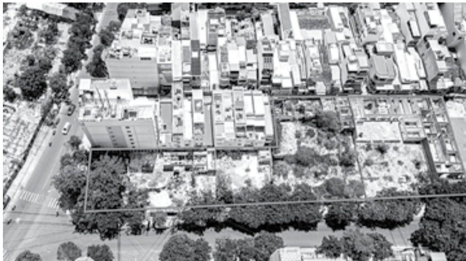
● Khu đất tại 310 Nguyễn Tri Phương được UBND TP. Nha Trang đề xuất giữ lại để xây dựng trường học.

UBND TP. Nha Trang vừa có báo cáo gửi UBND tỉnh, Sở Tài chính, Sở Kế hoạch và Đầu tư, Sở Tài nguyên và Môi trường, Sở Xây dựng về rà soát các cơ sở nhà, đất để đưa vào kế hoạch bán đấu giá quyền sử dụng đất trên địa bàn TP. Nha Trang.