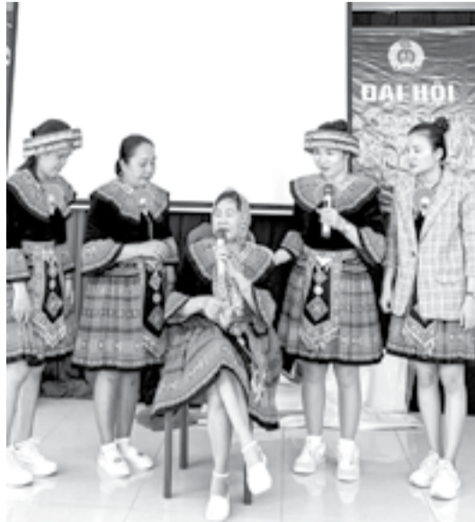
● Phần thi sân khấu hóa của đội Ninh Hòa.

Ngày 6-6, Chi cục Dân số - Kế hoạch hóa gia đình tổ chức Hội thi chất lượng dân số - trách nhiệm giống nòi. Hội thi thu hút hơn 80 cán bộ chuyên trách dân số, cộng tác viên câu lạc bộ tiền hôn nhân của 4 địa phương: Cam Lâm, Khánh Sơn, Khánh Vĩnh, Ninh Hòa tham gia.