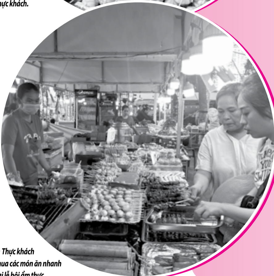
● Thực khách mua các món ăn nhanh tại lễ hội ẩm thực.

Diễn ra trong 5 ngày (từ ngày 2 đến 6-6), Lễ hội ẩm thực Festival Biển Nha Trang - Khánh Hòa 2023 đã thành công hơn cả mong đợi. 90 gian hàng ẩm thực, du lịch cùng những màn trình diễn của nghệ nhân giới thiệu món ngon 3 miền đã tạo nên một lễ hội ẩm thực đúng nghĩa, đáp ứng nhu cầu ăn uống, giải trí của người dân và du khách.