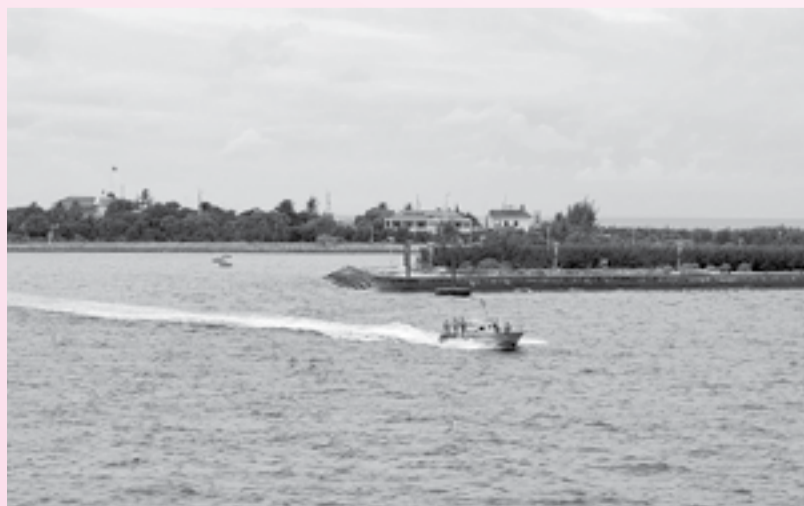
● Ảnh: TẠ LONG