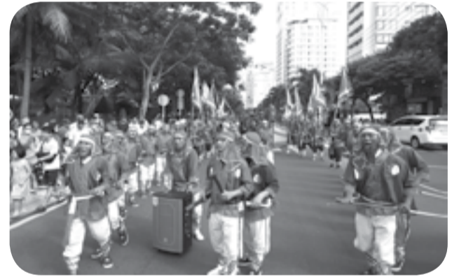
● Rộn ràng Lễ hội cầu ngư.