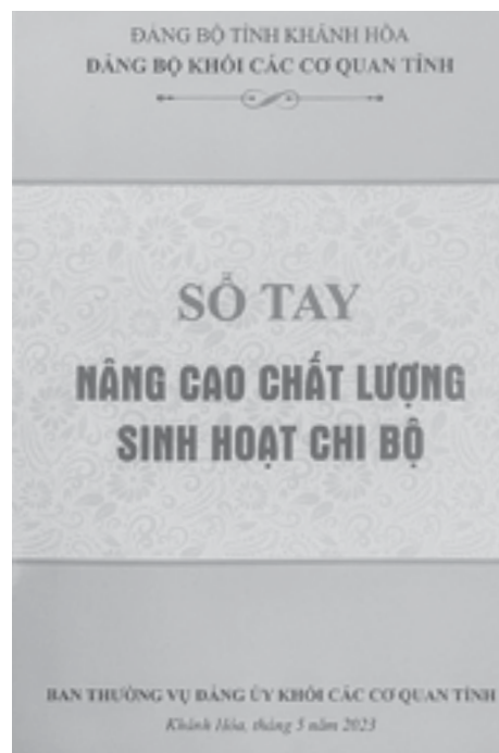
● Bìa sổ tay.

Đảng bộ Khối các cơ quan tỉnh có 67 tổ chức cơ sở đảng trực thuộc, hoạt động trong các cơ quan tham mưu của Đảng, Nhà nước, Mặt trận Tổ quốc và đoàn thể chính trị xã hội của tỉnh. Đảng bộ Khối các cơ quan tỉnh có 6 loại hình tổ chức cơ sở đảng, trong đó có 58/67 (86,56%) đơn vị tổ chức cơ sở đảng hoạt động trong cơ quan hành chính, đơn vị sự nghiệp; các tổ chức cơ sở đảng còn lại chiếm 13,44% thuộc các loại hình cơ quan báo chí, hội quần chúng, trường học ngoài công lập.