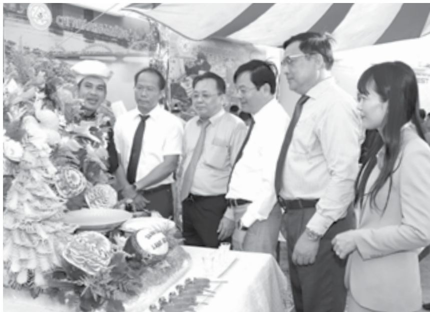
● Các đồng chí lãnh đạo tỉnh thăm khu vực dự thi ẩm thực.