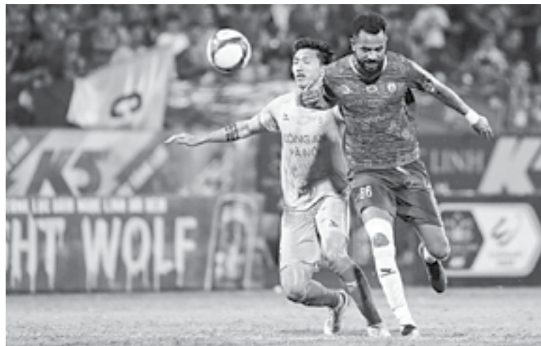
● Cầu thủ Khánh Hòa FC (bên phải) trong trận hòa không bàn thắng khi gặp đội Công an Hà Nội.