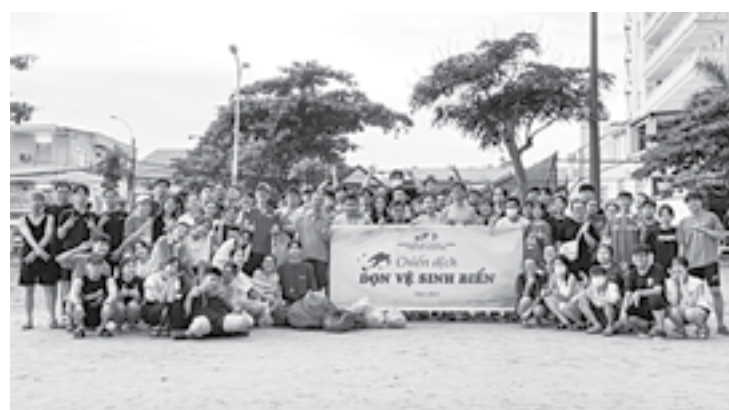
● Các đoàn viên, thanh niên tham gia vệ sinh bờ biển.

● Đoàn trường Đại học Tôn Đức Thắng - Phân hiệu Khánh Hòa vừa tổ chức hoạt động "Dọn vệ sinh biển" năm 2023 hưởng ứng Ngày Môi trường thế giới và Ngày Đại dương thế giới. Hơn 100 đoàn viên, thanh niên của trường đã tham gia thu gom rác thải trên bãi biển khu vực Hòn Chông, phân loại rác và bàn giao cho các đơn vị xử lý. (Vĩnh Thành)