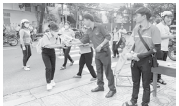
● Hoạt động tiếp sức tại điểm thi Trường THPT Lý Tự Trọng.

● Ngày 5-6, Thành đoàn Nha Trang tổ chức hoạt động tiếp sức kỳ thi tuyển sinh vào lớp 10 năm 2023. Thành đoàn và các đoàn cơ sở đã triển khai 9 điểm tiếp sức tại các điểm thi trên địa bàn thành phố. Các đoàn viên, thanh niên, tình nguyện viên tại các điểm tiếp sức tham gia hỗ trợ nước uống miễn phí cho học sinh; hỗ trợ những trường hợp thí sinh cần được giúp đỡ... Hoạt động tiếp sức diễn ra đến khi kỳ thi kết thúc. (V.Thành)