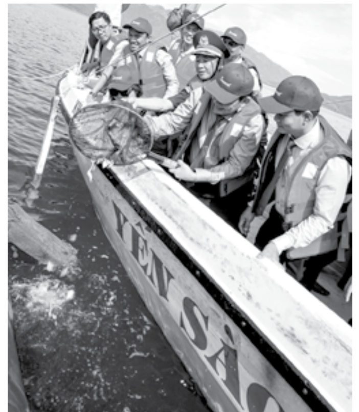
● Lãnh đạo Công ty Yến sào Khánh Hòa thả giống cá biển tái tạo nguồn lợi thủy sản.