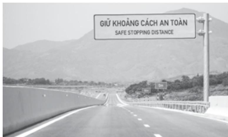
● Đường bộ cao tốc Nha Trang - Cam Lâm.

Ban An toàn giao thông (ATGT) tỉnh vừa có văn bản gửi các địa phương, sở, ban, ngành liên quan về việc tăng cường triển khai công tác bảo đảm ATGT khi đưa công trình đường bộ cao tốc Nha Trang - Cam Lâm vào khai thác.