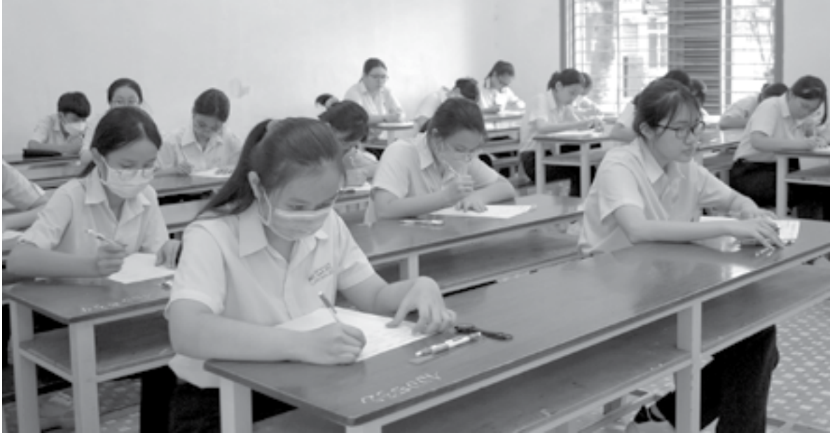
● Thí sinh dự thi tại Trường THPT Lý Tự Trọng (Nha Trang).

Ngày 5-6, các thí sinh dự thi vào lớp 10 THPT công lập trên địa bàn tỉnh năm học 2023-2024 đã hoàn thành 2 môn thi Ngữ văn và Toán theo hình thức tự luận, thời gian làm bài 120 phút. Đề thi Ngữ văn được đánh giá vừa sức với học sinh, trong khi đề Toán khá khó. Theo báo cáo nhanh từ các hội đồng coi thi, toàn tỉnh không có trường hợp vi phạm quy chế thi.