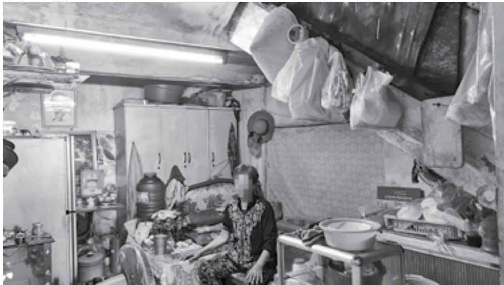
● Một người dân đã chiếm dụng gầm cầu thang để ở trong hàng chục năm qua.

Từ nhiều năm nay, một số cá nhân đã chiếm dụng gầm cầu thang Chung cư A và Chung cư B (phường Vạn Thạnh, TP. Nha Trang) làm nơi ở và buôn bán. Để đảm bảo công tác phòng cháy, chữa cháy, thời gian qua, chính quyền địa phương đã nhiều lần yêu cầu các cá nhân di dời đi nơi khác, nhưng họ vẫn chưa chấp hành.