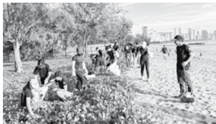
● Cán bộ và nhân viên khách sạn Novotel Nha Trang thu gom rác tại bãi biển sát Công viên Bạch Đằng.

● Hưởng ứng Ngày Môi trường thế giới, sáng 5-6, Khách sạn Novotel Nha Trang ra quân dọn rác bãi biển sát Công viên Bạch Đằng, TP. Nha Trang. Hơn 40 tình nguyện viên bao gồm cán bộ quản lý, nhân viên của khách sạn đã tham gia dọn vệ sinh, thu gom rác thải ở bãi biển. Đây là hoạt động được khách sạn duy trì suốt 11 năm qua, mỗi năm định kỳ từ 1 đến 2 lần. (Thành Nguyễn)