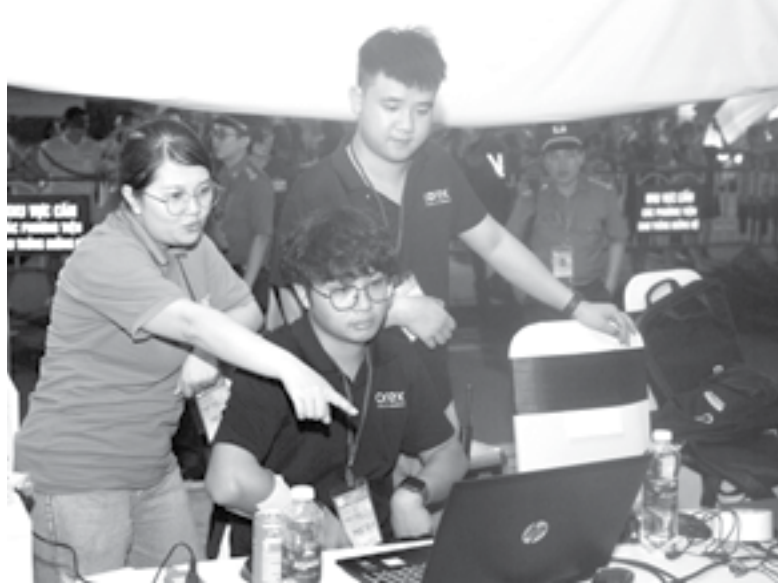
● Đạo diễn đang điều khiển drone trên máy tính.

- Để có được màn trình diễn drone hoàn hảo tại đêm khai mạc Festival Biển Nha Trang - Khánh Hòa 2023, Corex và các đối tác đã huy động khoảng 80