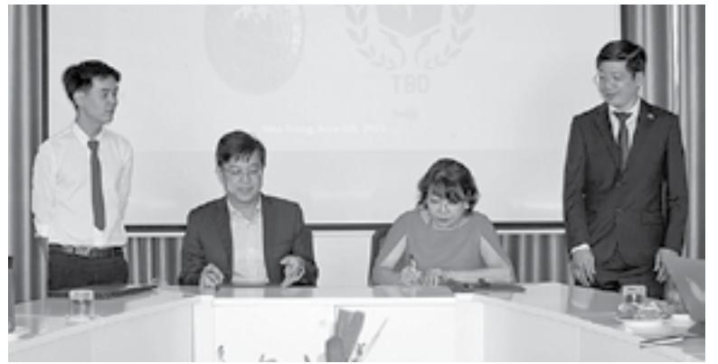
● Đại diện hai bên ký kết hợp tác.

TRƯỜNG ĐẠI HỌC THÁI BÌNH DƯƠNG VÀ TỔNG LÃNH SỰ QUẢN PHILIPPINES TẠI TP. HỒ CHÍ MINH: KÝ KẾT THỎA THUẬN HỢP TÁC