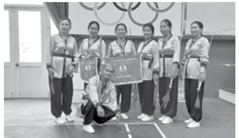
● Câu lạc bộ Dưỡng sinh Suối Cát (xã Cam Hiệp Nam) đạt huy chương bạc tại giải Người cao tuổi mở rộng TP. Nha Trang.