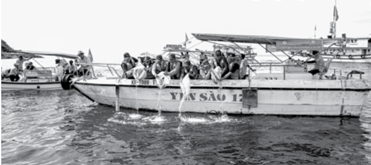
● Công ty Yến sào Khánh Hòa tổ chức thả 10.000 con cá biển giống, tái tạo nguồn lợi thủy sản trong vịnh Nha Trang sáng 5-6.