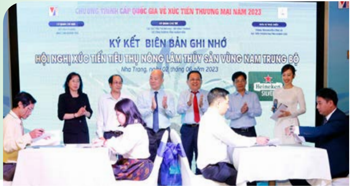
● Các doanh nghiệp ký kết biên bản ghi nhớ hợp tác tại hội nghị.