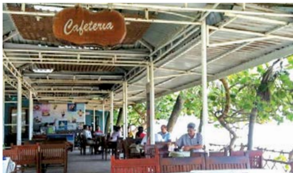
● Cửa hàng giải khát Bốn Mùa những năm 2000.