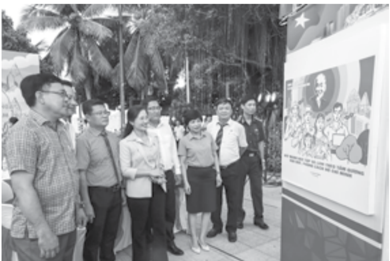
● Các đại biểu xem tác phẩm đạt giải nhất cuộc thi được giới thiệu tại triển lãm.

Chiều 2-6, tại Công viên Phù Đồng (TP. Nha Trang), Sở Văn hóa và Thể thao tổ chức lễ trao giải và khai mạc Triển lãm tranh cổ động xây dựng và phát triển tỉnh Khánh Hòa, chương trình Festival Biển 2023.