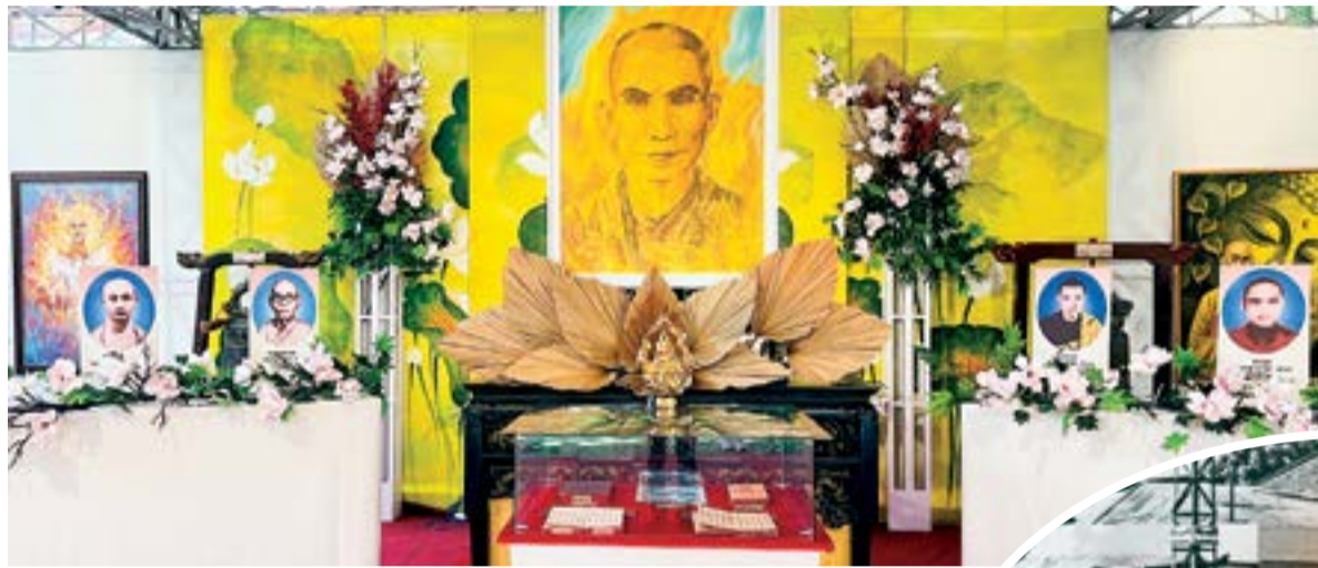
● Một góc triển lãm "Ngọn lửa thiêng".

Nhiều người rất xúc động khi được thấy di ảnh của Hòa thượng Thích Quảng Đức cùng câu nói nổi tiếng: "Tôi pháp danh Thích Quảng Đức, trụ trì chùa Quán Thế Âm - Phú Nhuận nhận thấy nước nhà đương lúc ngả nghiêng, tôi là một tu sĩ mệnh danh trưởng tử của Như Lai không lẽ cứ ngồi điềm nhiên tọa thị để cho Phật pháp tiêu vong,