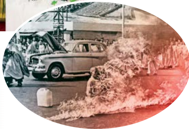
● Hình ảnh Hòa thượng Thích Quảng Đức tự thiêu ngày 11-6-1963 gây chấn động thế giới, được trưng bày tại triển lãm.