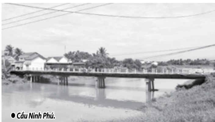
● Cầu Ninh Phú.

Cầu Ninh Phú (xã Ninh Phú, thị xã Ninh Hòa) thuộc tuyến giao thông huyết mạch của địa phương. Tuy nhiên, hiện nay, cầu đã xuống cấp, không đảm bảo an toàn, đặc biệt vào mùa mưa lũ. Người dân địa phương mong mỏi Nhà nước sớm đầu tư xây cầu mới để thuận tiện việc đi lại.