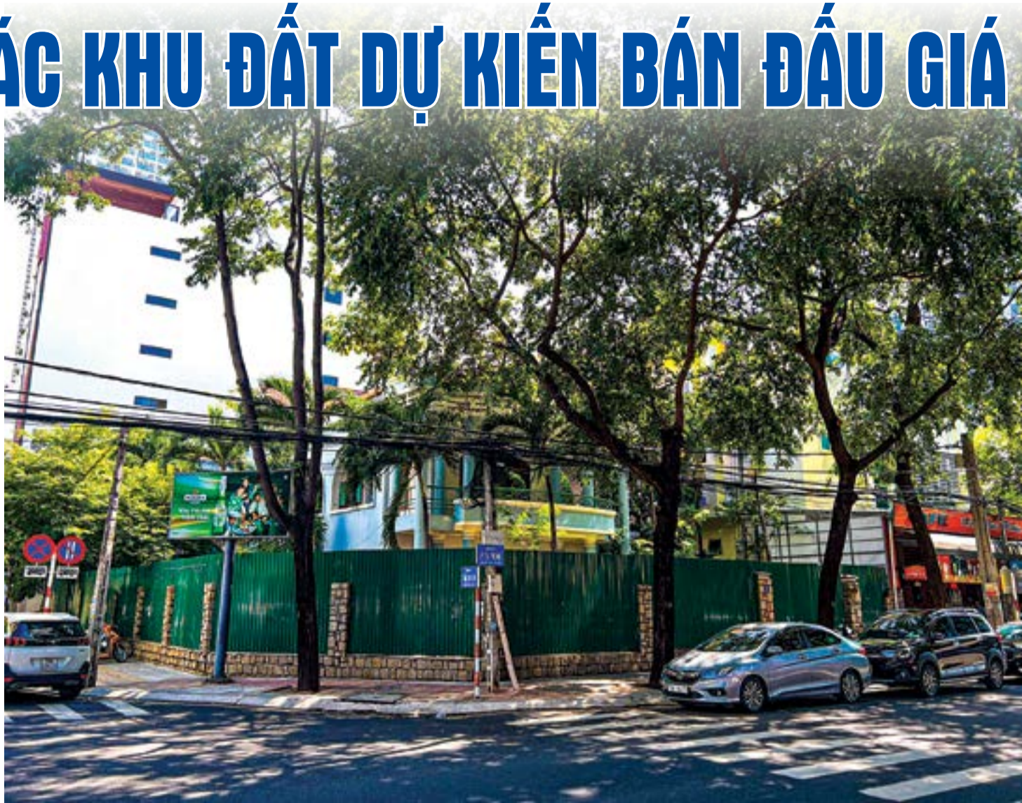
● Khu đất trụ sở cũ của Ban Quản lý dự án các công trình xây dựng TP. Nha Trang (số 6A đường Lý Tự Trọng) được UBND thành phố đề xuất giữ lại làm vườn hoa.

Đối với 8 khu đất do Trung tâm Phát triển quỹ đất tỉnh quản lý (gồm: Khu đất số 32 Khu dân cư Đường Đệ, khu đất thu hồi của Công ty TNHH Cát Phú ở xã Phước Đồng, khu đất số 45 đường Trường Sơn, khu đất 310 Nguyễn Tri Phương...), UBND TP. Nha Trang đề xuất giữ lại làm công viên, các công trình phục