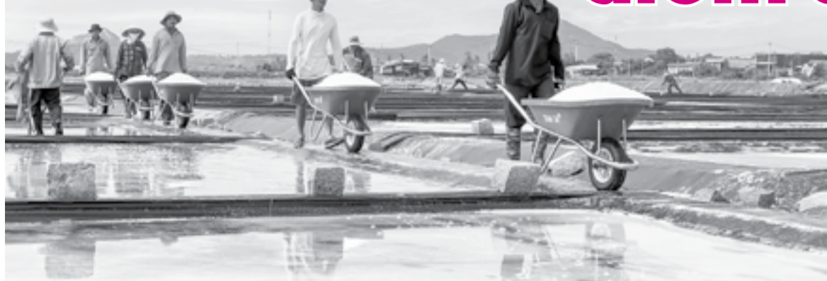
● Diêm dân phường Ninh Diêm thu hoạch muối.