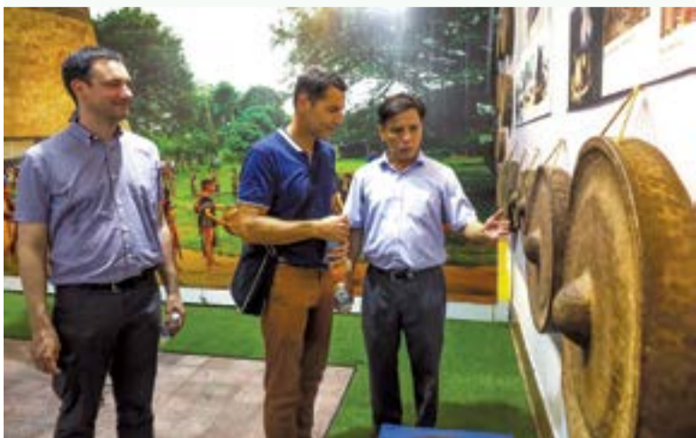
● Những vị khách nước ngoài rất thích thú khi tìm hiểu về văn hóa truyền thống các dân tộc thiểu số tại triển lãm.