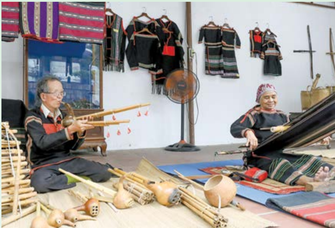
● Hai nghệ nhân người Êđê đến từ tỉnh Đắk Lắk giới thiệu các loại nhạc cụ được làm từ tre nứa và nghề dệt thổ cẩm truyền thống.

Tại triển lãm, công chúng được tiếp cận hơn 300 hiện vật, hình ảnh giá trị liên quan đến đời sống, sinh hoạt của đồng bào Êđê, M'Nông, Bana, Giarai, Raglai... Thông qua các chủ đề về: Nông nghiệp, săn bắt, đánh cá; kiến trúc nhà ở; nghề thủ công truyền thống; âm nhạc, công chiêng; nghi lễ, lễ hội đã giới thiệu khái quát những nét đặc trưng nhất trong đời sống văn hóa các DTTS dưới bóng đại ngàn Trường Sơn. Đó là hình ảnh lễ cúng bến nước, lễ ăn cơm mới, lễ cưới, lễ mừng thọ, lễ bỏ mả... mang những ý nghĩa riêng trong cuộc sống đồng bào. Ở đó còn có những hiện vật gốc, hình ảnh giới thiệu về nghề săn bắt, thuần dưỡng voi; những dụng cụ bằng tre nứa phục vụ cuộc sống lao động của người dân; những bộ chiêng bằng đồng, chiêng tre, kèn bầu, kèn đing năm, đàn T'rưng; nghề dệt vải truyền thống, nghề làm gốm; kiến trúc nhà rông, nhà dài... Ông Laurent Duval - Phó Chủ tịch Cộng đồng đô thị Lorient, Thị trưởng TP. Languidic (tỉnh Morbihan, Pháp) nhận xét: "Những hiện vật, hình ảnh được triển lãm thật độc đáo. Qua đây, tôi biết thêm về những giá trị văn hóa truyền thống của các cộng đồng dân cư ở Việt Nam. Ở TP. Languidic cũng thường diễn ra những hoạt động văn hóa cộng đồng; tôi sẽ cố gắng để liên hệ mời các bạn đến giới thiệu nét đẹp văn hóa