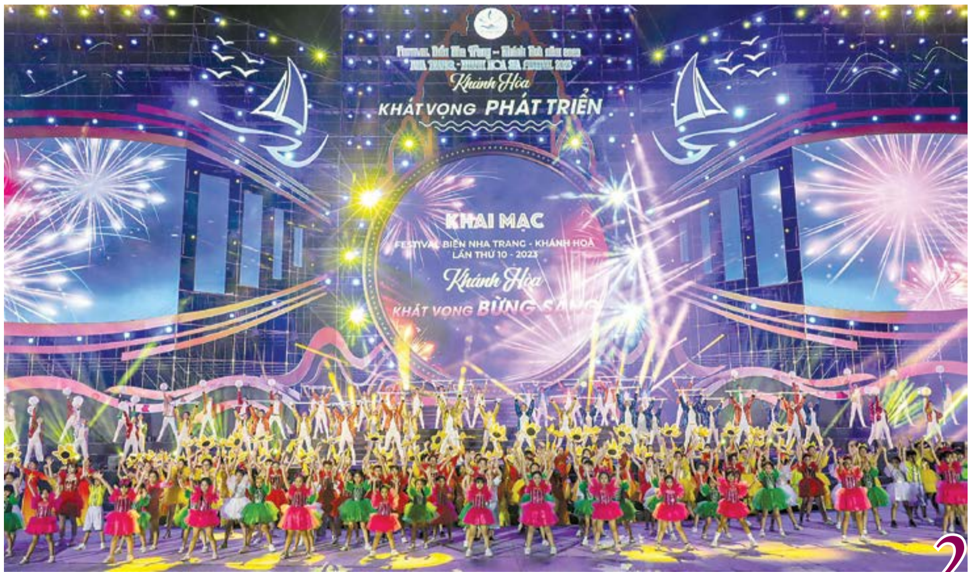
● Chương trình khai mạc Festival Biển Nha Trang - Khánh Hòa 2023.