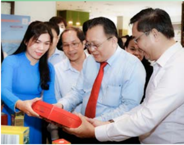
● Lãnh đạo tỉnh tham quan gian hàng trưng bày tại hội nghị.