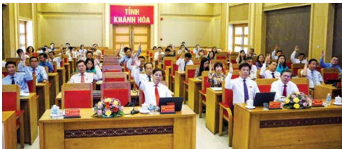
● Các đại biểu biểu quyết thông qua nghị quyết.