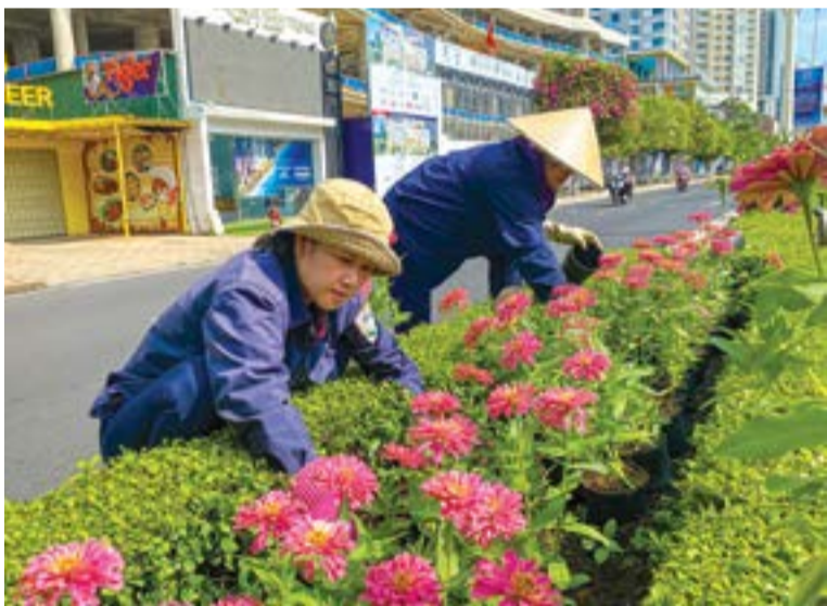
● Trang trí cây hoa trên dải phân cách đường Trần Phú.

vụ công ích thành phố đã lắp đặt nhiều cụm trang trí và mô hình trang trí đèn led chiếu sáng ban đêm tại nhiều tuyến đường trung tâm; thay thế, lắp đặt cụm chữ tuyên truyền trên 4 cổng chào. Công ty Cổ phần Môi trường đô thị Nha Trang trang trí hoa tại các đảo giao