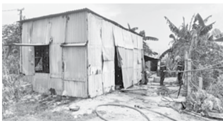
● Cảnh sát chữa cháy sau khi dập tắt ngọn lửa đã phát hiện thi thể bị cháy đen trong căn nhà.

Sau khi dập tắt đám cháy, lực lượng chức năng phát hiện tại