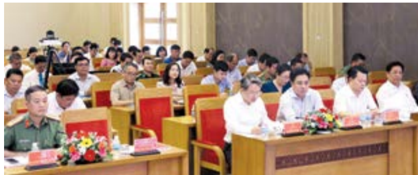
• Các đại biểu tham dự hội nghị.