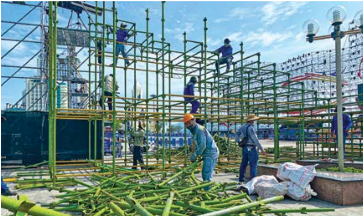
● Lắp dựng khu vực chỗ ngồi trên Quảng trường 2-4.

Những ngày này, TP. Nha Trang - tâm điểm của các sự kiện trong Festival Biển Nha Trang - Khánh Hòa 2023 đang khẩn trương hoàn thành những khâu chuẩn bị cuối cùng với mong muốn Festival năm nay diễn ra thật thành công, trọn vẹn.