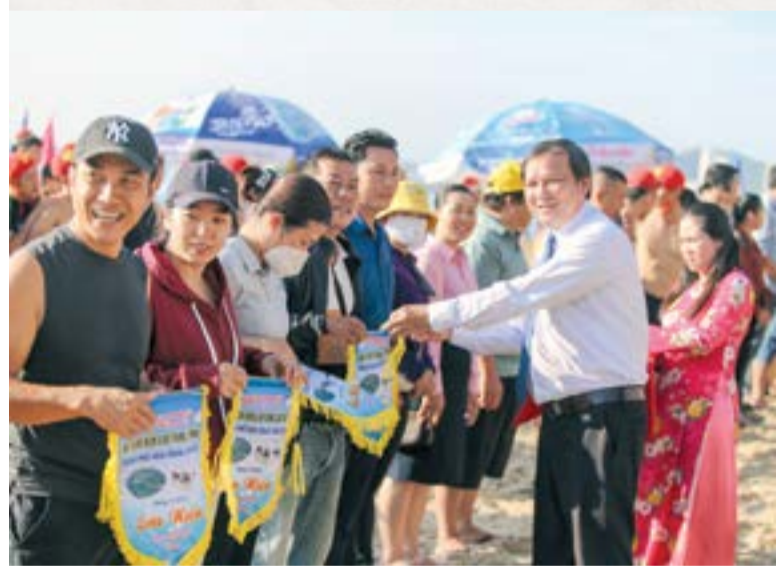
● Lãnh đạo thành phố tặng cờ lưu niệm cho các đơn vị.