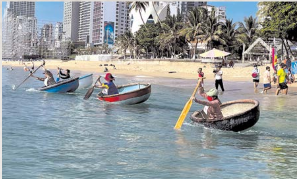
● Các vận động viên nữ tranh tài môn bơi thúng.

Sáng 26-5, tại Công viên Sứa, bờ biển Trần Phú, UBND TP. Nha Trang tổ chức giải bơi biển, bơi thúng, lắ thúng TP. Nha Trang năm 2023. Hơn 150 vận động viên (VĐV) nam, nữ của các xã, phường, câu lạc bộ (CLB), trường học trên địa bàn thành phố hào hứng tranh tài. Đây là một trong những môn thể thao giải trí mang đặc trưng phổ biến khởi động cho các hoạt động thể thao hưởng ứng chương trình Festival Biển Nha Trang - Khánh Hòa 2023.