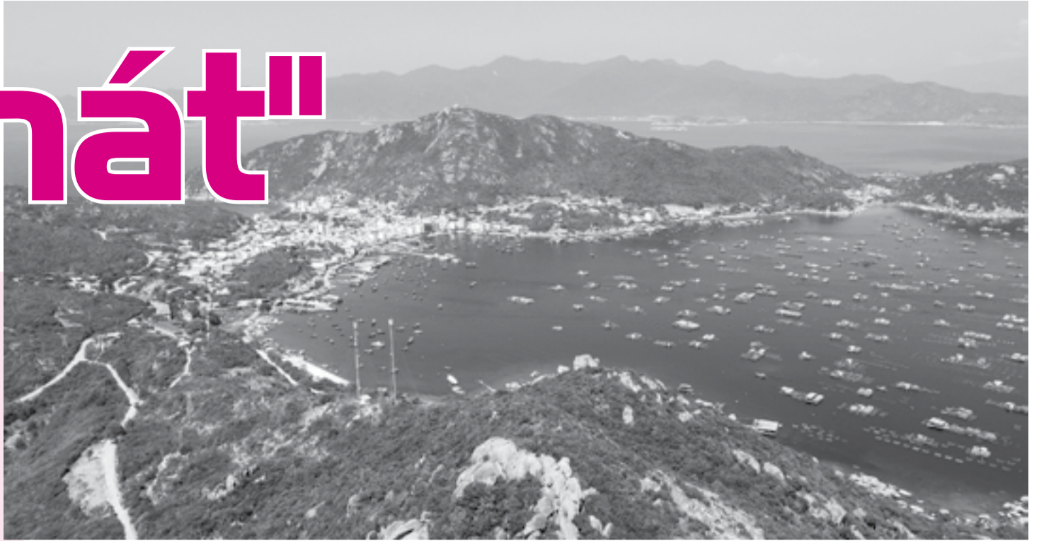
● Đảo Bình Ba - hòn đảo thơ mộng, nhiều tiềm năng phát triển kinh tế nhưng luôn trong tình trạng thiếu nước ngọt.

Hơn 2 tháng nay, gần 1.000 hộ dân trên đảo Bình Ba (xã đảo Cam Bình, TP. Cam Ranh) khổ sở vì tình trạng khan hiếm nước ngọt do mùa nắng nóng kéo dài. Dự án đầu tư hệ thống cấp nước sinh hoạt đảo Bình Ba đã được UBND tỉnh phê duyệt từ năm 2016, tuy nhiên vì nhiều lý do nên đến nay vẫn chưa được triển khai.